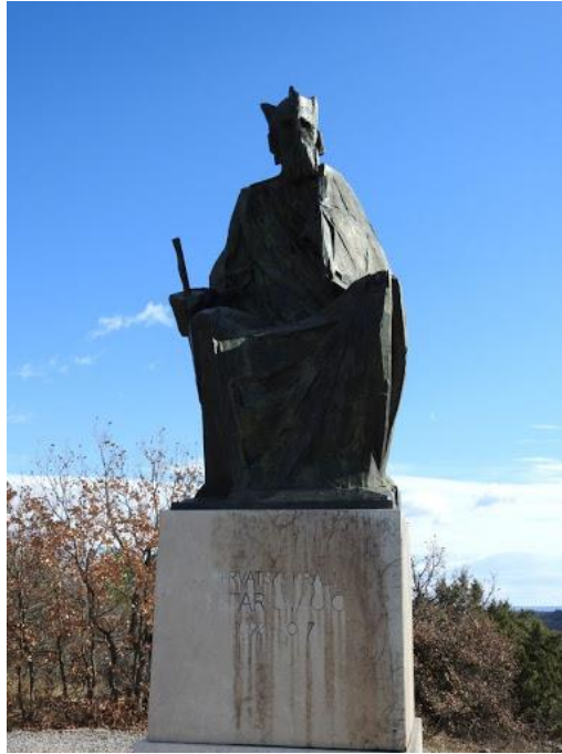
Slika 1. Kip Petra Svačića