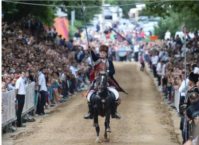
Slika 8. Sinjska alka

Alka je, dakle, jedan od najspektakularnijih oblika hrvatske kulturne baštine, koji svakog kolovoza u Sinj privuče čitavu Cetinjsku krajinu i brojne turiste. Na Listi svjetske baštine UNESCO-a je od 2010. 67