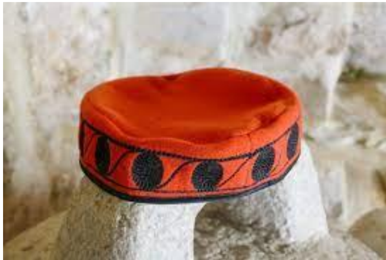
Slika 11. Šibenska kapa

Današnja šibenska kapa amalgam je šibenske i drniške kape, koja je u vrijeme širenja proizvoda Industrije narodnog veziva u raznim krajevima prozvana kapom šibenkinjom. Stariji oblik kape koji je bio niži, crvene boje, najčešće s jednim nizom povezanih krugova, navezena i po tjemenu, s kitom, sačuvan je s muzejskim primjercima koji se danas čuvaju u bečkom Muzeju nacionalne etnografije, Etnografskom muzeju u Splitu, Etnografskom muzeju u Zagrebu, Etnografskom muzeju u Beogradu, Narodnom muzeju u Zadru, Muzeju grada Šibenika, Gradskom muzeju Drniša i Kninskom muzeju. 90