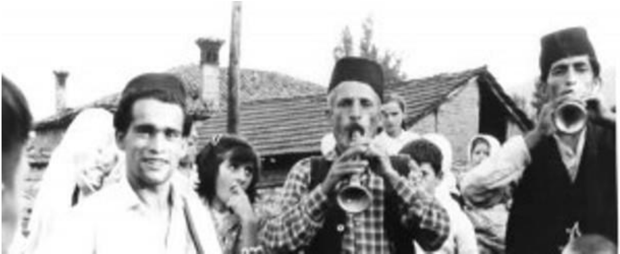
Slika 15. Sijelo

na to bi ukazivala samo suptilno, dodavanjem vode, osmijesima. Svrha cijeloga sijela je da se dvoje mladih što bolje upozna i zabavlja. 104