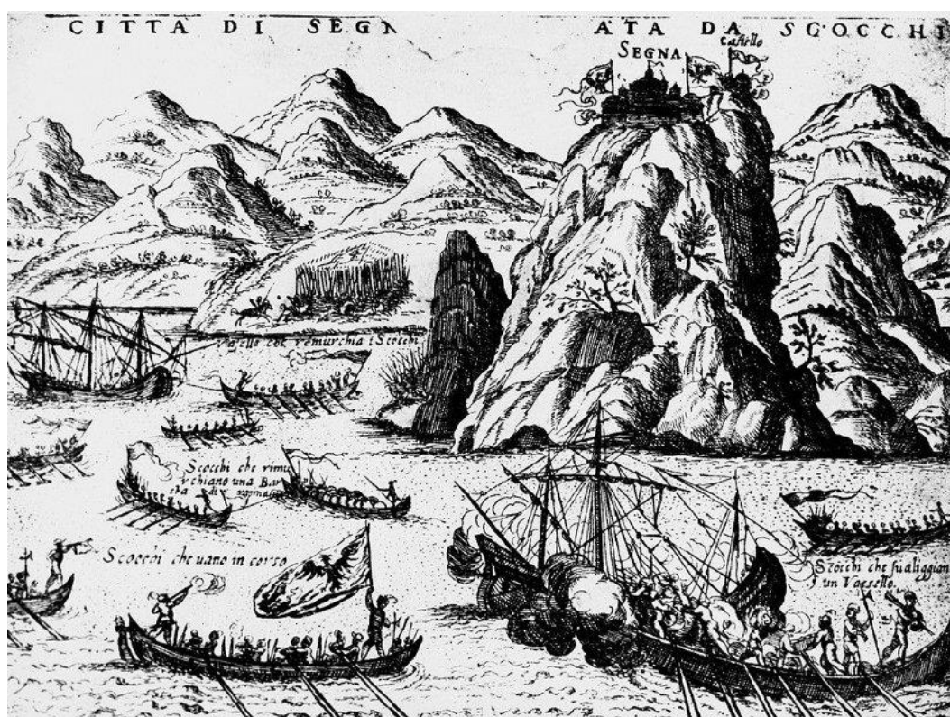
Slika 5. Uskoci

Kao što je već navedeno, nakon dugotrajnih opsada i juriša osmanske vojske, kliška je tvrđava osvojenja i pripala Osmanlijama 1537. Njezin zapovjednik Petar Kružić poginuo je dolazeći u pomoć s vojskom, a preživjeli su nastavili borbu s Osmanlijama te se tako povijest senjskih uskoka, s kojima su se već 80 godina susretali žitelji Zagore, utkala u njezinu povijest. Uskočki zapovjednik u Neoriću prkosio je i dalje pa je sa svojom posadom i napadao Osmanlije, ali ni to nije dugo potrajalo jer ga je drniški dizdar opkolio 1538. kod Banove česme i ubio cijeli odred sa zapovjednikom. Nakon toga su se preostali uskoci povukli iz neoričke kule na Moseć. Osmanlije ih po tako besputnom terenu nisu mogle goniti pa su uskoci, držeći se planinskih grebena, uspješno došli do Senja. Da bi nastavili akcije, uskoci su još više pojačali svoju mrežu suradnika u Zagori, od kojih su dobivali dragocjene obavijesti. Nakon zauzimanja Klisa, Osmanlije su formirale istoimeni sandžak u sklopu kojeg su se nalazile nahije Zagorje i Klis. Poslije sljedećeg rata, koji se vodio od 1537. do 1540., u tijeku kojega je Husrev-beg došao sve do pod zidine Trogira, mletačka vlast u zagorskim selima koja su nekoć pripadala primorskim gradovima bila je gotovo potpuno onemogućena. 46