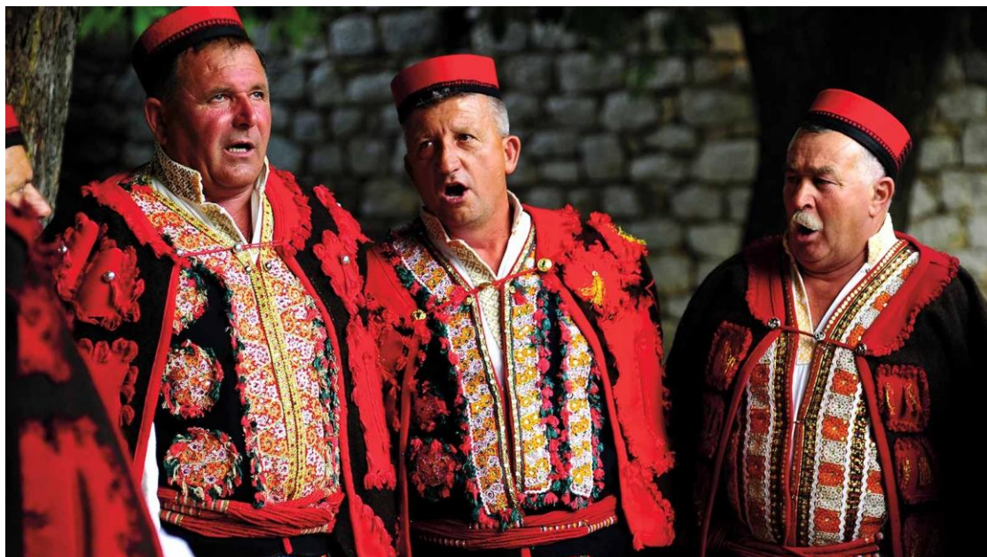
Slika 9. Ojkanje

dosluhu s današnjim ustaljenim intervalima. U navedenim formama polifone strukture dominira interval velike sekunde jer napjevi često i završavaju na velikoj sekundi, što se tretira kao konsonantni interval. 72