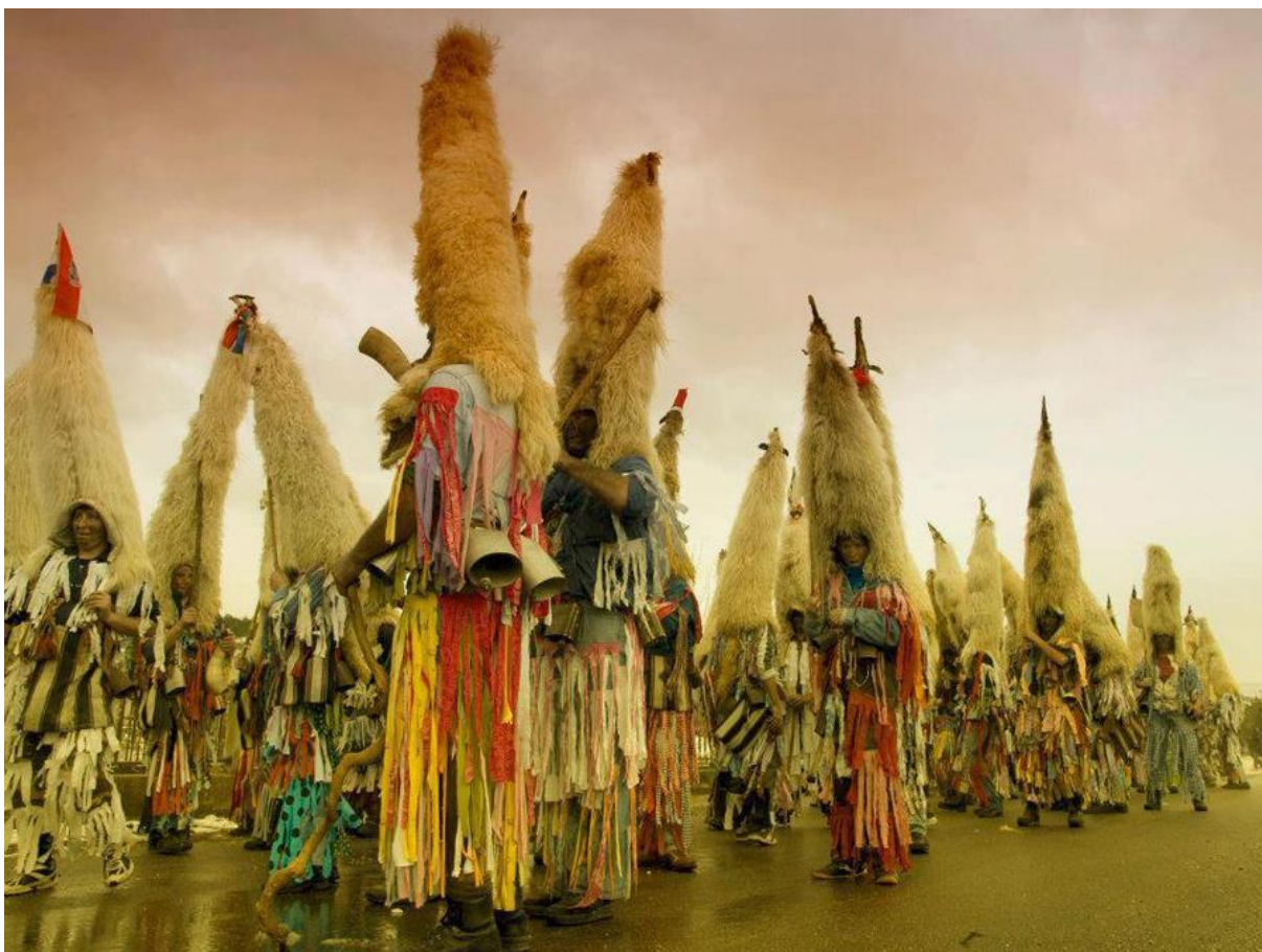
Slika 13. Godišnji pokladni ophodi mačkara podkamešničkih sela