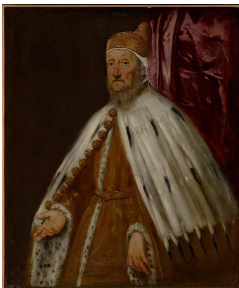
Slika 4. Pietro Loredan