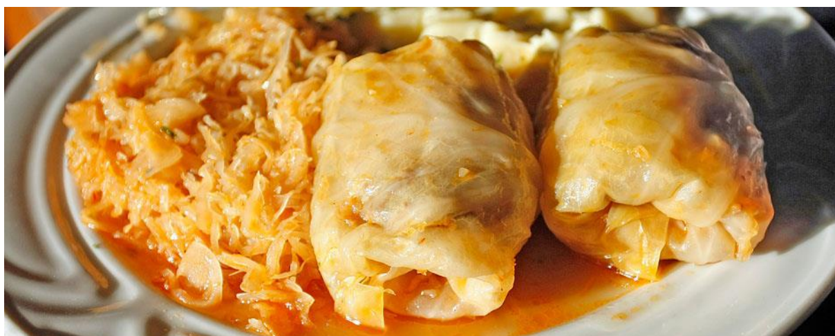
Slika 12. Sinjski arambaši

Sinjski arambaši neizostavan su dio jelovnika svih proslava, a pripremaju se za Božić, Veliku Gospu, svečani alkarski ručak, svadbe i druge prigode. Sinjski arambaši pripremaju se od kilograma svježeg goveđeg mesa isjeckanog na sitne komadiće. Uz meso, posebno se spravlja pešt od dvije kapule , 4 do 5 češnjeva luka, 15 dekagrama dimljene svinjske slanine i pola kitice petrisimula . Dodaje se biber , sol, muškadni oraščić, a u nekim se domaćinstvima i cimet i klinčice te naribanu koricu jednog limuna. Sve navedeno se dodaje mesu te se ono ostavlja da odleži jedan sat. Zatim se zavija u listove kiselog kupusa. Na dno lonca ili bakre stavlja se komad goveđe kosti koja se pokriva usitnjenim kiselim kupusom, na koji se zatim poredaju arambaši i ponovno prekriju kiselim kupusom. Na sve to doda se jedna žlica konšerve i komad pršuta ili suhe junetine, a ponekad se doda i nekoliko sudžuka . Sve se zalije vodom do visine arambaša i kuha se dva sata. 92