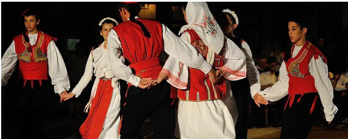
Slika 10. Izvođenje nijemog kola

dvije ili više njih da ih svi prisutni dobro vide, a onda snažno poskakuje s jedne noge na drugu, povlači istodobno partnerice, isprobava javno njihovu vještinu, naizgled bez određenih pravila, spontano, ovisno o raspoloženju i želji za isticanjem ili snažnim kretanjem kad se krupnim koracima hvataju s ostalima u zajedničko kolo. Kao samostalan ples izvodi se neovisno o vokalnoj ili instrumentalnoj izvedbi, koja može biti usporedna, ali ne mora postojati. Nijemo kolo ujedno može ili ne mora biti nastavak igranja kola uz pjesmu. Brojne su inačice kola i mogućnosti kombiniranja međusobnog držanja partnera, strukture koraka i figura, a prema razlikama u izvedbi, kao i prema razlikama u nošnji i pjevanju, stanovnici pojedinih mjesta međusobno se prepoznaju. Većina stanovnika Dalmatinske zagore Hrvati su rimokatoličke vjere, a ima sela mješovitog sastava, gdje su rimokatolici u većini, odnosno sela s više stanovnika pravoslavne vjere. 81