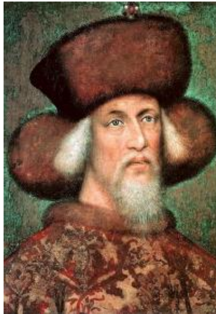
Slika 3. Kralj Žigmund

na Uljene kamenice, od kojih je na sjevernoj strani napravljen križ na javnom putu. Odatle na selo Mačni Dolac, pa pod brdo Strbac, gdje je Gradina, pa pod brdo Pečnjak, na javnom putu gdje je stari križ, nasuprot kojemu je područje grada Trogira. 32