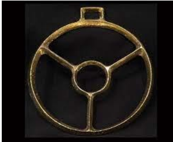
Slika 7. Alka

punata. Slavodobitnik dobiva simboličnu nagradu i novac, koji najčešće potroši na čašćenje svih sudionika natjecanja. 61