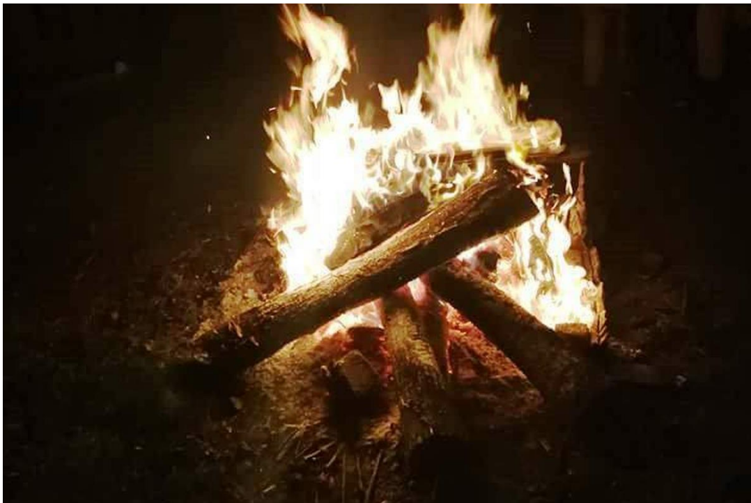
Slika 16. Paljenje Badnjaka

Uz sve navedeno, u Glavnini Donjoj bio je običaj i da najstariji čovjek iz obitelji unosi badnjake u sve kuće zaseoka. Na vatri badnjaka su se zatim palile svijeće, a često su se u vatru u kojoj su panjevi gorjeli dodao i dio jela i pića koje su ukućani konzumirali. Pepeo badnjaka je služio za posipanje voća i polja kako bi oni u narednoj godini urodile plodom. 108