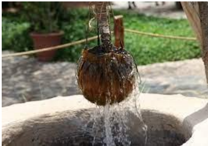
Slika 17. Vjedro vode

Blagoslov vode obavlja se na Sveta tri kralja u crkvi ili pred crkvom. Posvećena voda se u narodu naziva i svetom, kršenom vodom . U nekim su krajevima ljudi iz crkve donosili veliku posudu svete vode. U Poljicima bi na Vodokršće iz svake kuće netko iz obitelji pred crkvu donosio vjedro vode u koje bi svećenik, prilikom blagoslova, stavio malo blagoslovljene soli, prekrižio ga i u vodu spustio križ. 116