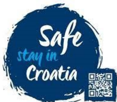
Slika 10. Oznaka Safe stay in Croatia