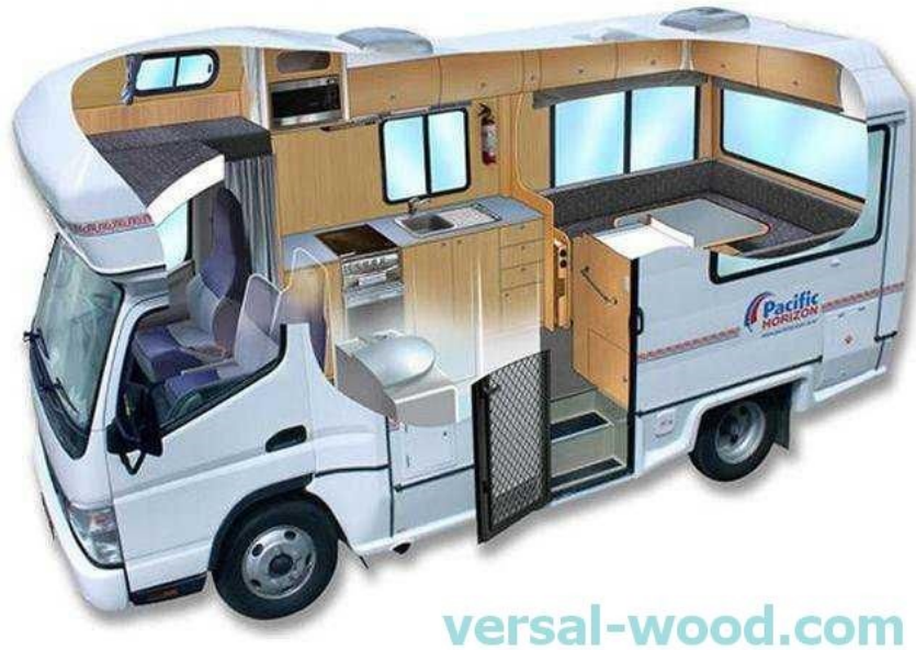
Slika 5. Kamper - presjek