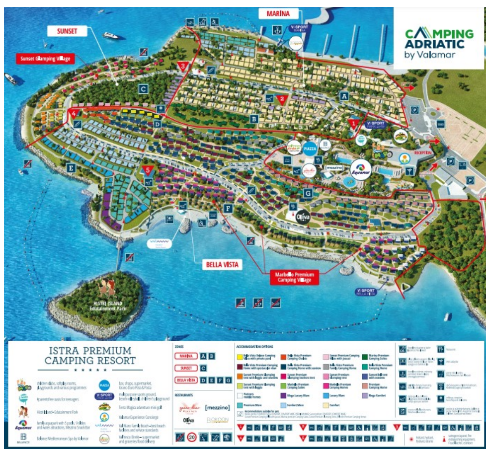
Slika 11. Mapa kampa Istra Premium Camping Resort