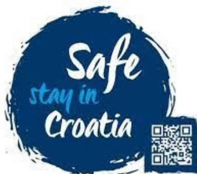
Slika 10. Oznaka Safe stay in Croatia