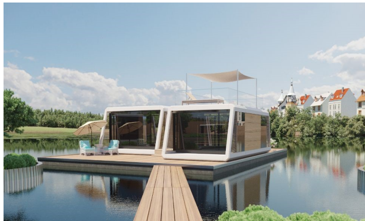
Slika 6. Plutajuća kućica