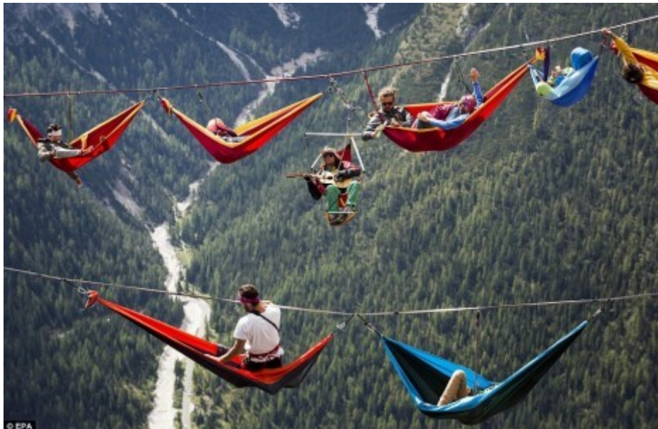
Slika 9. Primjer Extreme campinga