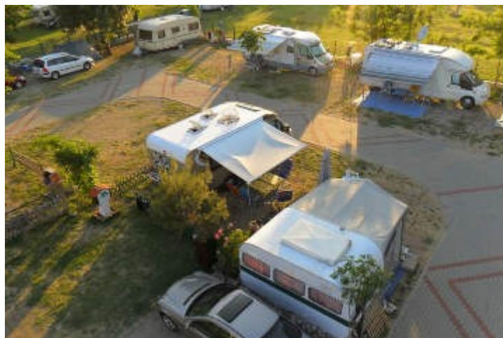
Slika 1. Kamp parcela