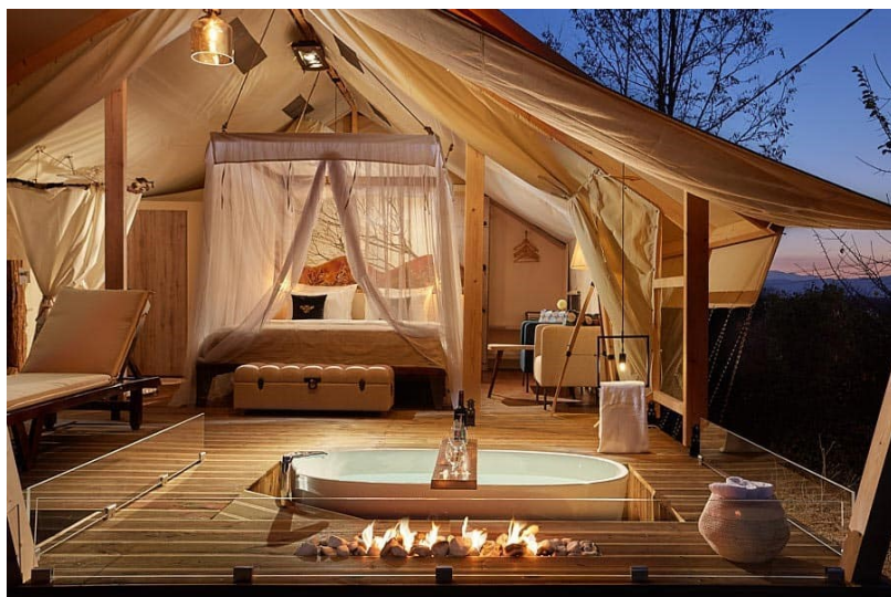
Slika 7. Glamping šator