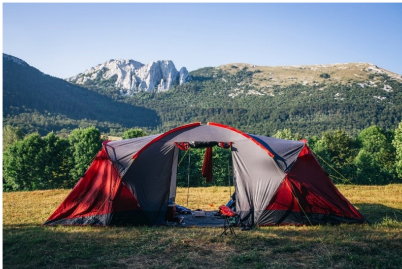
Slika 3. Šator