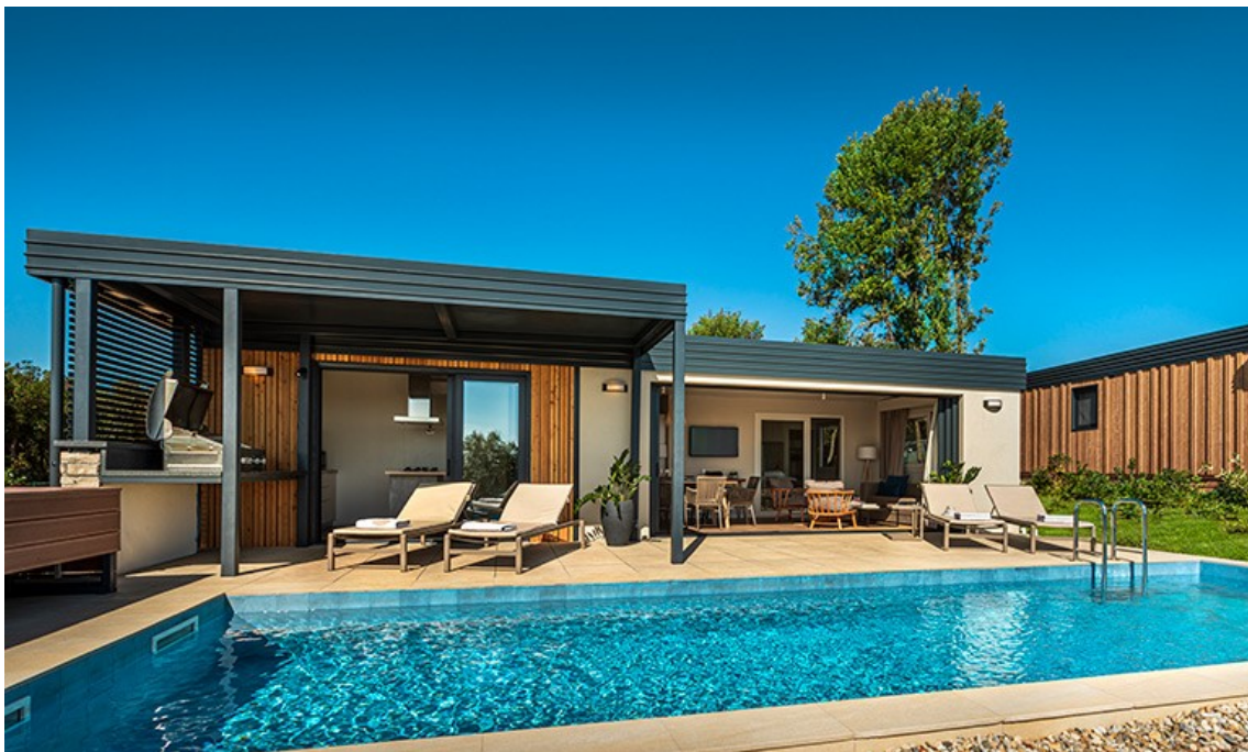
Slika 2. Bella Vista Premium Chalet