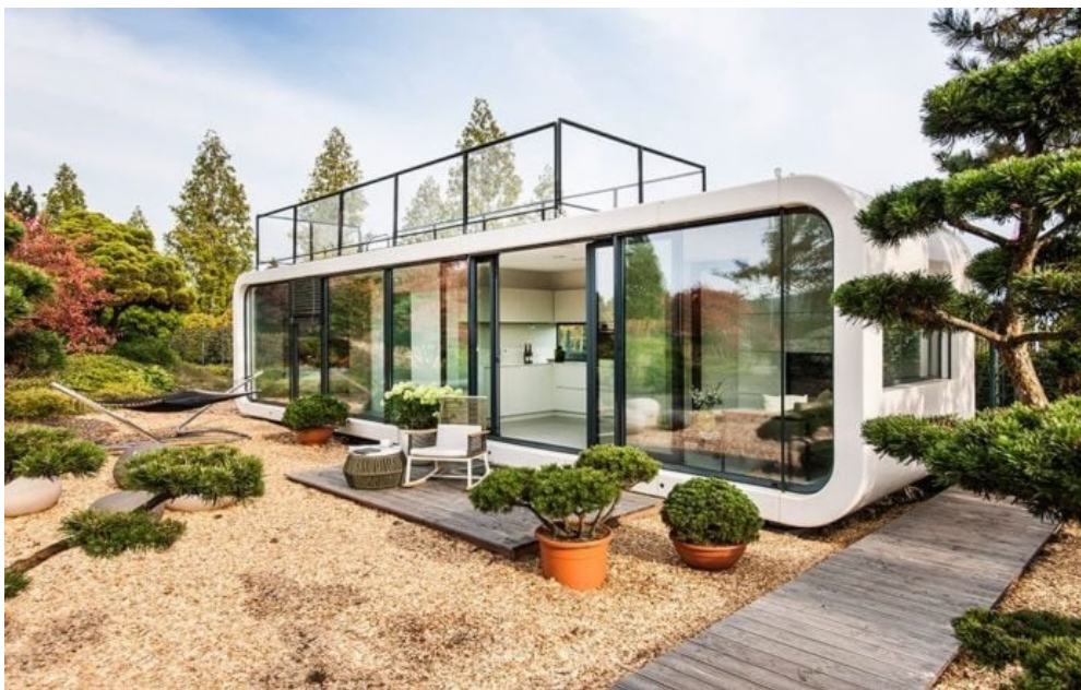
Slika 8. Coodo mobile home