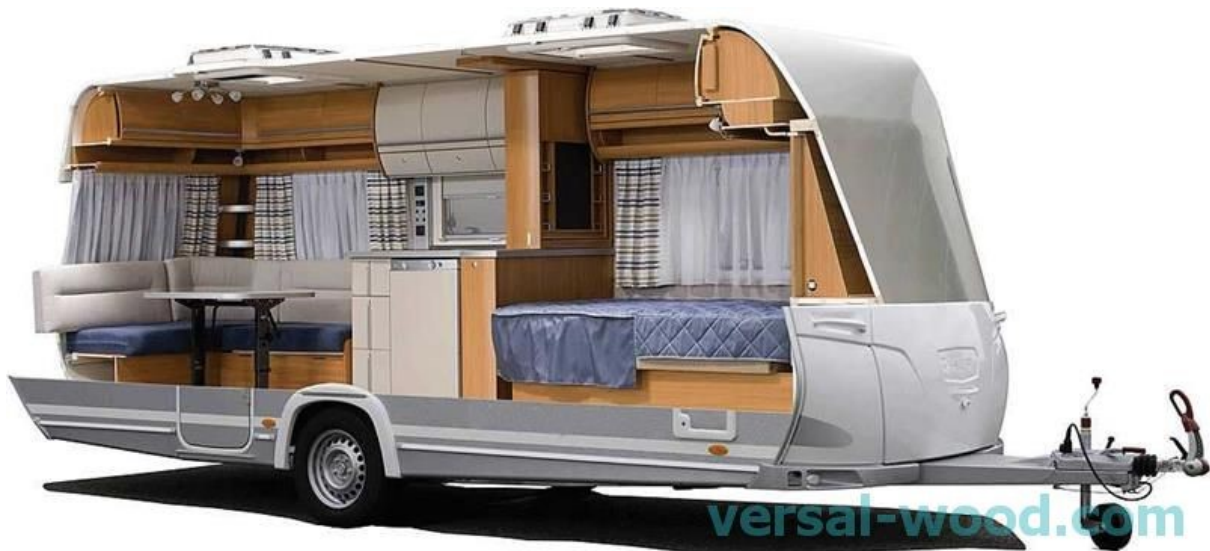
Slika 4. Kamp prikolica - presjek