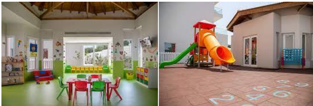
Slika 8. Vangelis Hotel & Suites Protaras, Cipar