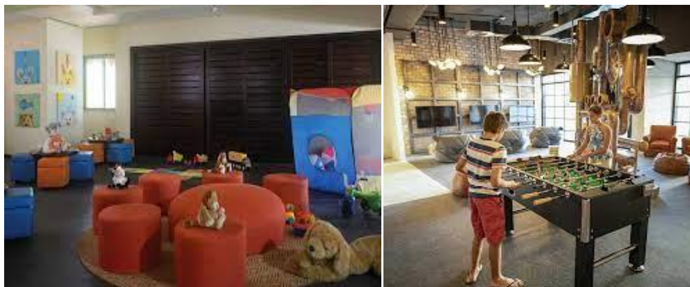
Slika 11. The Reserve at Paradisus Palma Real Punta Cana