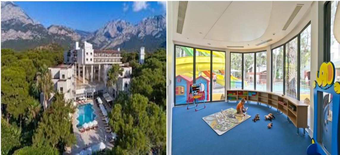
Slika 10. Seven Seas Hotel Life Goynuk, Turska