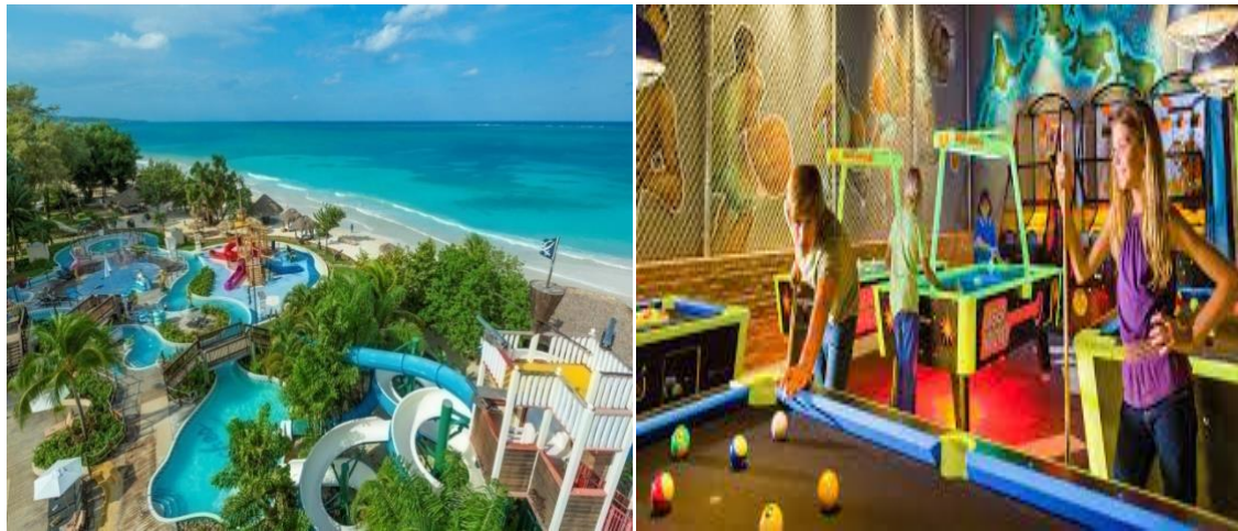
Slika 9. Beaches Negril Resort & Spa Negril, Jamajka