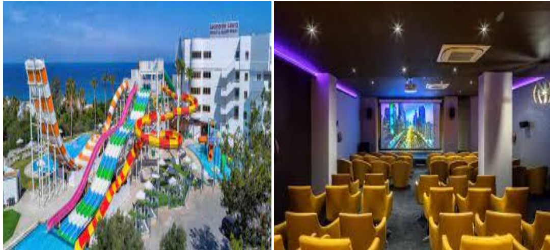
Slika 6. Leonardo Laura Beach & Splash Resort Paphos, Cipar