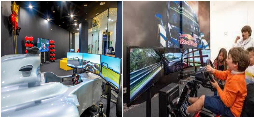
Slika 4. Interaktivna dvorana sa simulatorom