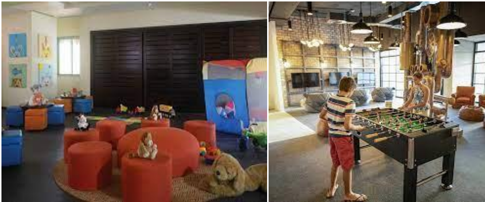
Slika 11. The Reserve at Paradisus Palma Real Punta Cana