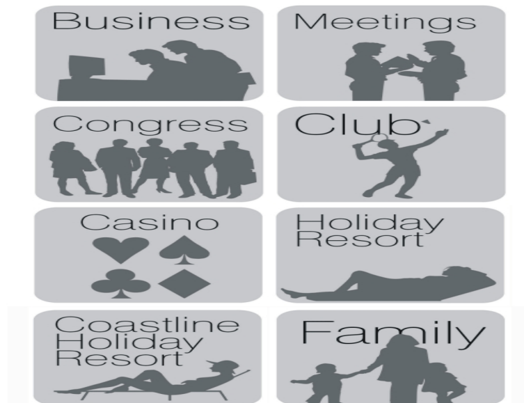
Slika 1. Primjeri oznaka posebnih standarda hotela u Hrvatskoj