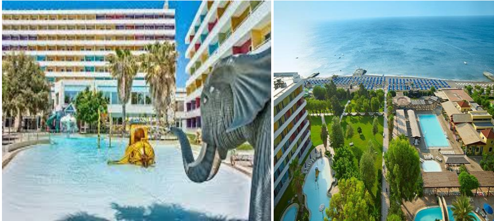
Slika 5. Esperides Beach FamilyResortFaliraki, Grčka