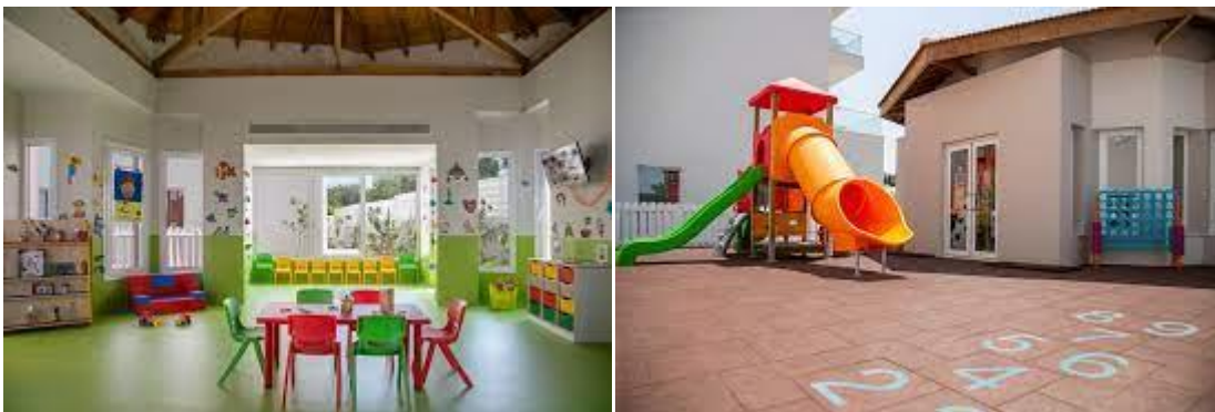
Slika 8. Vangelis Hotel & Suites Protaras, Cipar

Izvor: https://www.vangelishotel.com/ (05.06.2021.)