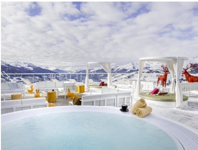
Slika 7. Club Med Peisey-Vallandry