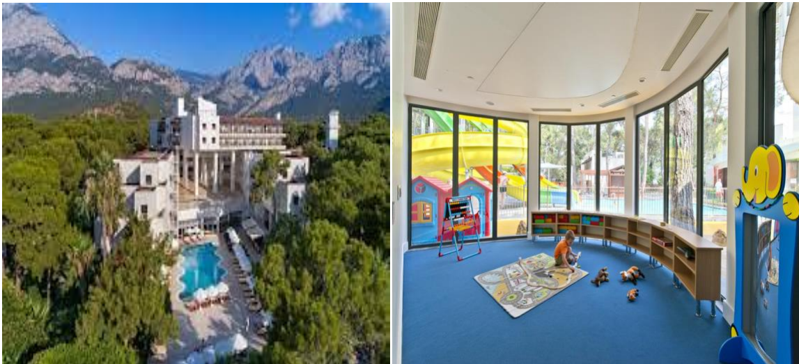
Slika 10. Seven Seas Hotel Life Goynuk, Turska