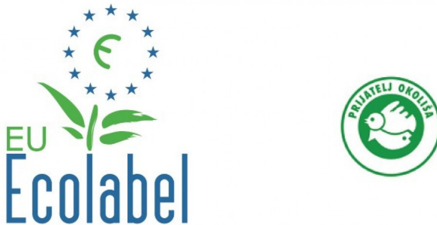
Slika 1: Ekološke oznake Europske unije "EU Ecolabel" i zaštite okoliša "Prijatelj okoliša"

Izvor: Hrvatska gospodarska komora, Ekološke oznake: Stroga mjerila za najzahtjevnije potrošače , dostupno na: https://www.hgk.hr/ekoloske-oznake-stroga-mjerila-za-najzahtjevnije-potrosace (pristupljeno 29.10.2020.)