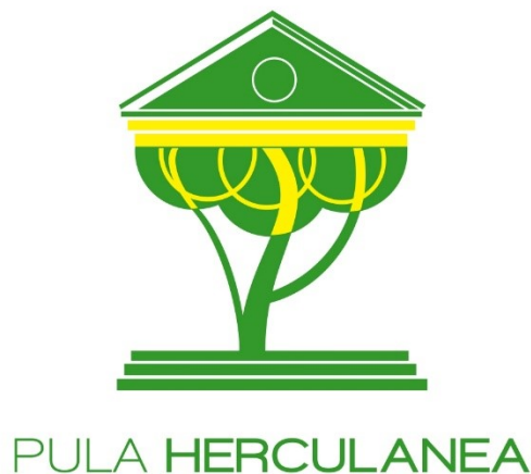
Slika 3: Logo "Pula Herculanea" d.o.o.

Izvor: „Pula Herculanea“ d.o.o.: https://www.herculanea.hr/