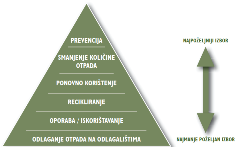
Slika 2: Hijerarhija gospodarenja otpada