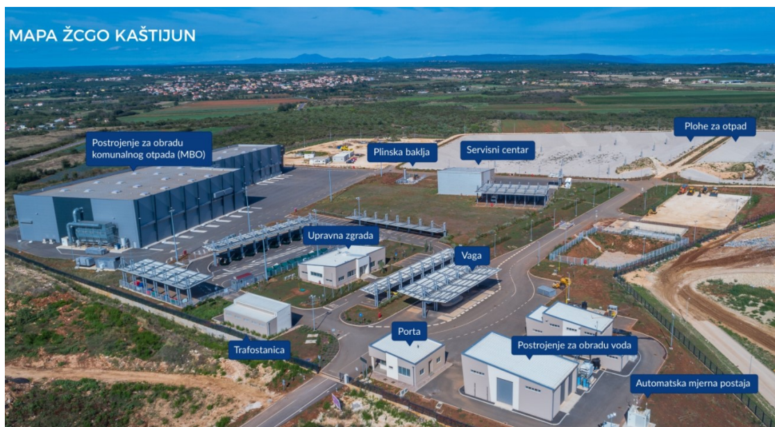
Slika 7: Mapa ŽCGO "Kaštijun" d.o.o.

Izvor: ŽCGO „Kaštijun“ d.o.o.: https://www.kastijun.hr/hr/zeleno-srce-istre/zcgo/ (pristupljeno 22.2.2021.)