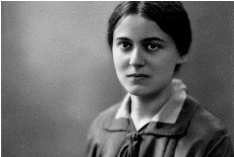
Slika 3. Edith Stein