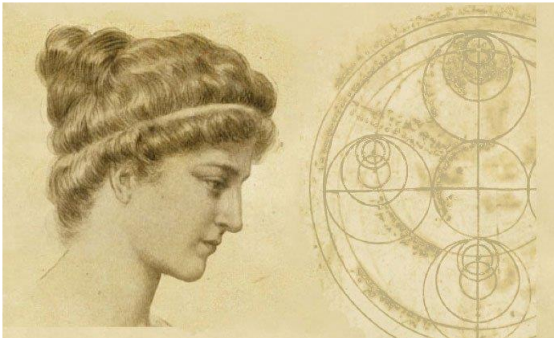
Slika 11. Hipatija