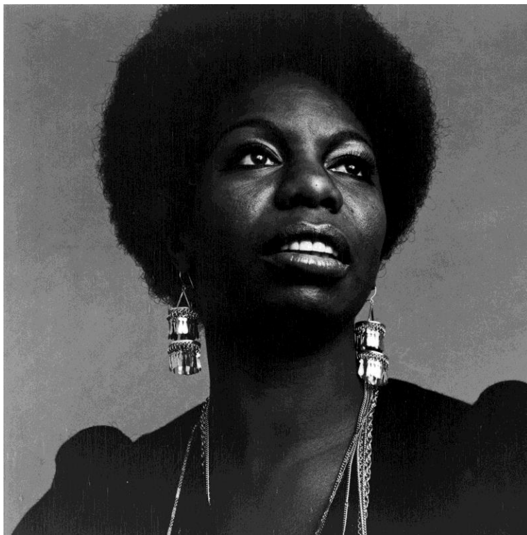
Slika 6. Nina Simone