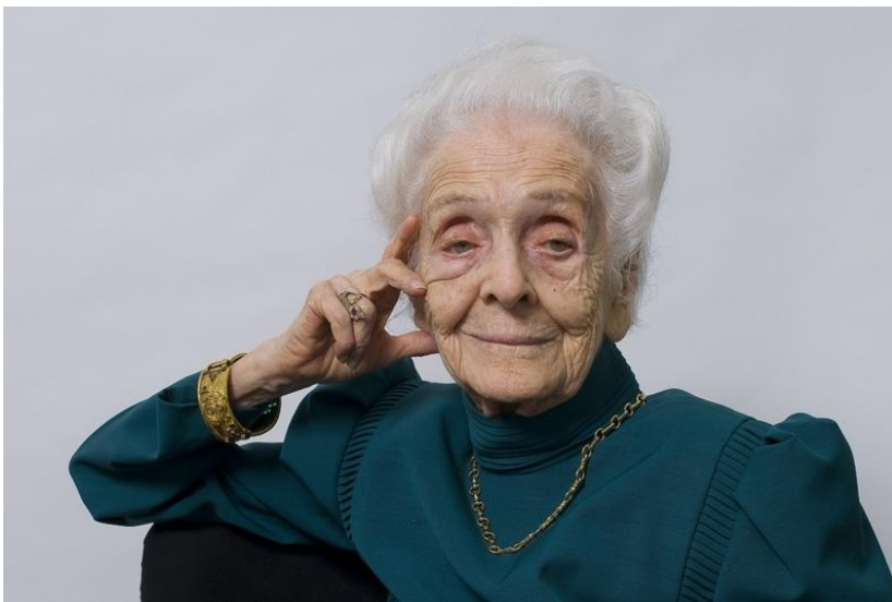
Slika 7. Rita Levi Montalcini