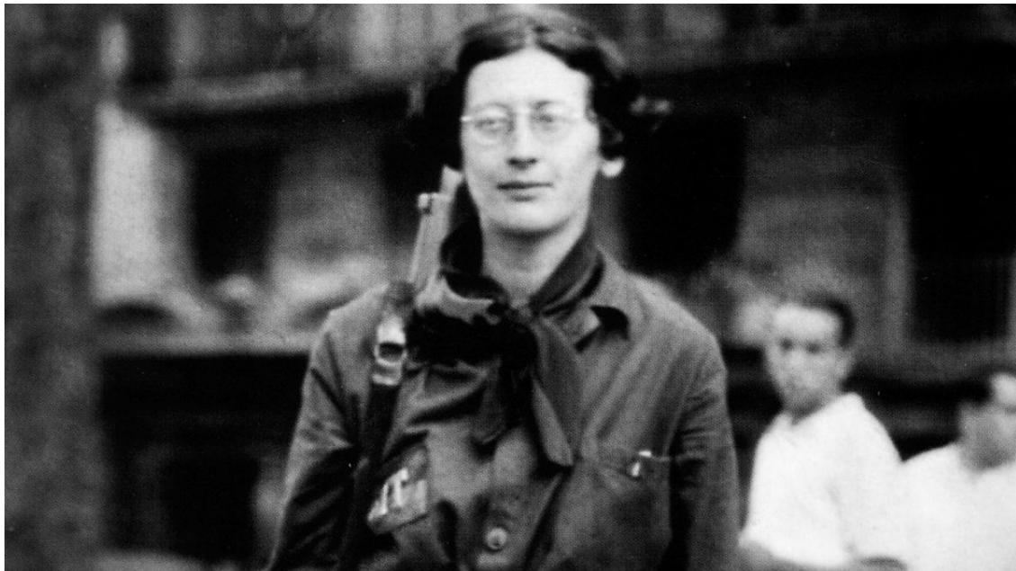
Slika 4. Simone Weil