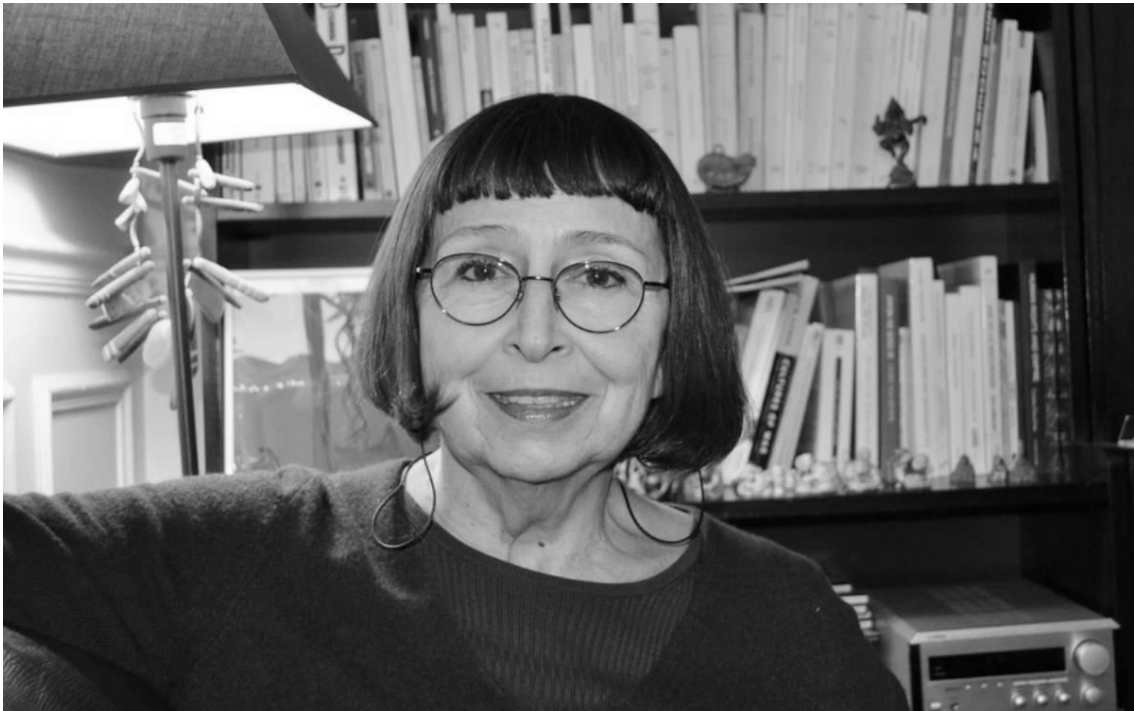
Slika 12. Rada Iveković