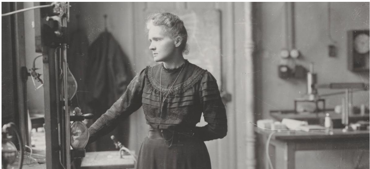
Slika 1. Marie Curie