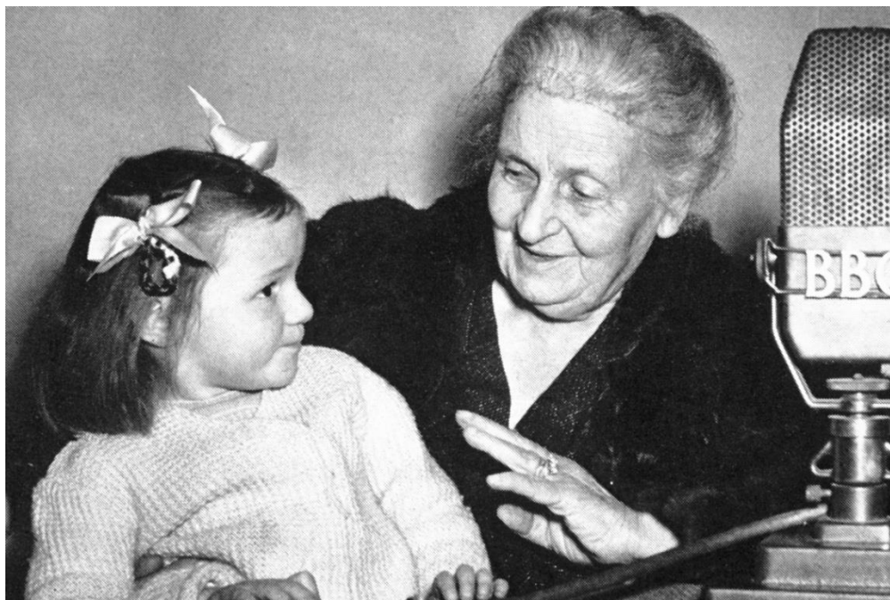
Slika 8. Maria Montessori