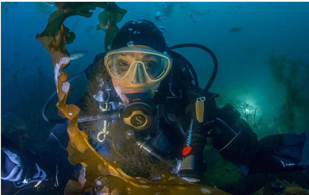
Slika 9. Sylvia Earle