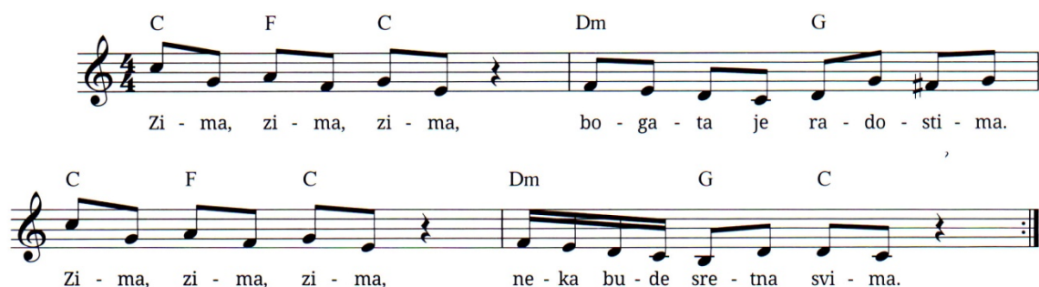
Primjer 102. Pjesma Sretna zima , t. 1-4