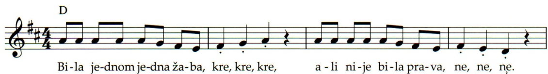
Primjer 72. Pjesma U bajkama , t. 1-4