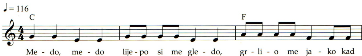
Primjer 74. Pjesma Medo , t. 1-3