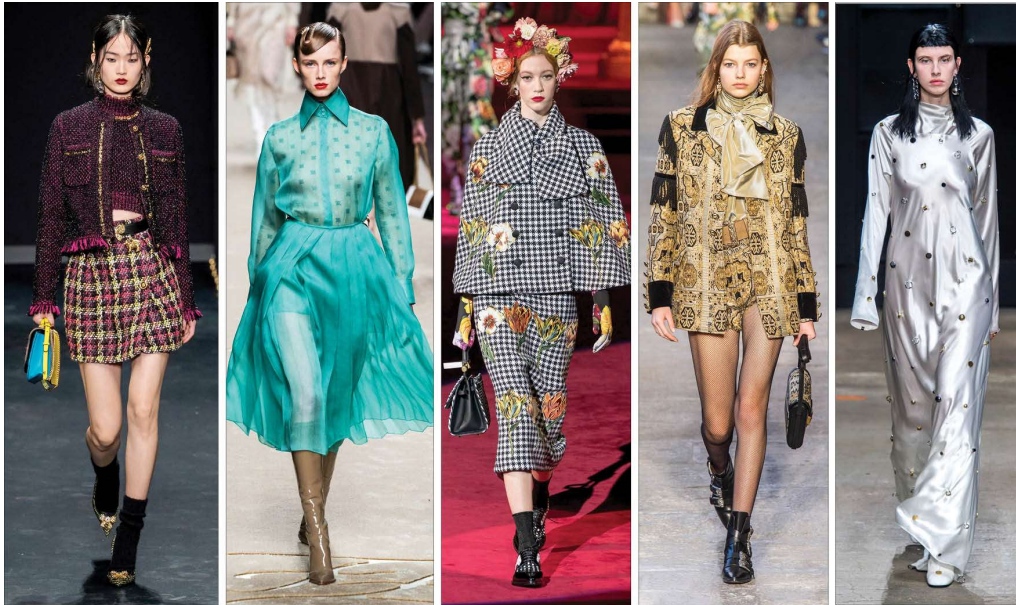
Slika 4. Milano Fashion Week