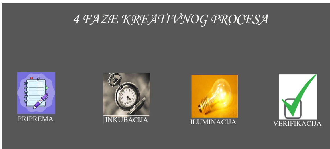
Slika 1. Faze kreativnog procesa

Četvrta faza: se naziva fazom verifikacije. U njoj se rješenje problema odnosno ideja oblikuje na način da se može na njoj dalje raditi i komunicirati ideju s okruženjem.