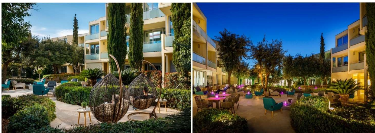
Slika 15. Vanjski vrt - Valamar Argosy Hotel