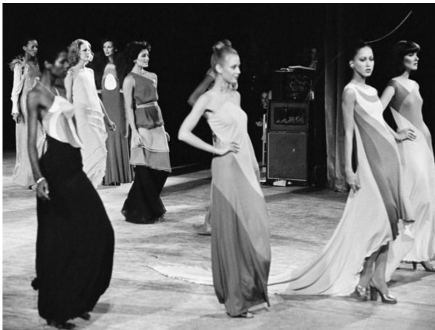
Slika 5. Paris Fashion Week 1973.

Izvor: https://www.anothermag.com/fashion-beauty/10760/the-legendary-1970s-fashion-show-that-pitched-france-against-america , pristupljeno: (20.4.2021.)