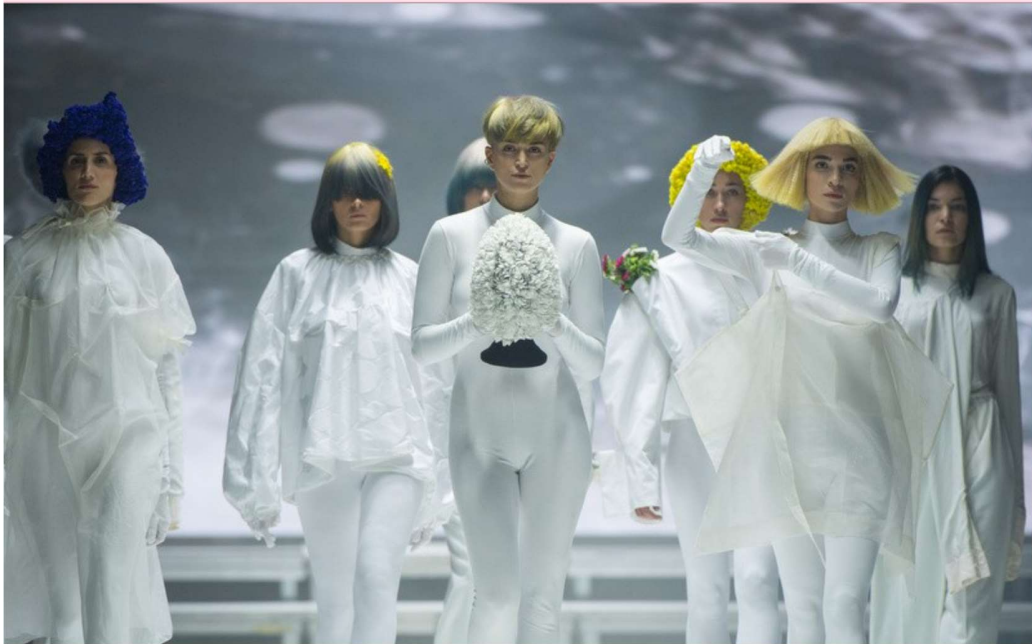
Slika 6. Athens Fashion Week 2020.