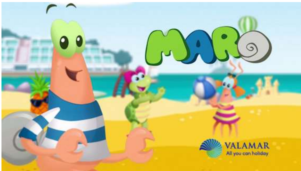
Slika 9. Maskota Valamara- Maro