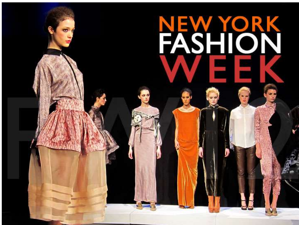
Slika 2. New York Fashion Week