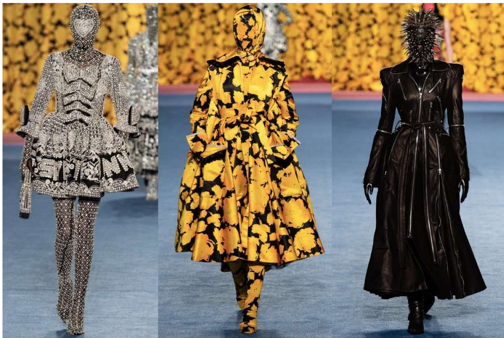
Slika 3. Kreacije dizajnera Richarda Quinna sa Londonskog tjedna mode