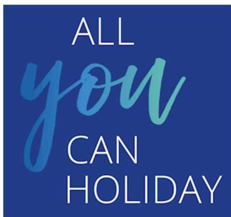
Slika 7. Slogan Valamara