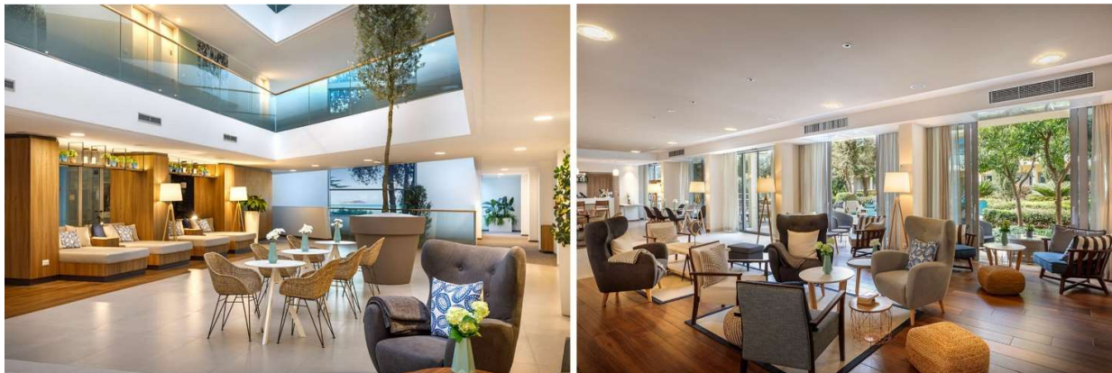
Slika 12. Lobby bar - Valamar Argosy Hotel