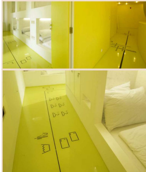
Slika 10. Prikaz signalizacije u hostelu Goli i Bosi