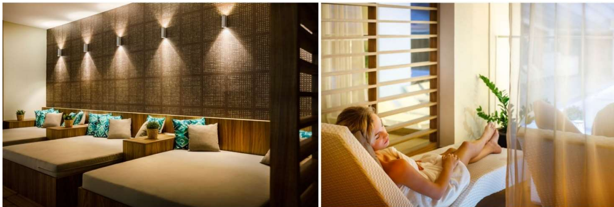
Slika 14. Wellness - Valamar Argosy Hotel