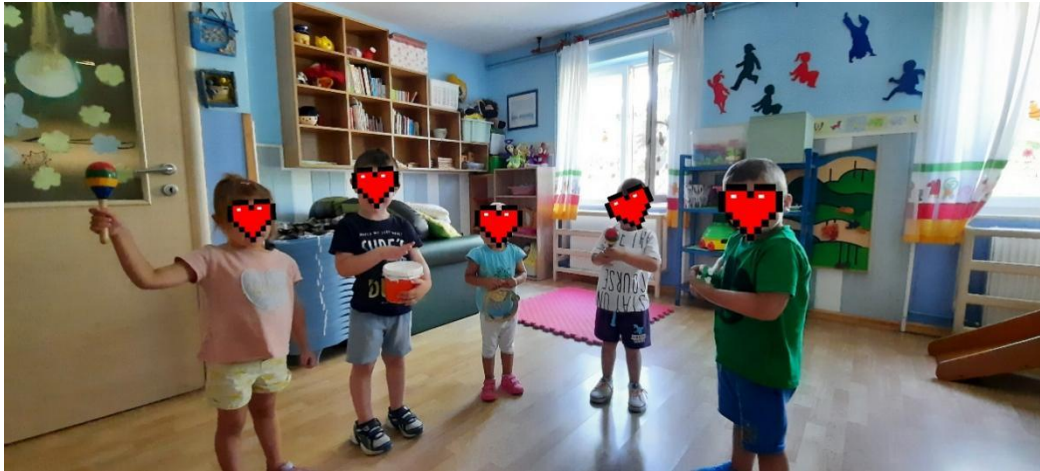
Slika 9. Mali orkestar