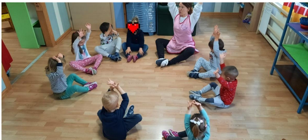
Slika 10. Provođenje plesne aktivnosti u vrtiću

Voditelj plesnog odgoja mora sam potaknuti djecu na pokret, zatim na ples koji odgovara njegovoj dobi, te stupnju složenosti pokreta. Jednostavni plesni elementi se uvode u rad s djecom predškolske dobi na njima pristupačan način, a može započeti od njihove treće godine života. Prilikom rada važno je poznavati psihofizičke osobine, njihove sklonosti i mogućnosti. (Virant, 2011),