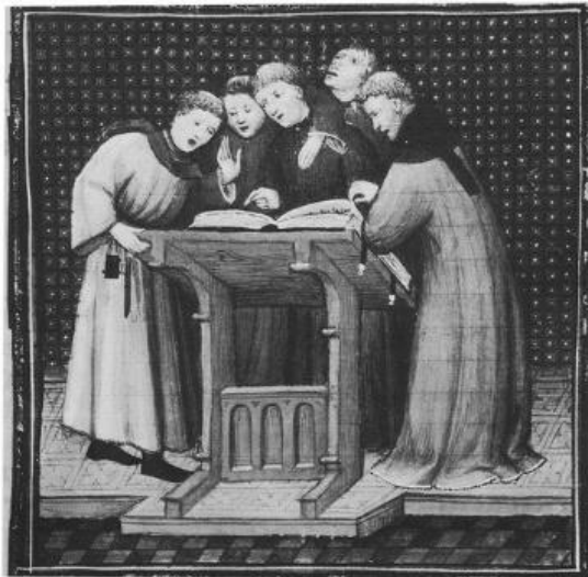
Slika 3. Schola Cantorum

Postojala je posebna pjevačka škola, Schola Cantorum koja je bila za učenje pjevanja crkvenih napjeva, psalama i himana koju je prvu osnovao papa Grgur I Veliki u Rimu, a potom se takve škole otvaraju i u drugim gradovima i državama. U ovom je razdoblju usavršeno notno pismo i vrlo je značajan period za razvoj glazbene umjetnosti, jer smo upravo iz ovog razdoblja naslijedili solmizaciju.