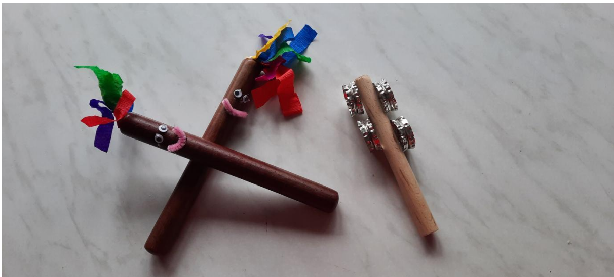
Slika 11. Primjer udaraljki i šuškalica

Brojalice su djeci iznimno zabavne jer se mogu izgovarati u različitoj dinamici, mogu biti izvođene glasno, tiše, od tišeg prema glasnijeg, ili u različitom tempu od sporijeg ka bržem ili obrnuto, npr. „Što hukće lokomotiva“. Mogu biti popratne pljeskanjem ili tapšanjem po koljenima ili odgojitelji mogu izraditi instrumente za svako dijete, a najčešće su to udaraljke.