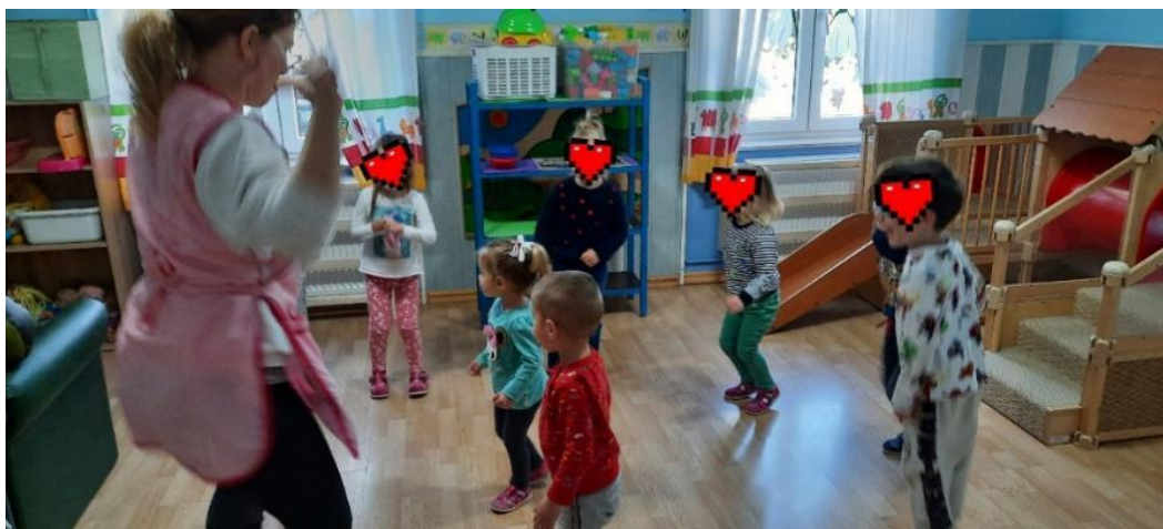
Slika 8. Izvođenje vlastitog talenta u praksi – djeca plešu