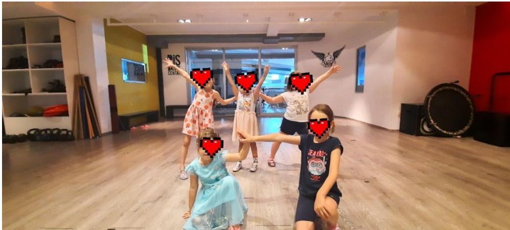
Slika 4. Plesna skupina RiS dance centar – RiSići (4-6. god)