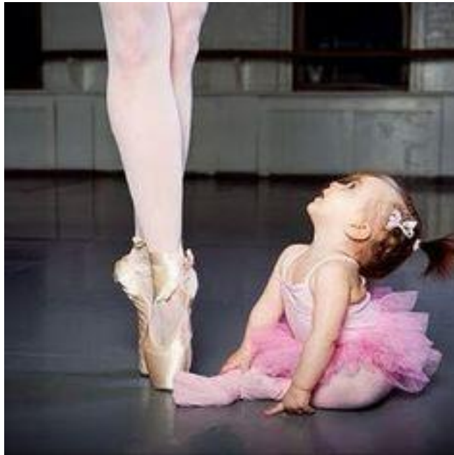
Slika 7. Put ka talentu