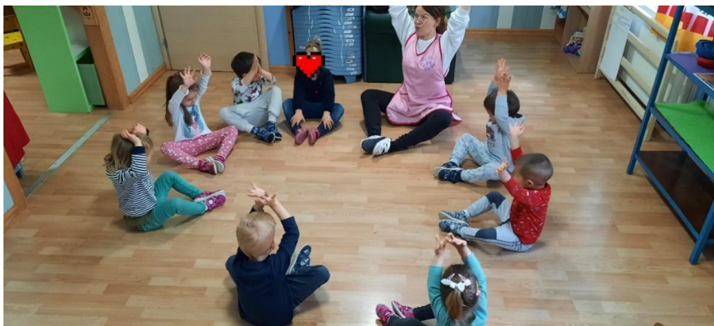
Slika 10. Provođenje plesne aktivnosti u vrtiću

Voditelj plesnog odgoja mora sam potaknuti djecu na pokret, zatim na ples koji odgovara njegovoj dobi, te stupnju složenosti pokreta. Jednostavni plesni elementi se uvode u rad s djecom predškolske dobi na njima pristupačan način, a može započeti od njihove treće godine života. Prilikom rada važno je poznavati psihofizičke osobine, njihove sklonosti i mogućnosti. (Virant, 2011),