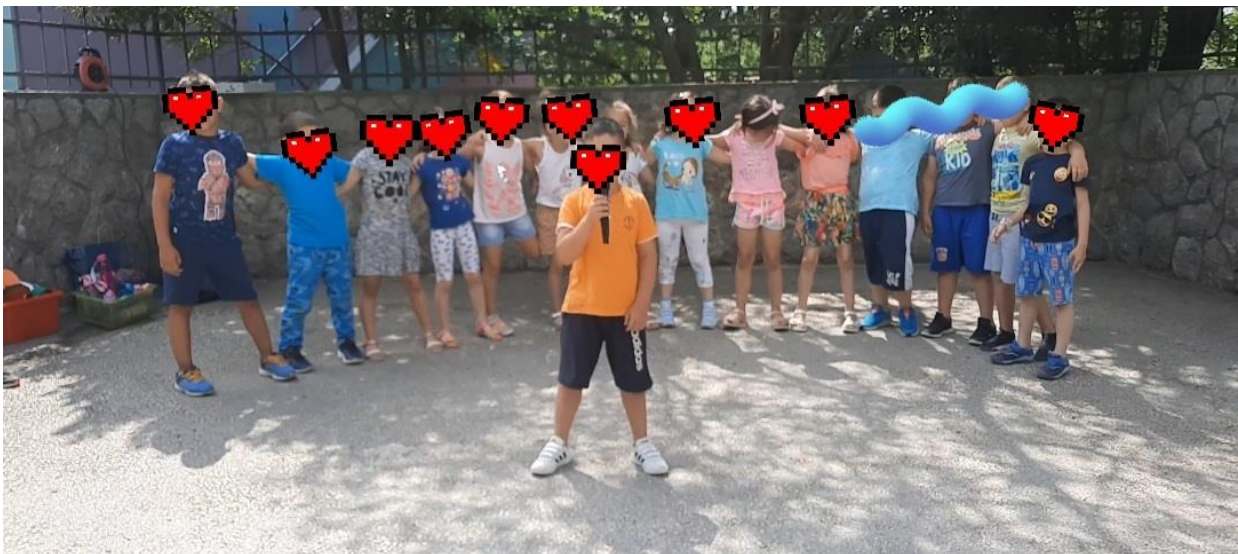
Slika 5. Proba za završnu priredbu odgojno obrazovne skupine „Dupini“, DV Loptica, Viškovo

Darovitost je sklop osobina koje omogućuju pojedincu da dosljedno postiže izrazito iznad prosječan uradak u jednoj ili više aktivnosti kojima se bavi. (Cvetković Lay, Sekulić Majurec, 2008). U svakoj skupini postoji određeni broj djece koja mogu sve izvesti prije, više, brže, uspješnije, bolje, drugačije od svojih vršnjaka. Kao primjer iz prakse izdvojila bi proteklu pedagošku godinu, gdje sam imala prilike raditi sa djecom predškolske dobi. Mogla sam ih međusobno usporediti i pratiti u ispunjavanju radnih listova, kreativnim idejama za igru, te za kraj pedagoške godine u završnoj priredbi. Jedan dječak se uvijek isticao u svemu tome, na njega si se mogao osloniti za bilo koju aktivnost. Uvijek bi sve prvi napravio i rijetko bi bilo išta za ispraviti. Vrlo brzo pamti pjesmice, pokrete i zadatke koje treba izvršiti. Iz toga je proizašla i njegova glavna uloga kao pjevača za koju se posebno više trudio i pripremao.