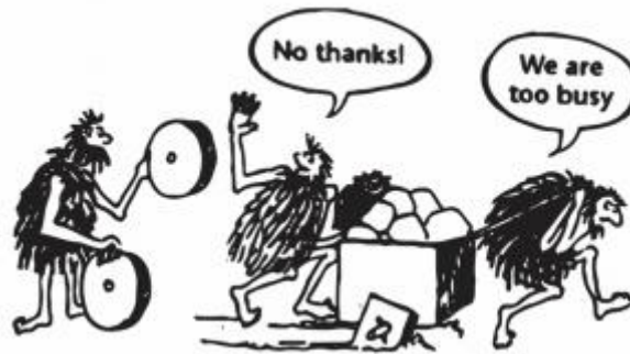
Slika 1. Kreativnost