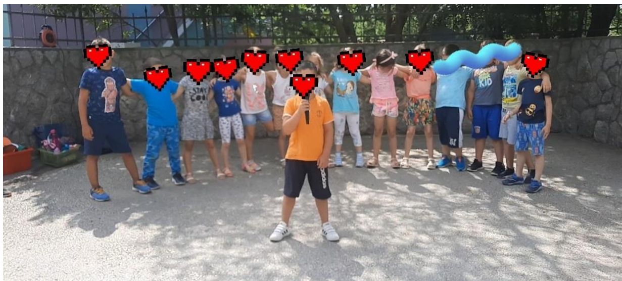
Slika 5. Proba za završnu priredbu odgojno obrazovne skupine „Dupini“, DV Loptica, Viškovo

Darovitost je sklop osobina koje omogućuju pojedincu da dosljedno postiže izrazito iznad prosječan uradak u jednoj ili više aktivnosti kojima se bavi. (Cvetković Lay, Sekulić Majurec, 2008). U svakoj skupini postoji određeni broj djece koja mogu sve izvesti prije, više, brže, uspješnije, bolje, drugačije od svojih vršnjaka. Kao primjer iz prakse izdvojila bi proteklu pedagošku godinu, gdje sam imala prilike raditi sa djecom predškolske dobi. Mogla sam ih međusobno usporediti i pratiti u ispunjavanju radnih listova, kreativnim idejama za igru, te za kraj pedagoške godine u završnoj priredbi. Jedan dječak se uvijek isticao u svemu tome, na njega si se mogao osloniti za bilo koju aktivnost. Uvijek bi sve prvi napravio i rijetko bi bilo išta za ispraviti. Vrlo brzo pamti pjesmice, pokrete i zadatke koje treba izvršiti. Iz toga je proizašla i njegova glavna uloga kao pjevača za koju se posebno više trudio i pripremao.