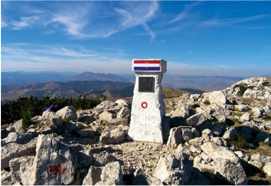
Slika 2. Planinarski žig na najvišem vrhu Dinare