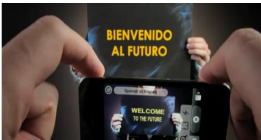
Slika 10. Aplikacija Word Lens