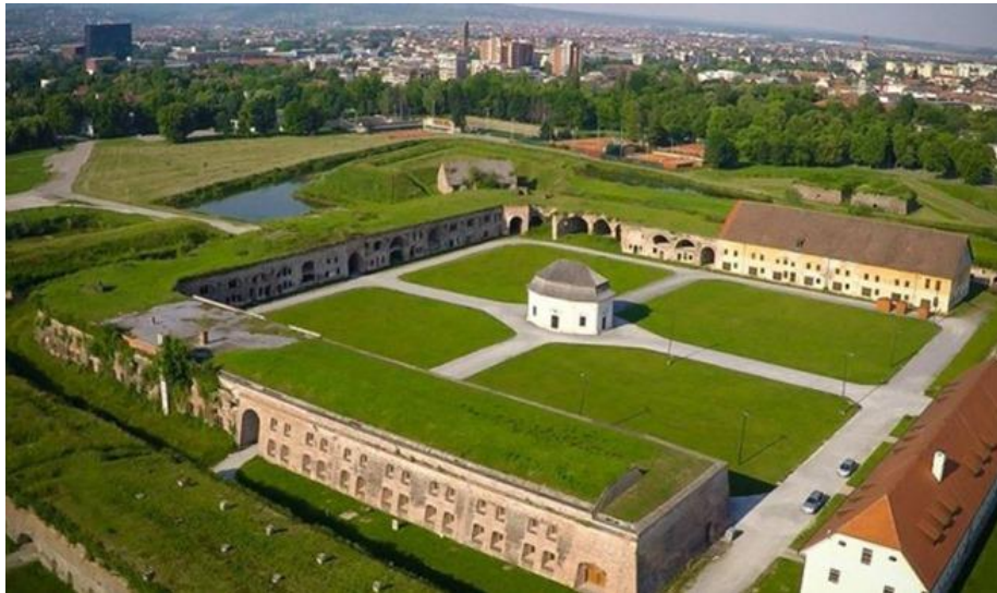
Slika 5. Tvrđava u Slavonskom Brodu