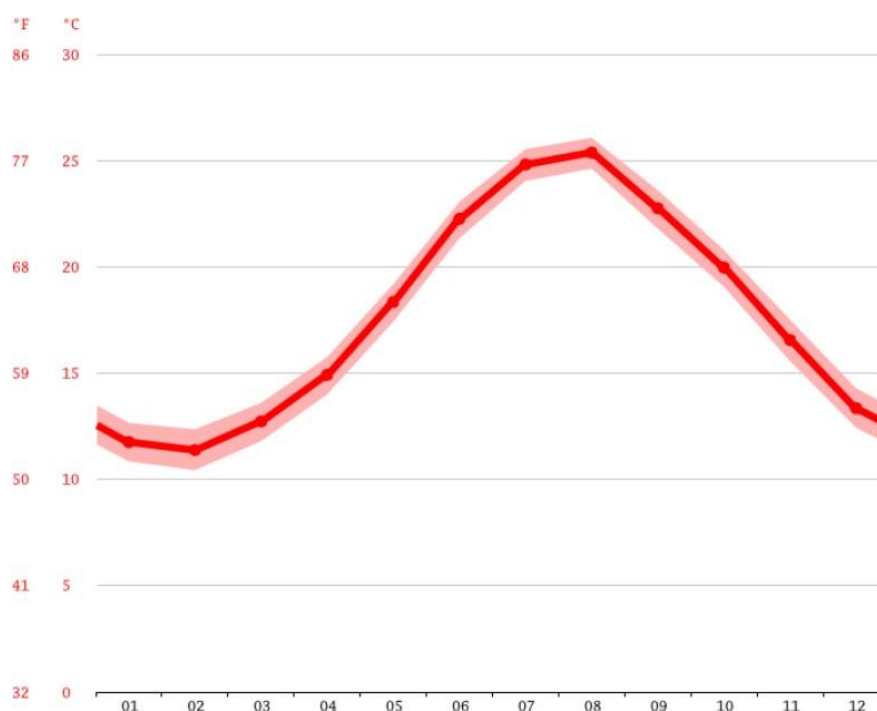
Slika 2. Prosječna temperatura na otoku Capri