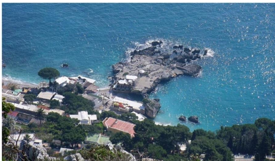
Slika 3. Scoglio delle Sirene u Marini Piccola