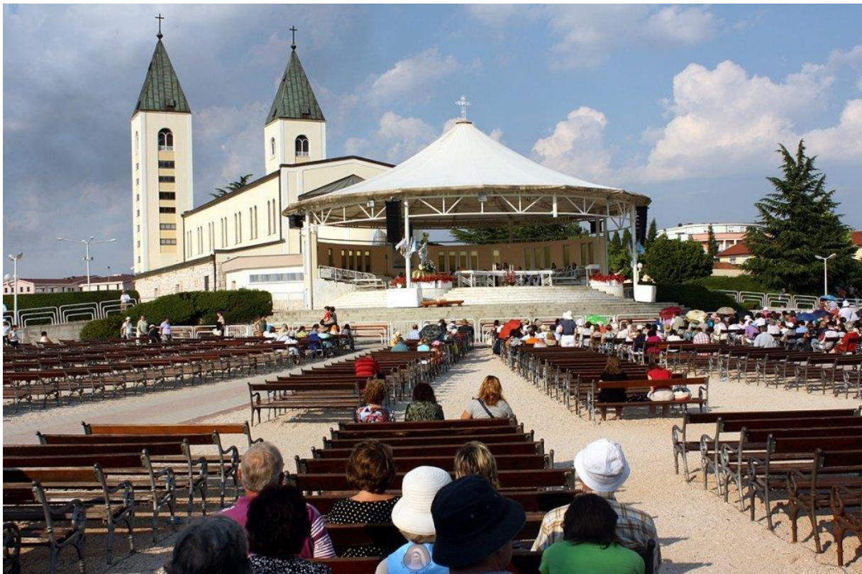
Slika 4. Hodočašće u Međugorje – najznačajnija vjerska destinacija istočne Europe

U religijskom turizmu važan je i dominantan religijski sadržaj putovanja, ali je također važna i prisutnost drugih turističkih sadržaja. Religijski turist svojim vjerskim stavom samo manifestira svoje osobno uvjerenje, a u turističko se kretanje takav turist ne uključuje potaknut religijskim motivima, već svoje vjerske potrebe koristi na način kako to radi u svom stalnom prebivalištu (Vukonić, 1990.). Takav turist uvjetuje određene religijske sadržaje u obvezni fond turističke ponude, ali ti sadržaji nisu presudni za njegov dolazak u određenu vjersku destinaciju. Vjerski se turisti izvan sfere religioznog ponašaju u skladu sa svojim uobičajenim ponašanjem one kategorije turističkog korisnika kojoj taj turist pripada po svojim drugim obilježjima. Vjerski turisti sami izabiru svoju destinaciju, a njihova se odluka temelji na vjerskim kriterijima. Radi se o turistima čiji izbor destinacije nije ograničen ni cijenom ni udaljenošću, već gotovo isključivo proizlazi iz snage privlačnosti takve destinacije (Vukonić, 1990.).