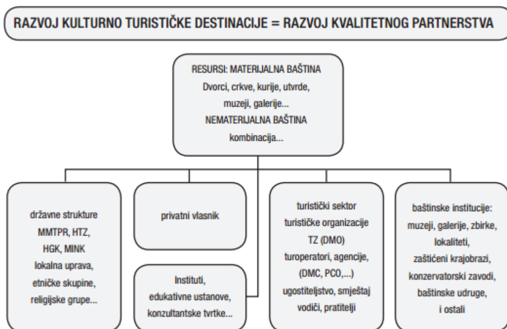
Slika 3. Razvoj kulturno – turističke destinacije