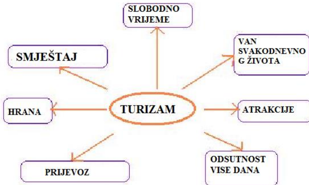
Slika 1. Odrednice turizma