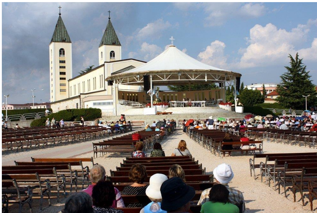
Slika 4. Hodočašće u Međugorje – najznačajnija vjerska destinacija istočne Europe

U religijskom turizmu važan je i dominantan religijski sadržaj putovanja, ali je također važna i prisutnost drugih turističkih sadržaja. Religijski turist svojim vjerskim stavom samo manifestira svoje osobno uvjerenje, a u turističko se kretanje takav turist ne uključuje potaknut religijskim motivima, već svoje vjerske potrebe koristi na način kako to radi u svom stalnom prebivalištu (Vukonić, 1990.). Takav turist uvjetuje određene religijske sadržaje u obvezni fond turističke ponude, ali ti sadržaji nisu presudni za njegov dolazak u određenu vjersku destinaciju. Vjerski se turisti izvan sfere religioznog ponašaju u skladu sa svojim uobičajenim ponašanjem one kategorije turističkog korisnika kojoj taj turist pripada po svojim drugim obilježjima. Vjerski turisti sami izabiru svoju destinaciju, a njihova se odluka temelji na vjerskim kriterijima. Radi se o turistima čiji izbor destinacije nije ograničen ni cijenom ni udaljenošću, već gotovo isključivo proizlazi iz snage privlačnosti takve destinacije (Vukonić, 1990.).