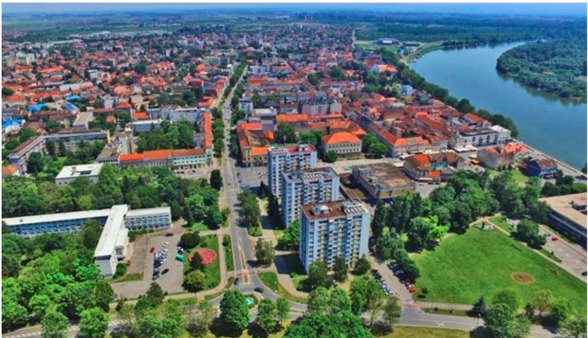
Slika 5. Grad Slavonski Brod