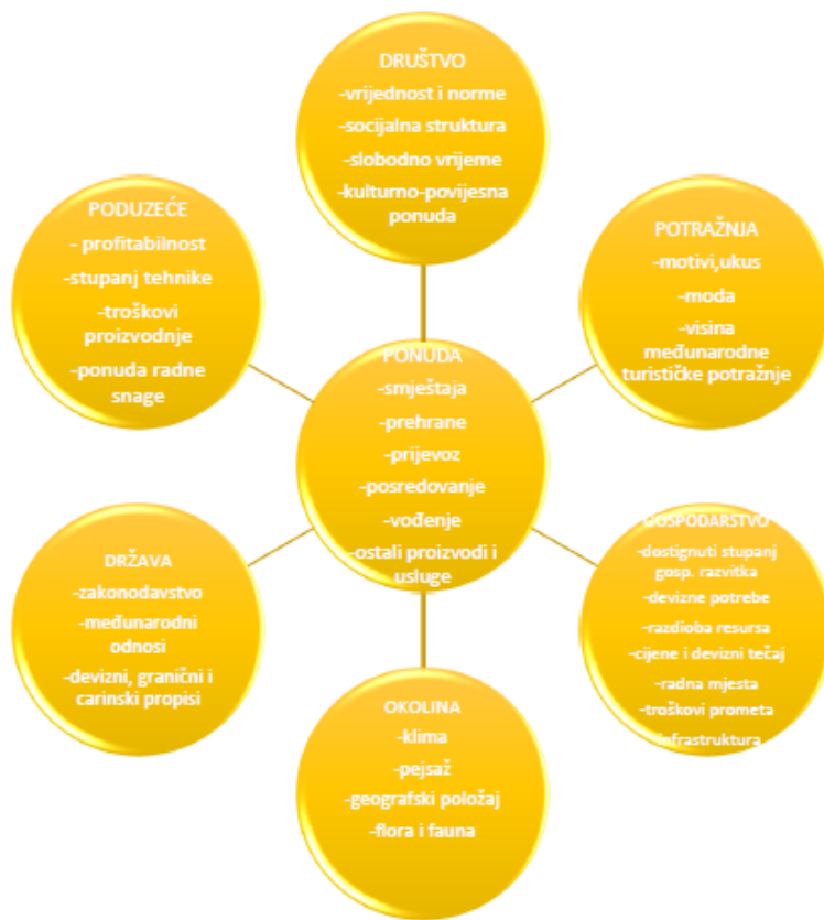
Slika 1. Čimbenici koji utječu na turističku ponudu