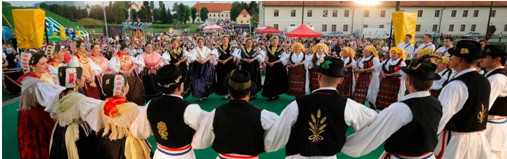
Slika 9. Manifestacija Brodsko kolo