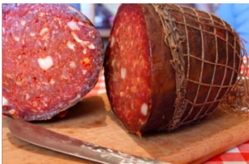
Slika 10. Slavonski kulen