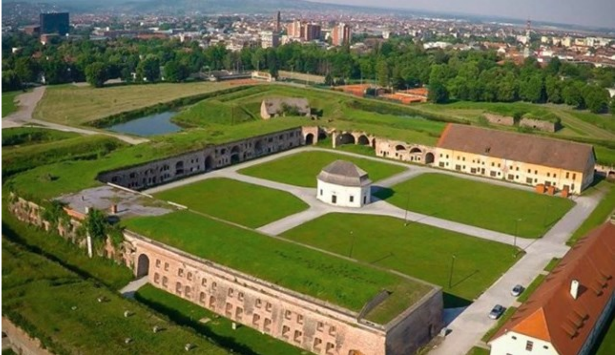
Slika 7. Tvrđava Brod