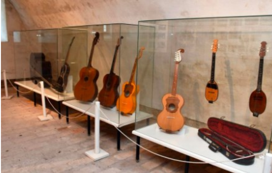
Slika 8. Kuća tambure, Slavonski Brod

baroknih građevina. Interesantna mjesta koja turisti također posjećuju je kuća jedne od najvećih spisateljica u hrvatskoj povijesti, Ivana Brlić Mažuranić te ljetnikovac Brličevac.