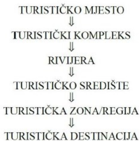
Slika 3. Razvoj turističke destinacije