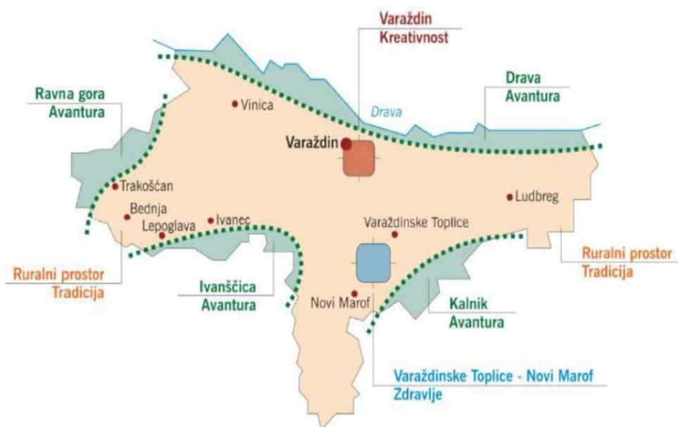
Slika 2. Shematski prikaz prostorne koncepcije razvoja turističke aktivnosti u Varaždinskoj županiji – zone/klasteri turističke aktivnosti