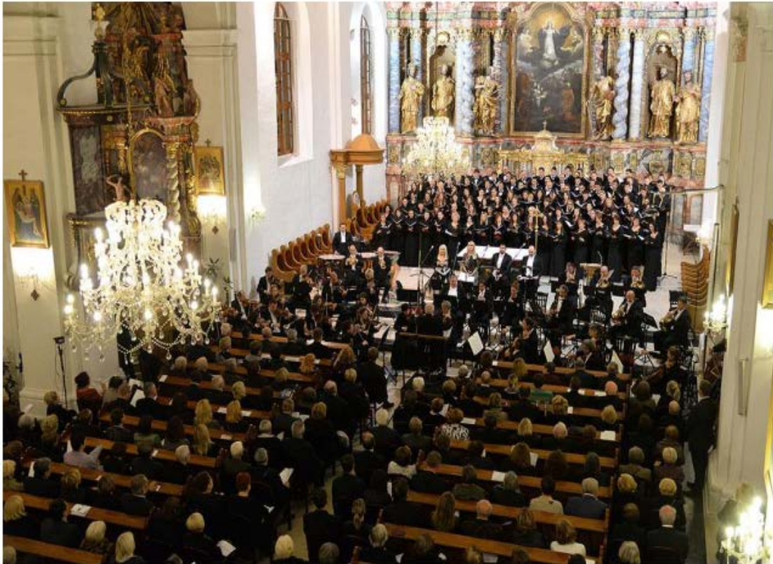
Slika 4.: Varaždinske barokne večeri