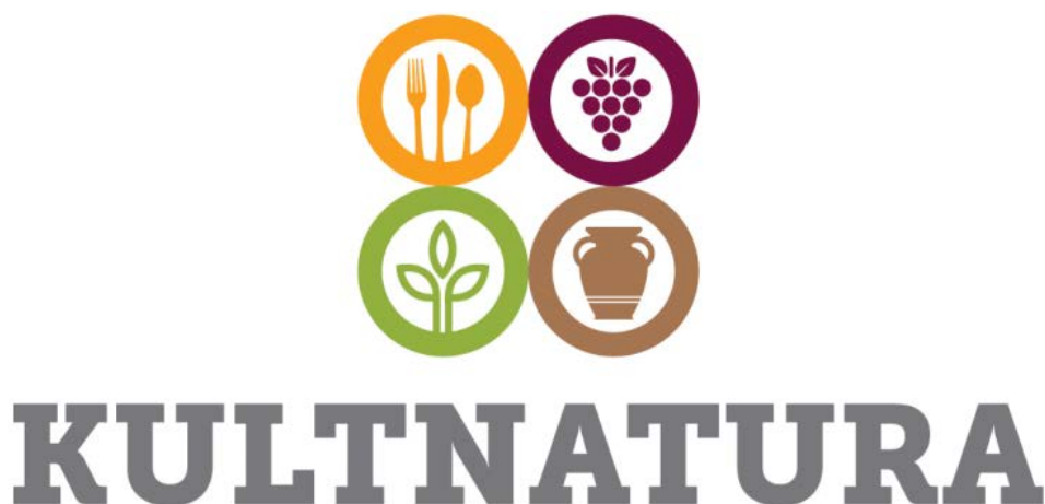
Slika 5. : KULTNATURA