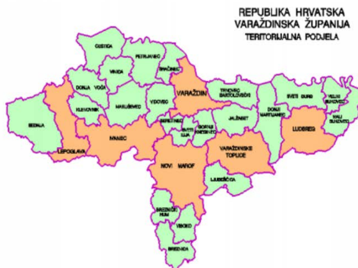
Slika 2. Teritorijalna podjela Varaždinske županije