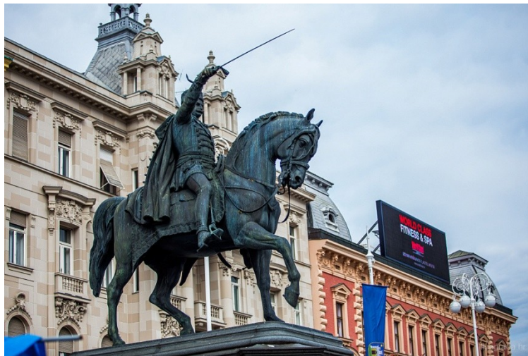
Slika 7. Spomenik Bana Josipa Jelačića

u dijelovima preuzeta od strane Gliptoteke. Na trg je svečano vraćena 1990. kada je i okrenuta prema jugu. 62