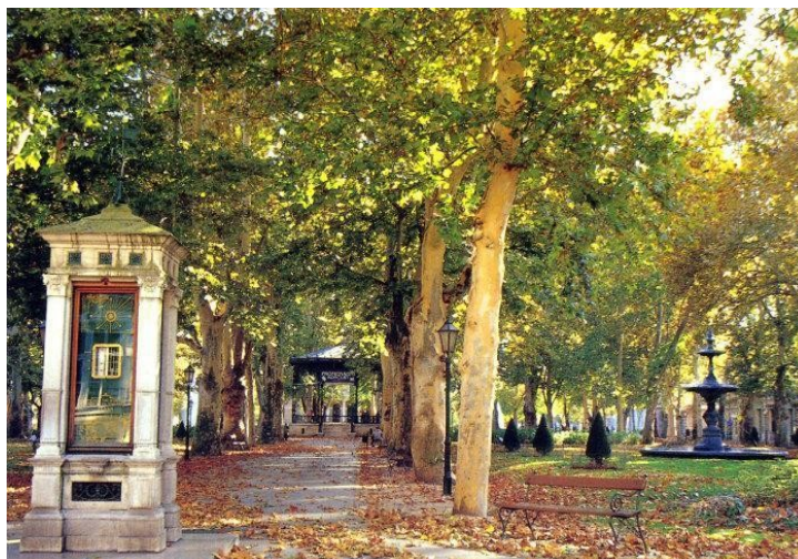
Slika 11. Trg Nikole Šubića Zrinskog