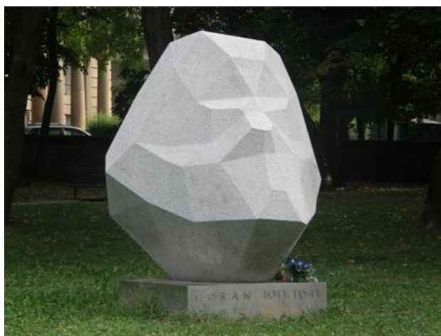
Slika 4. Spomenik Ivanu Goranu Kovačiću