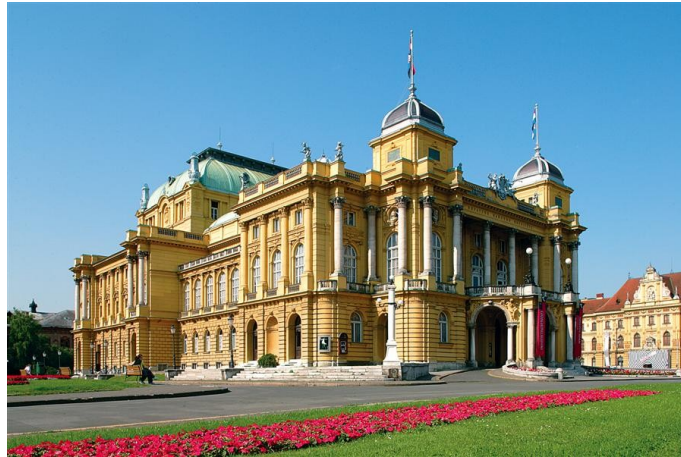
Slika 5. Hrvatsko narodno kazalište u Zagrebu