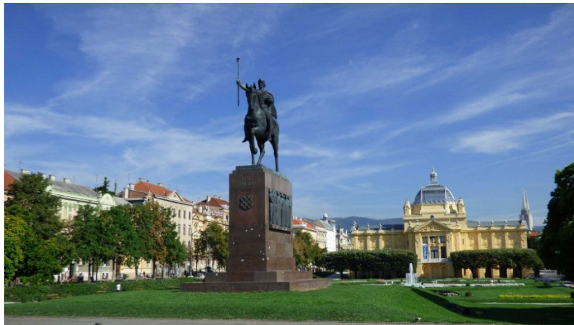
Slika 14. Park Tomislavac

Kao spomenik parkovne arhitekture zaštićen je 1970. 125