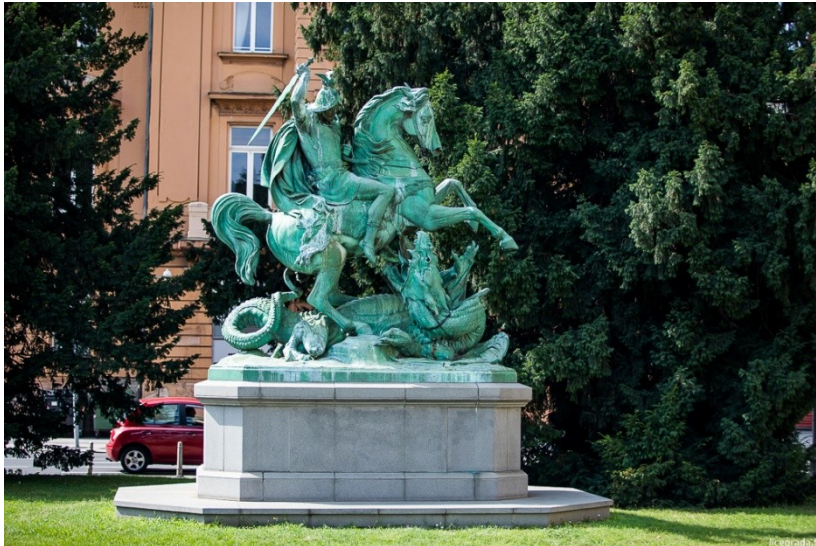
Slika 8. Skulptura Sveti Juraj ubija zmaja