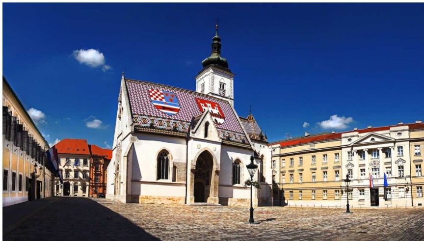
Slika 2. Crkva svetog Marka u Zagrebu

Ona nije crkva koja ima posebnu vrijednost u europskim relacijama, ni među ostvarenjima gotičkoga stila. „Međutim, s obzirom na svoje mjesto, na slojevitost životne i oblikovne povijesti, na naglasak koji nosi u slici Gradeca i na svoje mjesto u svijesti naroda, s krovštem na kojem su u prostoru vizualizirani povijesni grbovi, ona je nezamjenjiv spomenik zagrebačke arhitekture i povijesti.“ 14