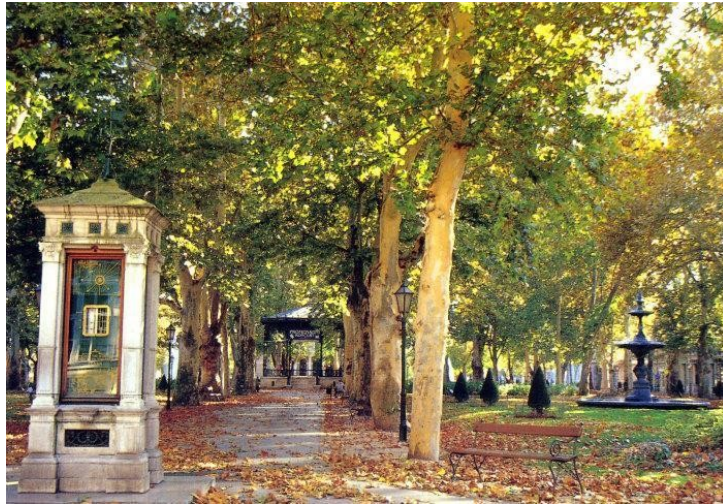
Slika 11. Trg Nikole Šubića Zrinskog