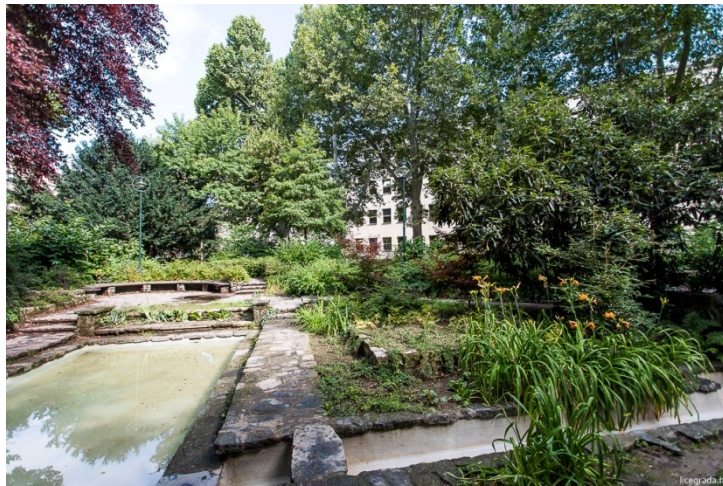
Slika 15. Park Kralja Petra Krešimira IV.

Kompozicijski, park se sastoji od elemenata: južni dio oblikovan u slobodnom engleskom krajobraznom stilu, sjeverni dio koji je riješen na geometrijski način te središnji dio u kojem se nalaze aleje drvoreda platana. Spomenikom parkovne arhitekture proglašen je 2001. 132