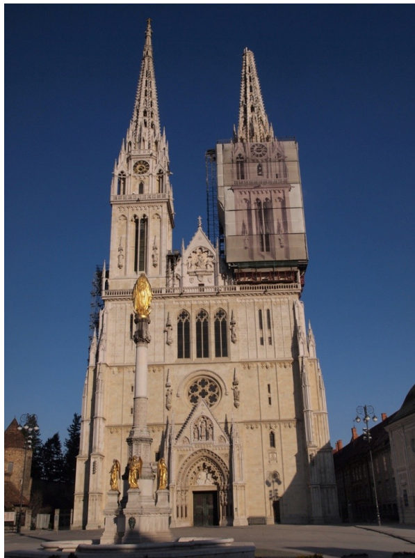
Slika 1. Zagrebačka katedrala

Umjesto starih grobnica velikaša i biskupa izgrađena je nova za zagrebačke nadpastire iza glavnog oltara. Uz ostale velikane, tu je mjesto počivanja hrvatskih mučenika Petra Zrinskog i Frana Krste Frankopana, čije su kosti tu premještene 1919. iz Bečkog Novog Mjesta. U novoj grobnici pokopana su i tri posljednja zagrebačka nadbiskupa: stožernici Franjo Kuharić, bl. Alojzije Stepinac i Franjo Šeper. Njezino puno ime je Katedrala Uznesenja Blažene Djevice Marije i svetih Stjepana i Ladislava (sl. 1). 10