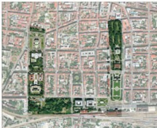
Slika 10. Prikaz Zelene potkove na karti

„Cjeloviti potez trgova temelji se na klasičnoj simetričnoj kompoziciji i u zajednici sa svojim sadržajima djelo je tzv. "utemeljiteljskog razdoblja" druge polovice i kraja 19. stoljeća.“ 79