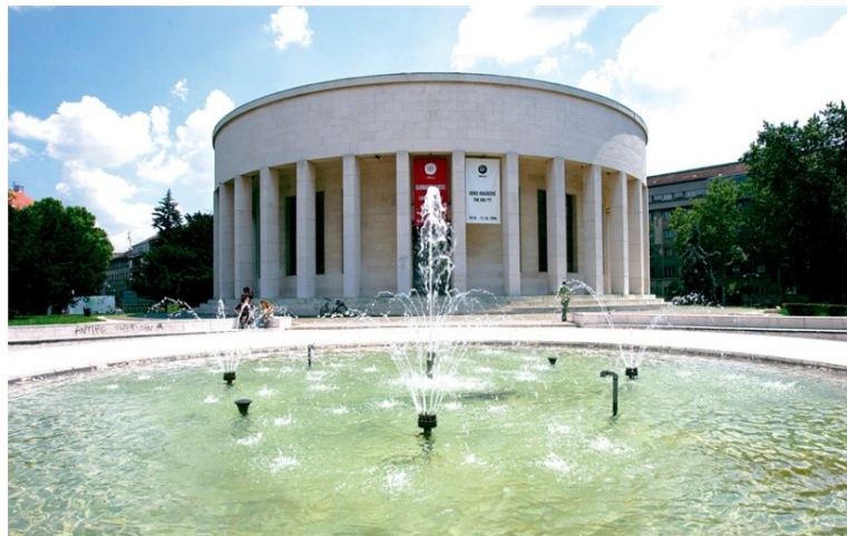
Slika 6. Dom hrvatskih likovnih umjetnika

svjetskog rata je oduzeta društvu i prenamijenjena u džamiju. Tada je napravljena fontana po projektu arhitekta Stjepana Planića i podignuta su tri minareta koji su porušeni 1948., kada se i dom ponovno počeo koristiti u svrhe izlaganja. U Muzej narodnog oslobođenja prenamijenjen je 1949. po projektu Vjenceslava Richtera. Zatim je, na početku 1990-ih, zgradi vraćena prvobitna namjena na zamolbu Hrvatskog društva likovnih umjetnika te je u izvorno stanje djelomice rekonstruirana 2003. Danas se u njoj održavaju retrospektivne, monografske i skupne izložbe od stranih i domaćih autora, a centralni dio kata je izložbeni prostor Galerije proširenih medija. U jednom manjem dijelu zgrade su depoi i njime se služi Hrvatski povijesni muzej. 51