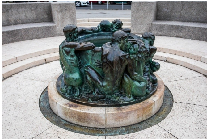
Slika 9. Zdenac života

Restauriran je 2001. u ljevaonici umjetnina Akademije likovnih umjetnosti. 71