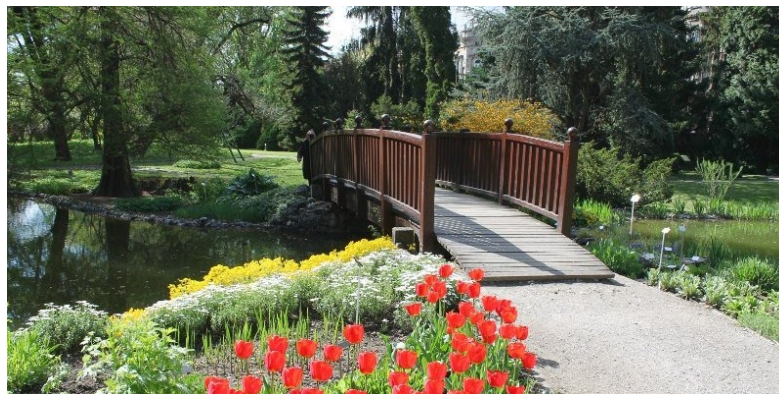
Slika 12. Botanički vrt

Botaničkom vrtu održana je složena funkcija, no ne i prostorni i estetski integritet. Narušilo ga je loše održavanje reprezentativnoga, ornamentalnog partera i nepromišljene interpolacije različitih zgrada. „Pod pretpostavkom izmještanja sveučilišnog botaničkog vrta, on bi se mogao prezentirati kao povijesni botanički vrt u funkciji isključivo javnoga gradskoga parka.“ 104