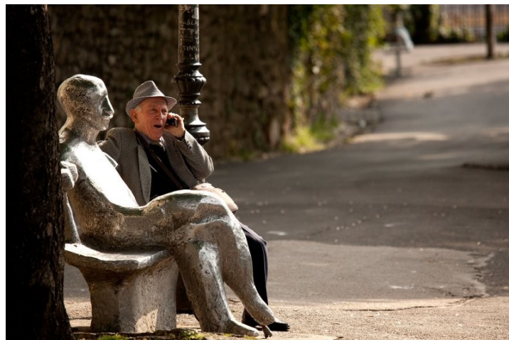
Slika 3. Spomenik Antuna Gustava Matoša

Matoš nije živio u Zagrebu, no izrazito ga je volio pa je zato smješten na mjesto s kojeg se može vidjeti cijeli grad. 32