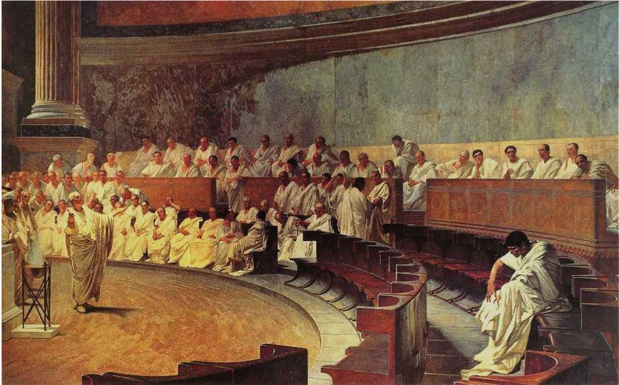
Prilog 3. C. Maccari: Ciceron optužuje Katilinu, 1888.