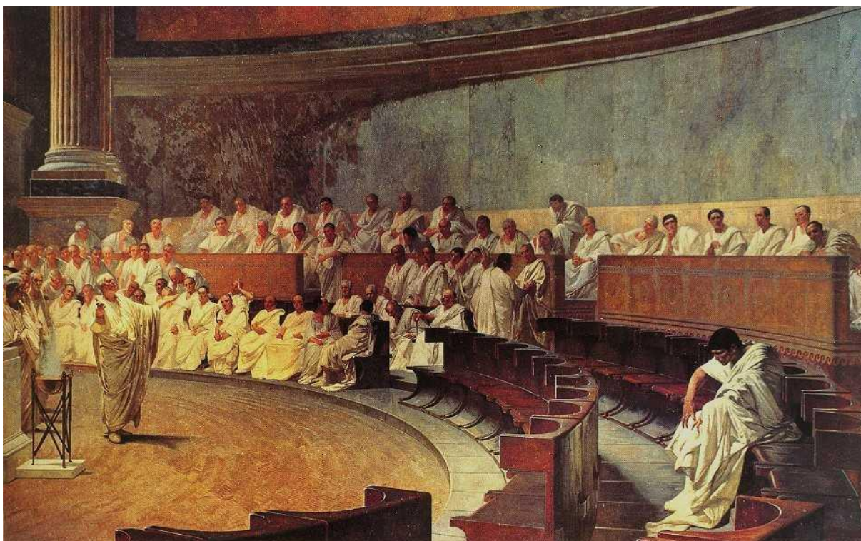
Prilog 3. C. Maccari: Ciceron optužuje Katilinu, 1888.