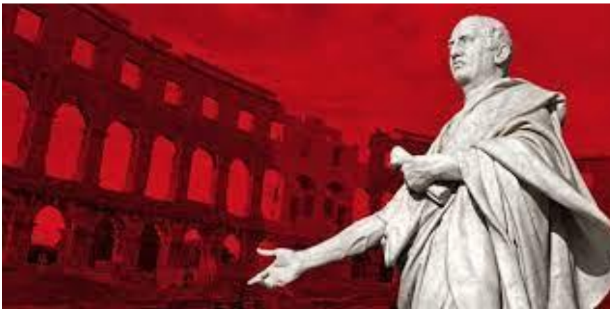
Prilog 4. M. T. Ciceron

Čak je i danas vidljiv Ciceronov utjecaj u političkoj retorici; čest je slučaj citiranja njegove rečenice „Dokad ćeš još, Katilino, zloupotrebljavati našu strpljivost?“ iz Prvog govora protiv Katiline samo se umjesto Katiline ubacuju imena državnih predsjednika, gradonačelnika i slično. Na taj način sukob između Cicerona i katiline postaje shema suvremenih i svezremenih političkih okršaja i prepirki. 61