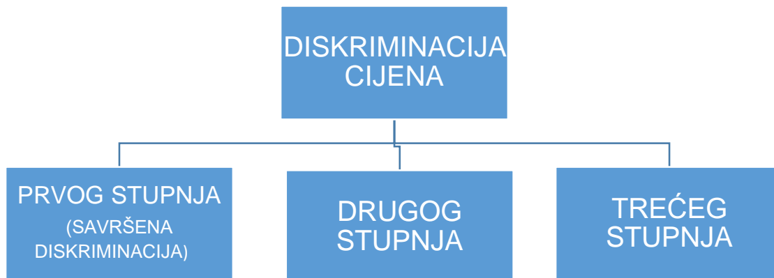
SLIKA 2. OSNOVNI OBLICI DISKRIMINACIJE CIJENA

Monopolska diskriminacija cijena se dijeli na tri osnovna oblika koja se još nazivaju diskriminacijom prvog, drugog i trećeg stupnja, kao što je prikazano na sljedećem grafikonu.