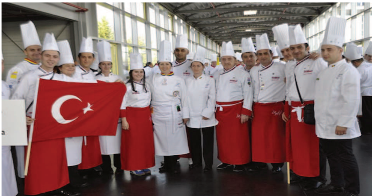
Slika 14. ISTANBUL GASTRONOMY FESTIVAL