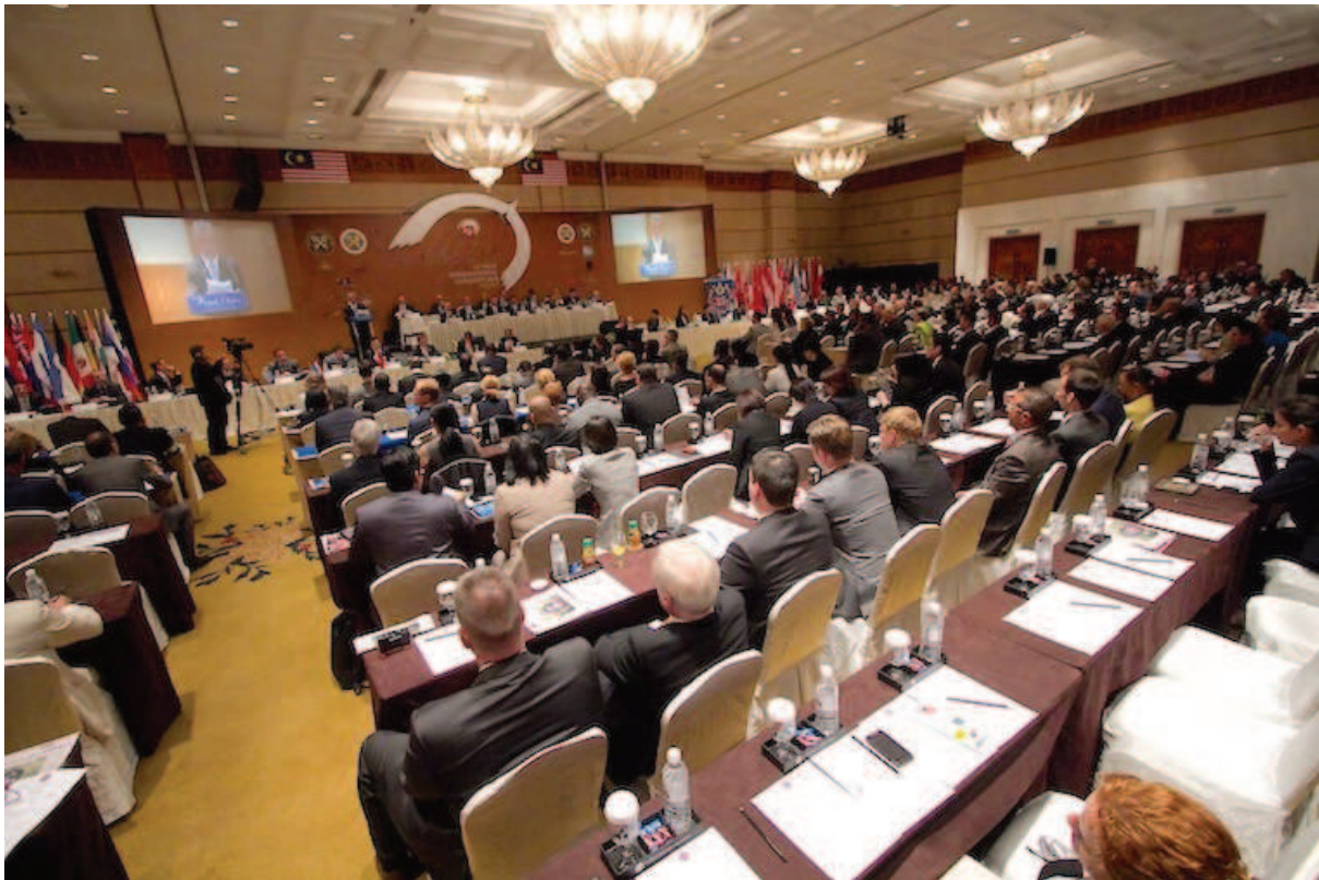
Slika 7. Poslovni turizam – Kongresna dvorana