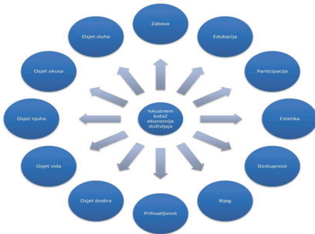
Slika 2. The experience wheel model