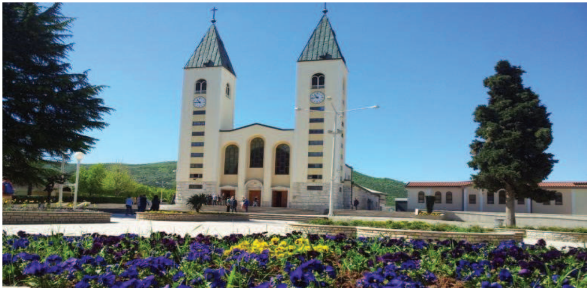
Slika 9. Vjerski turizam – Međugorje