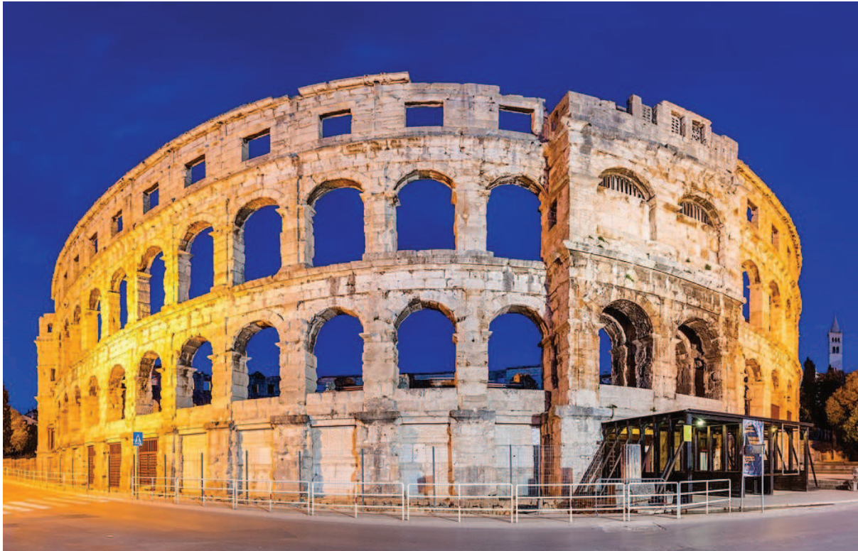
Slika 6. Kulturni turizam – Pulska Arena