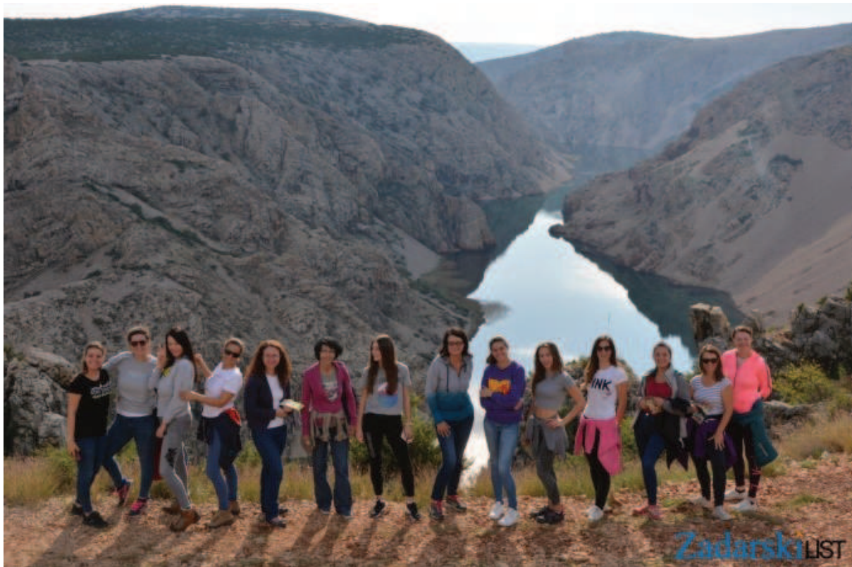
Slika 11. ADRION 5 SENSES - Velebit