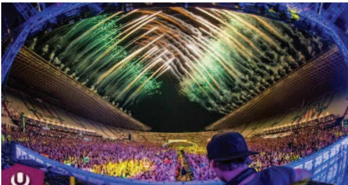
Slika 8. Glazbeni turizam – Festival “Ultra”