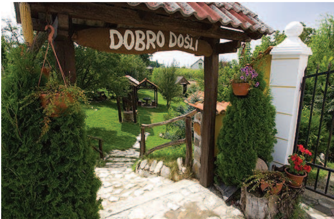
Slika 5. Ruralni turizam – Obiteljsko seosko gospodarstvo