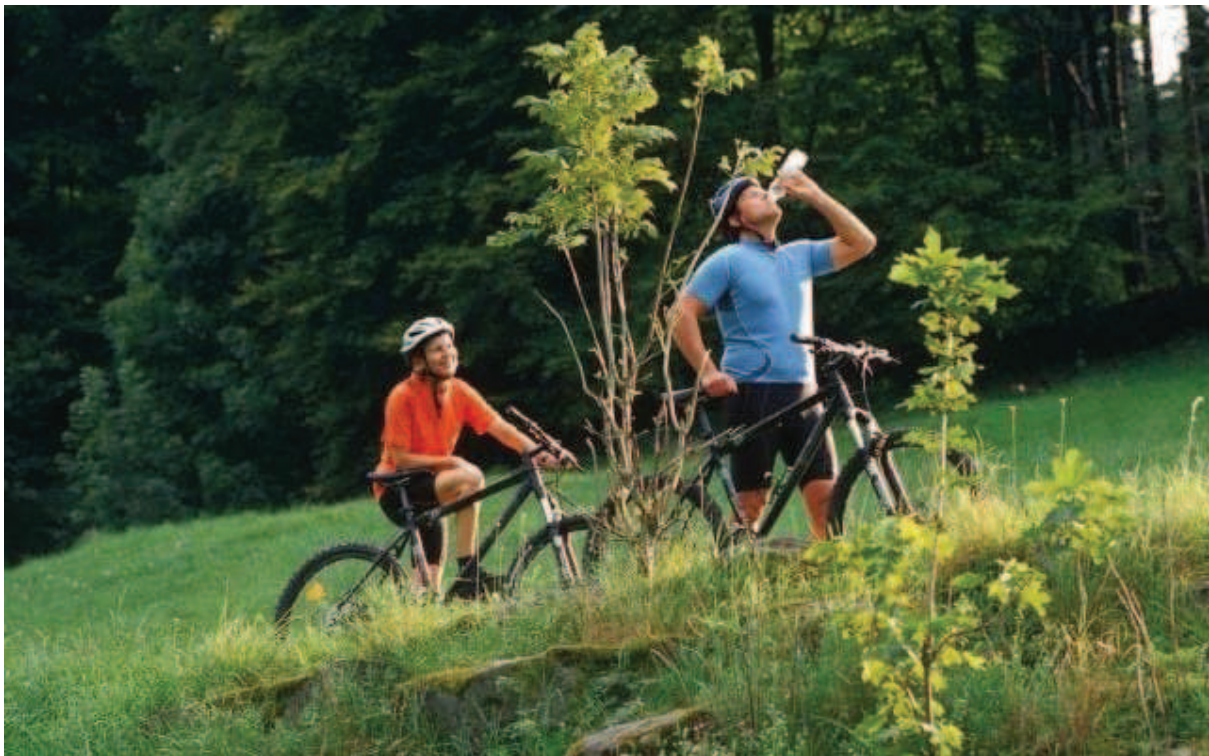
Slika 3. Sportsko – rekreacijski turizam - Biciklizam