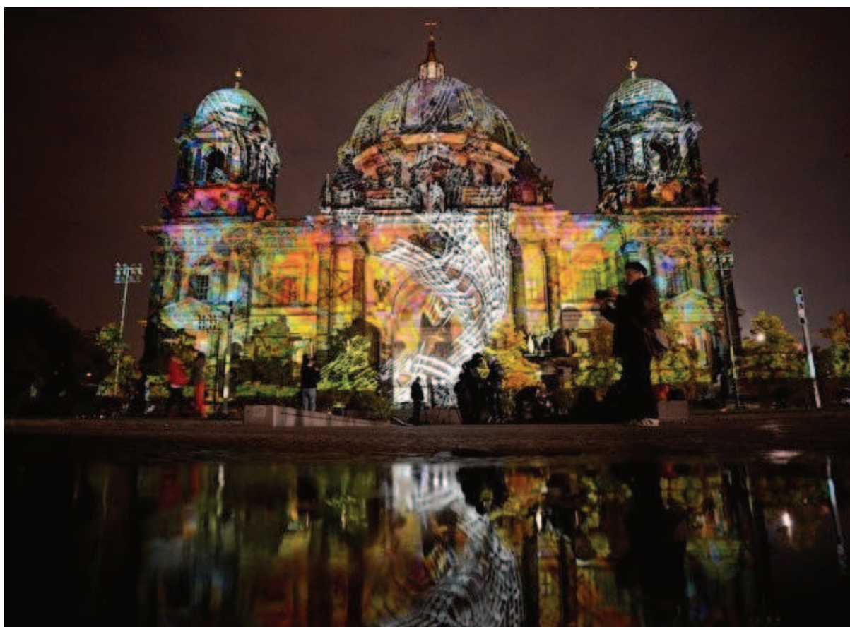
Slika 13. Festival of lights - Berlin