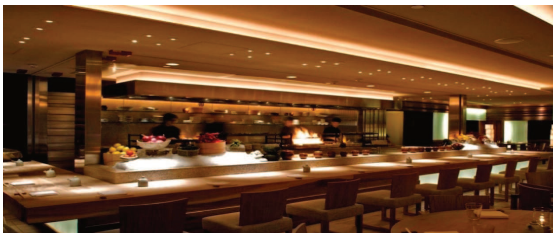
Slika 10. Gastronomski turizam – restoran