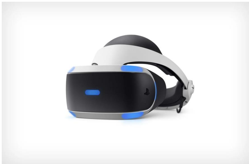
Slika 3. PlayStation VR headset - sustav virtualne stvarnosti za PlayStation

VR ili Virtual Reality može se definirati kao računalno iskustvo koje se odlikuje interakcijom u simuliranom okruženju kojega korisnik u potpunosti nastanjuje, ali ne dolazi do međudjelovanja između simuliranog i stvarnog svijeta niti korisnik ima mogućnost istovremeno komunicirati i sa stvarnim i sa virtualnim svijetom (BLOG, 2018). Upravo je to glavna karakteristika VR-a. Korisnik takve tehnologije u potpunosti se odvaja od stvarnog svijeta koji se uvelike razlikuje od virtualnog u kojeg ima priliku zaploviti. Virtualan svijet se putem tehnologije čini toliko stvarnim da korisnik gubi pojam o okolini u kojoj se zaista nalazi.