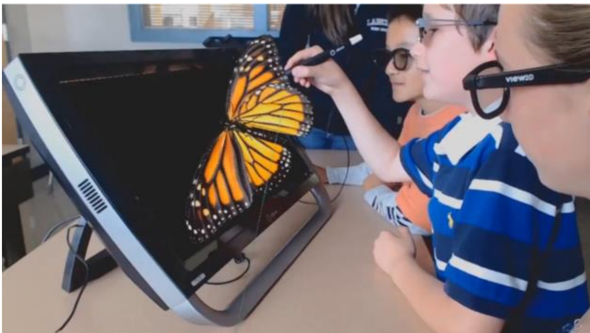
Slika 8. Primjer primjene produljene stvarnosti u obrazovanju