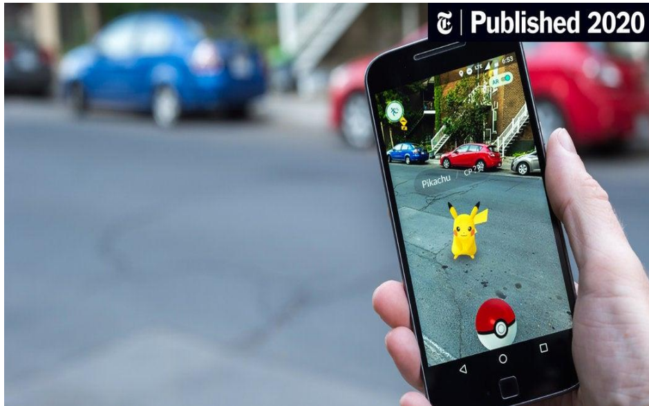
Slika 6. Igrica Pokemon Go - primjer primjene produljene stvarnosti, izvor:

https://www.nytimes.com/2020/01/01/world/canada/pokemon-go-canada-military.html