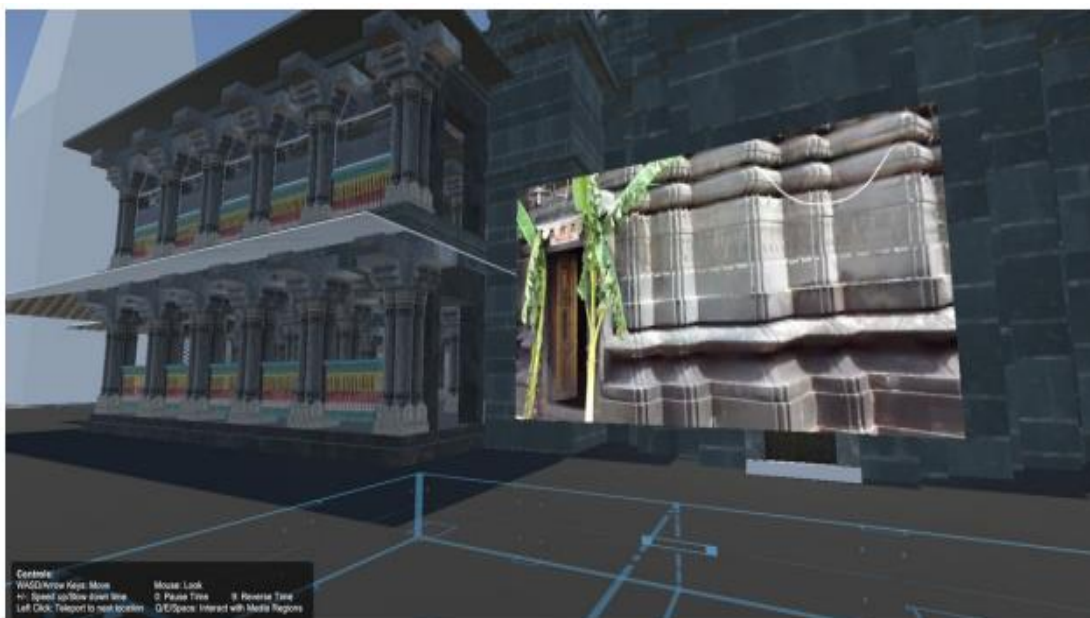
Slika 10. Primjer virtualne rekonstrukcije starog hrama