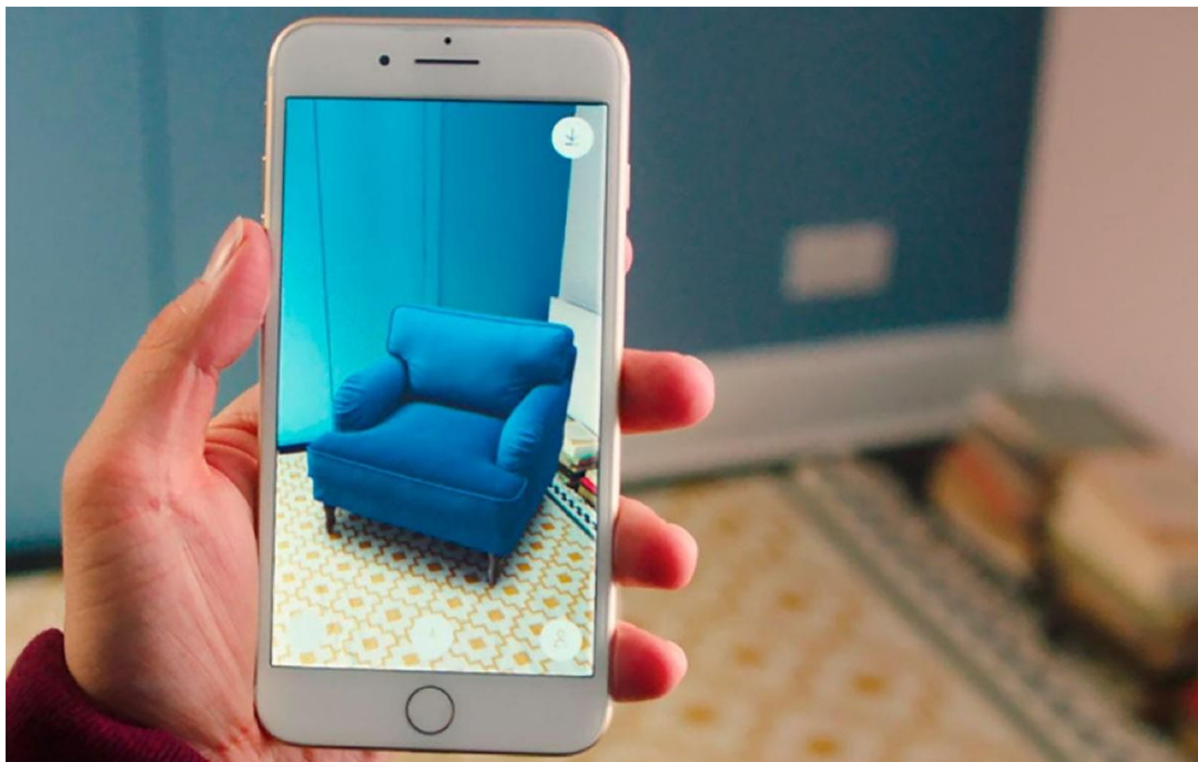
Slika 7. Produljena stvarnost u ulozi uređivanja interijera

Već je ranije spomenuto kako ne čudi primjena XR tehnologije u marketinške svrhe. Cilj marketinga oduvijek je bio upoznati potencijalne kupce i korisnike usluga s onim što se na tržištu nudi. Danas je gotovo nemoguće posjetiti neku od društvenih mreža, a da se pritom ne naiđe na reklamu. Primjena tehnologije u marketinške svrhe omogućuje trgovcima i poduzećima da brže prodaju svoje proizvode i usluge. “Ikea i Amazon su dvije značajne tvrtke koje koriste ovu tehnologiju” (Rukavina, 2020). Ove dvije tvrtke samo su jedne od mnogobrojnih koje primjenjuju produljenu stvarnost u kreiranju svojeg sadržaja kojim se nastoje približiti što većem broju ljudi koji su korisnici danas popularnih društvenih mreža ili pak osmišljenih aplikacija upravo za spomenute, ali i druge tvrtke.