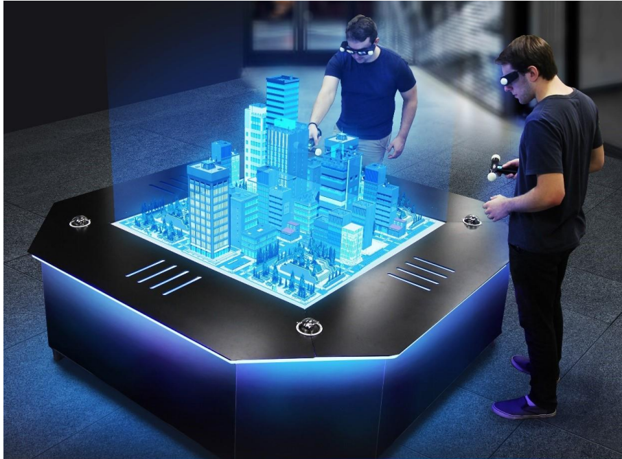
Slika 4. Primjena MR-a u arhitekturi , izvor: https://euclideanholographics.com/ (18. Lipnja 2021.)

“U mješovitoj stvarnosti, korisnik može komunicirati s fizičkim i virtualnim predmetima i okruženjima, koristeći sljedeću generaciju senzorskih i slikovnih tehnologija” (MDPI, 2020). Pomoću MR tehnologije moguće je istovremeno biti u stvarnosti i u virtualnom svijetu jer ova tehnologija predstavlja spoj najboljeg od VR i AR tehnologije. Moguće je mijenjati i iznova graditi elemente koji su dio virtualnog prikaza, a sve to u stvarnom okruženju i vremenu (EUROPA.EU).