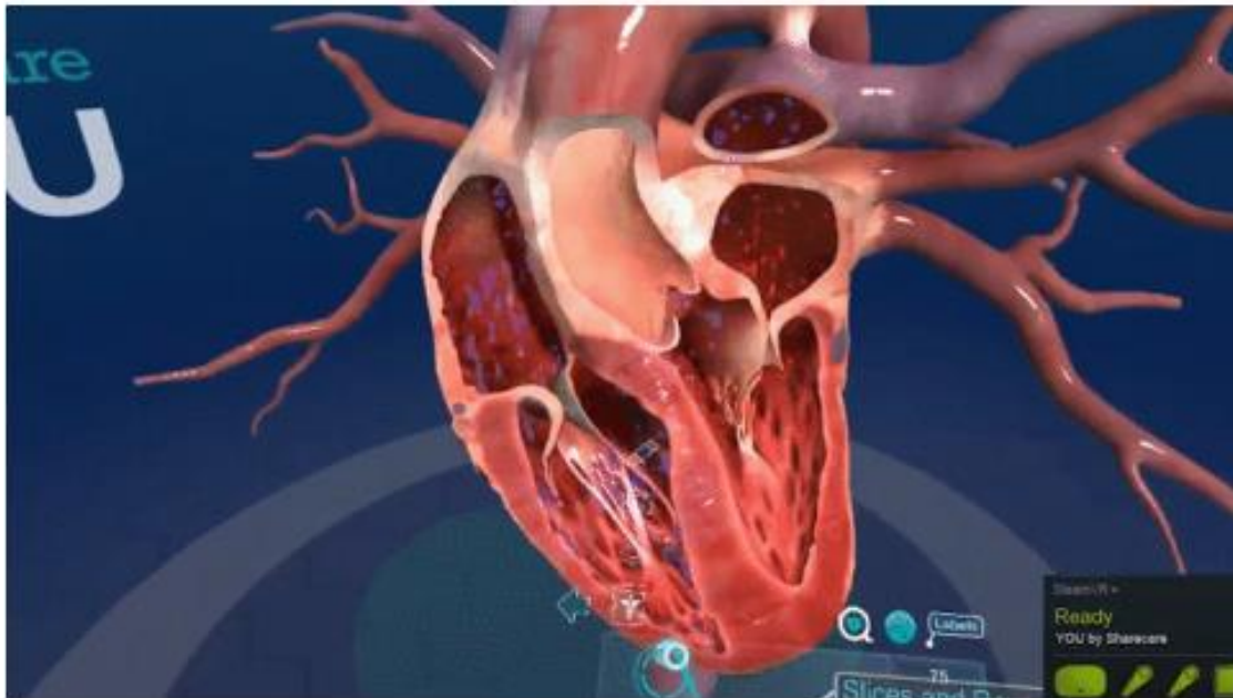
Slika 10. Simulacija proticanja krvi kroz krvožilni sustav do srca, izvor:

https://library.educause.edu/-/media/files/library/2018/8/ers1805.pdf?la=en&hash=6D6BE338BD6894807A5236B0913A35165574E111 (10. rujna 2021)