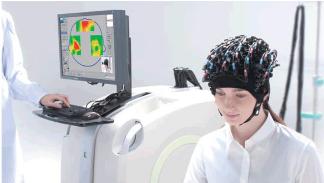
Slika 6: fNIRS uređaj

fMRI, ovaj uređaj omogućuje slabiju prostornu rezoluciju od te metode, no nudi malo bržu vremensku razlučivost. Usto, infracrvena svjetlost pri očitavanju prodire samo do moždanog korteksa, ne i dublje u mozak pri očitavanju moždane aktivnosti.