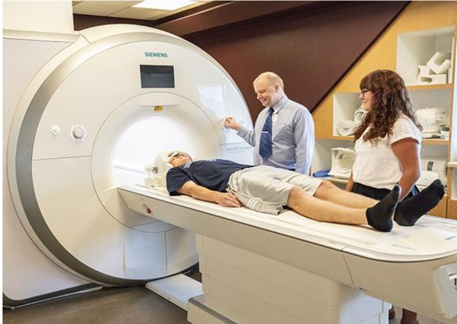
Slika 5: fMRI uređaj