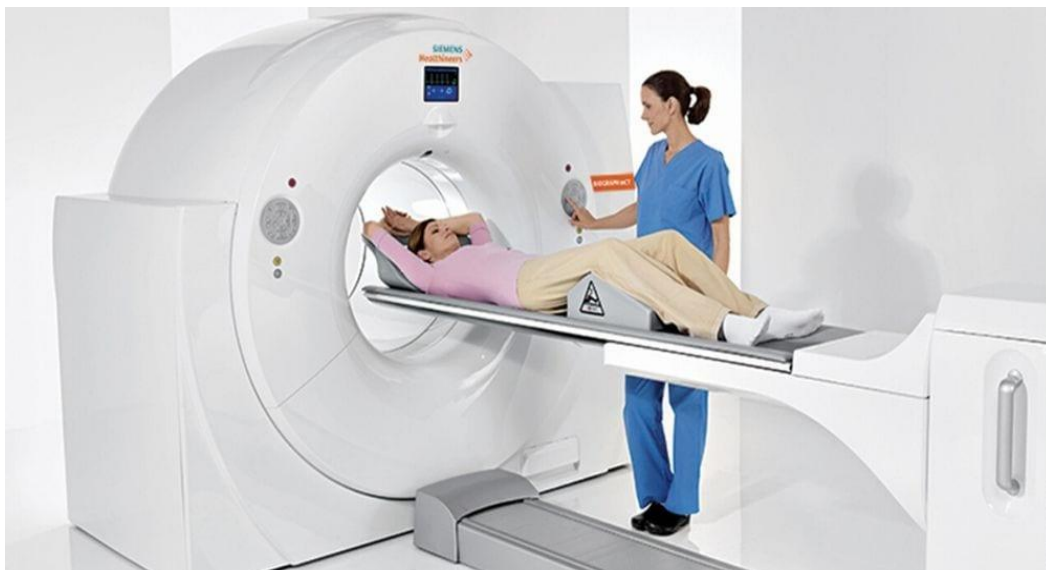
Slika 4: PET uređaj

Za razliku od fMRI metode koja prateći BOLD signal nudi relativnu mjeru, pozitronska emisijska topografija mjeri apsolutni protok krvi. Zbog toga ova metoda omogućuje usporedbe između provedenih istraživanja, ispitanika i moždanih regija. Prednost ove metode je svakako bolja prostorna rezolucija moždane aktivnosti u odnosu na ranije spomenuti EEG, dok joj je nedostatak brzina mjerenja moždane aktivnosti u odnosu na EEG (koji mjeri unutar sekunde) budući da PET metoda mjeri unutar minute. Ubrizgavanje radioaktivne tekućine u krvotok ispitanika razlog je zašto se ova metoda smije izvesti ograničeni broj puta kako bi se dobila bolja slika, dok fMRI nije ograničen tim faktorom. Usto, činjenica da se u krvotok ubrizgava 2-deoksiglukoza, iako u malim količinama, svakako je jedan od faktora zašto se ova metoda danas manje koristi.