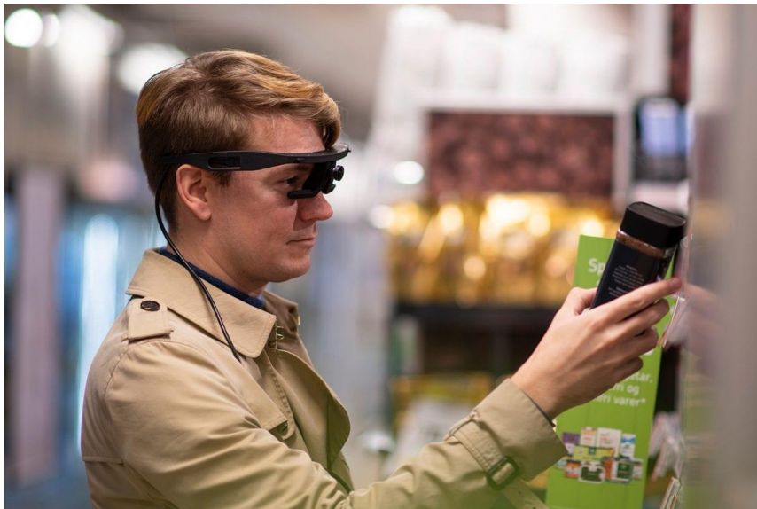
Slika 7: Naočale za praćenje pokreta očiju

naočalama prolaze trgovinom kupujući proizvode, pri čemu istraživači imaju uvid u kupovne obrasce ispitanika, te mogu vidjeti gdje na policama traže proizvode, na kojem dijelu polica najviše zadržavaju pogled, u kojim dijelovima trgovina najviše traže proizvod, u kojem vremenu donose odluke o kupovini proizvoda i slično. Tvrtke koje provode takva istraživanja u skladu s prikupljenim podacima mogu tvrtkama proizvođačima dotičnih proizvoda, skuplje naplaćivati pozicioniranje proizvoda na mjestima koja rezultiraju s povećanim brojem prodaja. U novije vrijeme, ove naočale se koriste kako bi se dobio uvid u obrasce kretanja očiju pri istraživanju web sadržaja. Na taj način tvrtke poput Facebook-a mogu dobiti uvid u to kako se korisnici služe njihovim stranicama, na koji način konzumiraju sadržaj, kao i na što se fokusiraju. Uz pomoć rezultata takvih istraživanja tvrtke mogu formirati cjenike za web-oglašivače (Jelić, 2014).