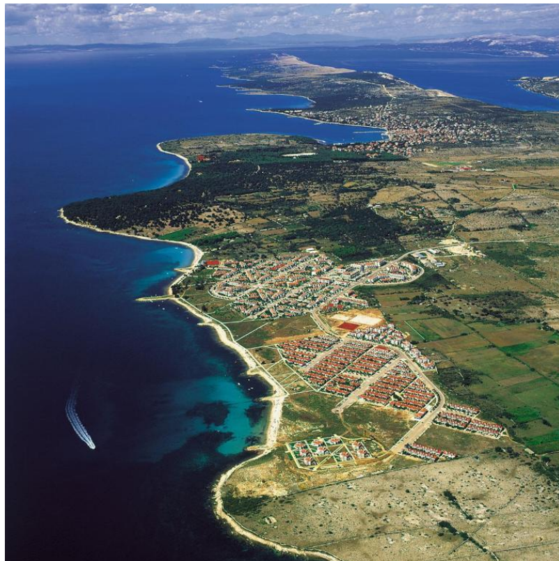
Slika 4. Planski izgrađeno apartmansko naselje Gajac

Party turizam sa sobom je donio i promjenu u infrastrukturi, razmišljanju stanovništva, svakodnevnom životu te je utjecao na izgradnju turističkih objekata. Ovakav oblik turizma naseljima koja se nalaze u blizini Zrća, kao što je to u ovom primjeru Gajac, donio je probleme poput buke, odlaganja otpada, kanalizacije i prometnih gužvi. 56