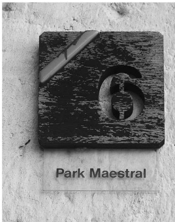
Slika 2. Kućni broj u apartmanskom naselju Červar Porat

Smatra se da se prvo brendiranje pojavljuje u ovom apartmanskom naselju, a primjer su natpisi ulica i kućni brojevi. Na samom ulazu u apartmansko naselje Červar Porat stoji totem na kojem se nalazio stilizirani urbanistički koncept naselja. Postoje tri kruga koja označavaju položaj stanova u Červaru Porat, prvi je plavi krug koji označava marinu i simbolizira koliko su stanovi blizu mora, sljedeća je ružičasta boja kruga koja označava središnji dio, te zelena koja označava rubni dio apartmanskog naselja, te su stanovi u tom dijelu bili bliže šumi. Danas te oznake možemo vidjeti na samo nekim kućama, no nazivi ulica i brojevi na kućama su se uspjeli očuvati. 45