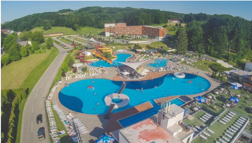
Slika 9: LifeClass Terme Sveti Martin

kvalitetnu uslugu i zadovoljstvo gosta kao „Prvi Healthness resort u Europi“. 79 Danas Resort ima ponudu Apartmana Regina sa 120 apartmana. Od 2009. Resort nudi smještaj u Hotelu četiri zvjezdice „Terme Sveti Martin“ sa kapacitetom od 320 ležajeva, od njih 151 su moderno opremljeni i 6 suite-a. Resort, osim opuštanja i aktivnog odmora, nudi kongres i team building uz autohtoni gurmanski doživljaj te prekrasnu zelenu prirodu. Smješten je u zaštićenoj prirodi gornjeg Međimurja, u blizini urbanih središta, događaja, festivala i znamenitosti.