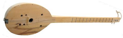
Slika 8. Tamburica

klena. Potrebna je trzalica koja je napravljena od trešnjine kore. To glazbalo, zvano i cindra , je u Istri poznato samo na Ćićariji (Morić, 2014, Marušić, 2021, Pernić, 1997).