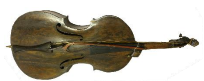
Slika 9. Bajs i gudalo

Bajs je glazbalo koje zvuk proizvodi gudalom. Prema Marušić (2021) bajs: „ima dvije žice od goveđih crijeva, ugođene u kvintama. Od ostalih se gudačkih glazbala razlikuje po obliku i ulozi konjića . Funkciju dušice kod bajsa ima produženi dio jedne strane konjića, tj. nožica koja se spušta kroz četvrtasti otvor na glasnjači i seže do dna trupa. S obzirom na veličinu i stranu produžene nožice razlikuju se bajsevi oblika viola da gamba s produženom nožicom na desnoj strani te bajsevi oblika violončela, s produženom nožicom na lijevoj strani.“