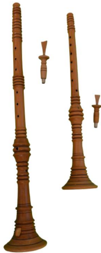
Slika 2. Vela i mala roženica

na električni pogon. Slobodno možemo reći da vjerojatno nikada u Istri nije bilo toliko sopela kao u današnje vrijeme, što je rezultat njihove popularizacije krajem 60-ih godina. Roženice se uglavnom koriste za samostalno sviranje u paru, a danas i sve češće u kombinaciji sa harmonikom i/ili pjevanjem. Tu treba svakako upozoriti da valja odvojiti istarske sopele od krčkih sopila, te ih smatrati sličnima ali u organološkom smislu različitim glazbalima (Pernić, 1997; Morić, 2014).