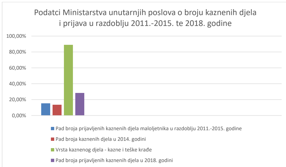
Grafikon 2. Podatci Ministarstva unutarnjih poslova o broju kaznenih djela i prijava u razdoblju 2011.-2015. te 2018. godine. Vlastita izrada.