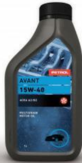
Slika 3. Petrol Avant 15W - 40