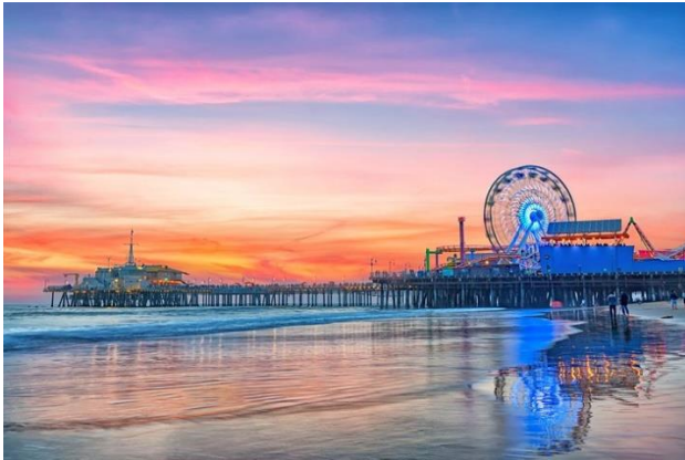
Slika 15. Santa Monica, Kalifornija

Plaža Santa Monica, u Kaliforniji, prepoznatljiva je svijetu po svome molu iz 1909. godine. Na tom molu mogu se pronaći ulični umjetnici, skateboarderi, roleri, biciklisti, vrtuljci, restorani, trgovine i Ferrisov kotač na solarni pogon. Godine 1920. počinje se razvijati odbojka na plaži i surfanje. Plažu danas krasi parkovi, igrališta, nekolicina hotela te biciklistička staza (Santa Monica Beach, 2021).