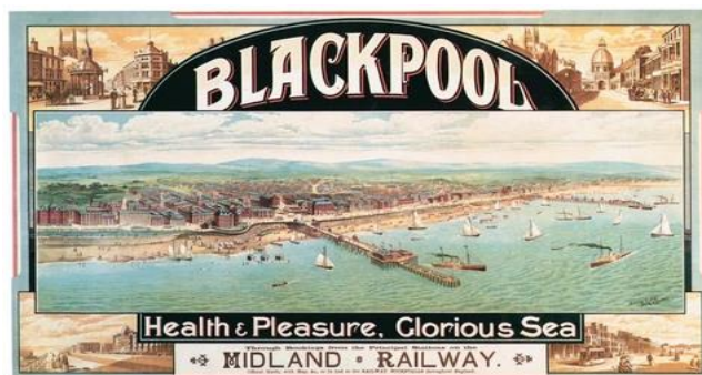
Slika 1. Blackpool

doba (1901. – 1910.), ljetovališta su postala javno dostupna i vrlo popularna (Taylor, 2017). Zakonski akti, kao što su Zakon o tvornicama iz 1850. (dopuštanje slobodnih subotnjih popodneva radnicima) i Zakon o državnim praznicima iz 1871. (opće odobravanje slobodnih dana), omogućuju slobodno vrijeme ostaloj radnoj snazi te poboljšavaju njihove životne uvjete. Sredinom 19. stoljeća plaža kao lijek, namijenjen aristokratskoj eliti, industrijalizacijom i boljim prometnim povezivanjem zamijenjena je plažom užitka i razonode. Godine 1850. engleski grad Blackpool se etablirao kao odmaralište za sve klase (Inglis, 2000: 50). Od mjesta hidroterapije plaža se pretvara u mjesto dokolice, rekreacije i relaksacije da bi na kraju postala mjesto za odmor od posla i svakodnevice.