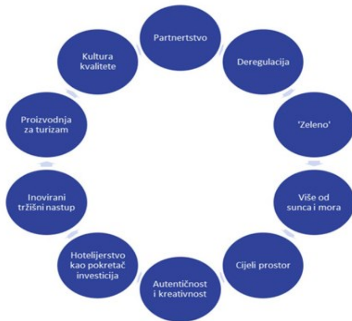
Slika 2 Razvojna načela hrvatskog turizma do 2020. godine