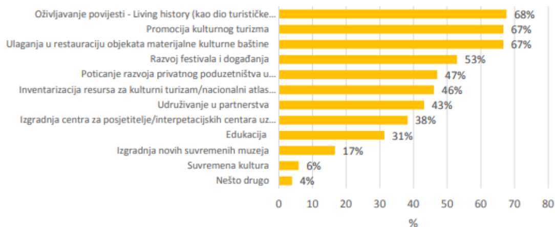
Slika 2. Prioriteti razvoja kulturnog turizma