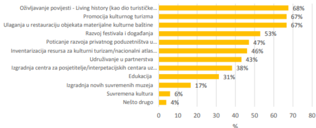
Slika 2. Prioriteti razvoja kulturnog turizma