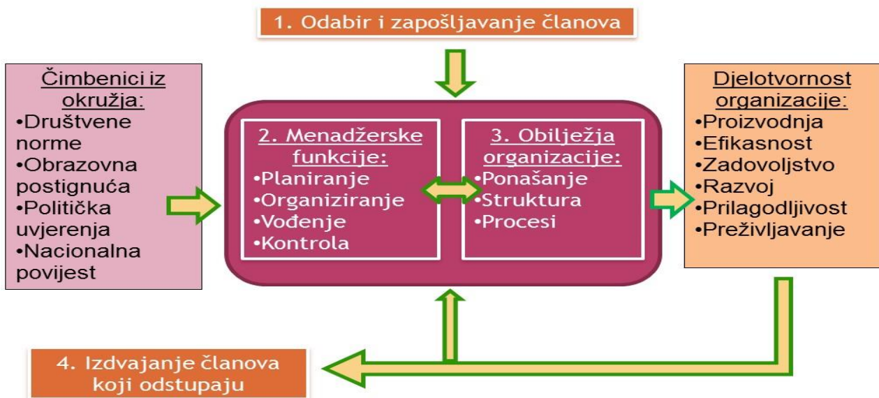
Slika 2: Organizacijska kultura i djelatnost organizacije

Organizacijska kultura i djelatnost organizacije