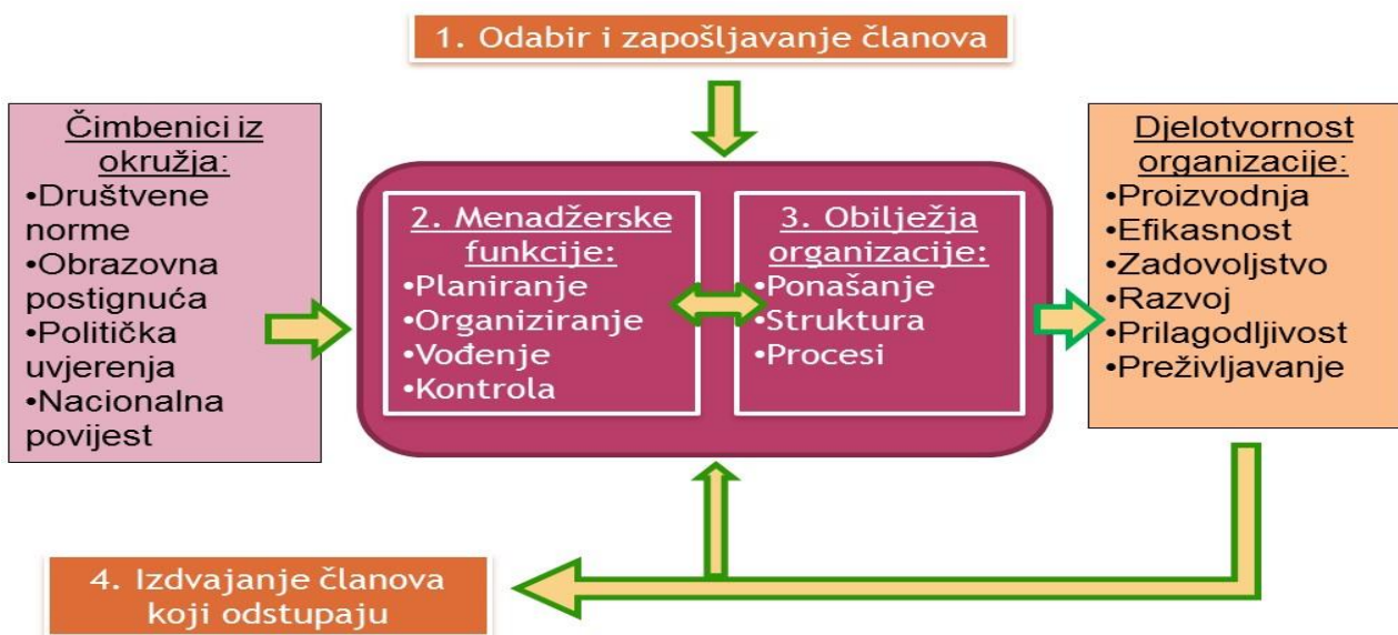
Slika 2: Organizacijska kultura i djelatnost organizacije

Organizacijska kultura i djelatnost organizacije