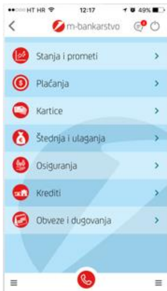
Slika 4 Zaslona za modul m-bankarstvo aplikacije m-zaba (Zagrebačka banka, n.d.)

u aplikaciji m-zaba. Važno je naglasiti da je ovo već drugi korak u procesu potrage za stanjem računa u financijskoj aplikaciji.