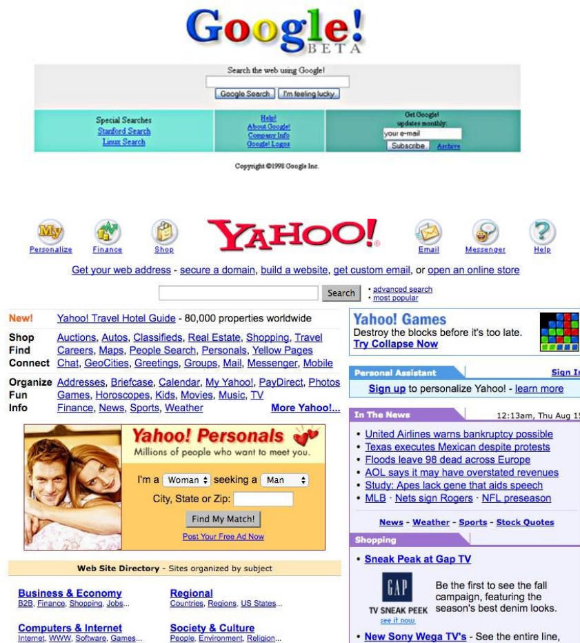
Slika 1 Korisničko sučelje tražilica Google (First Versions, 2015) i Yahoo (D'Onfro, 2016),

Slika 1 prikazuje grafička korisnička sučelja dvije internetske tražilice, Google i Yahoo. Yahoo je u prvim godinama Googleova postojanja imao najviši udio tržišta internetskih tražilica. U 2001. godini Yahoo je dosegao svoj vrhunac od preko trećine svih internetskih pretraga obrađenih na svojoj platformi (Pollock, n.d.). Međutim, Google je od svojih početaka imao prednost u dva ključna područja. Prednost Googleova korisničkog sučelja može se iščitati iz Slike 1.