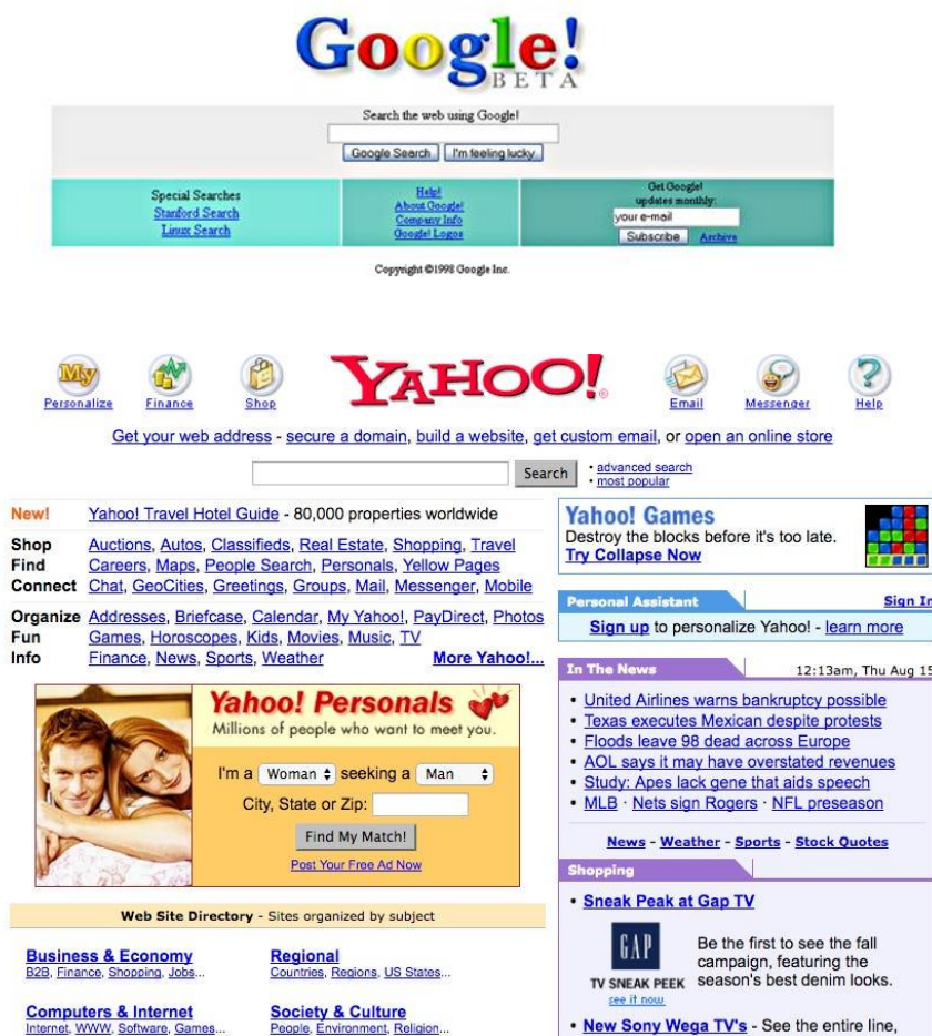
Slika 1 Korisničko sučelje tražilica Google (First Versions, 2015) i Yahoo (D'Onfro, 2016),

Slika 1 prikazuje grafička korisnička sučelja dvije internetske tražilice, Google i Yahoo. Yahoo je u prvim godinama Googleova postojanja imao najviši udio tržišta internetskih tražilica. U 2001. godini Yahoo je dosegao svoj vrhunac od preko trećine svih internetskih pretraga obrađenih na svojoj platformi (Pollock, n.d.). Međutim, Google je od svojih početaka imao prednost u dva ključna područja. Prednost Googleova korisničkog sučelja može se iščitati iz Slike 1.