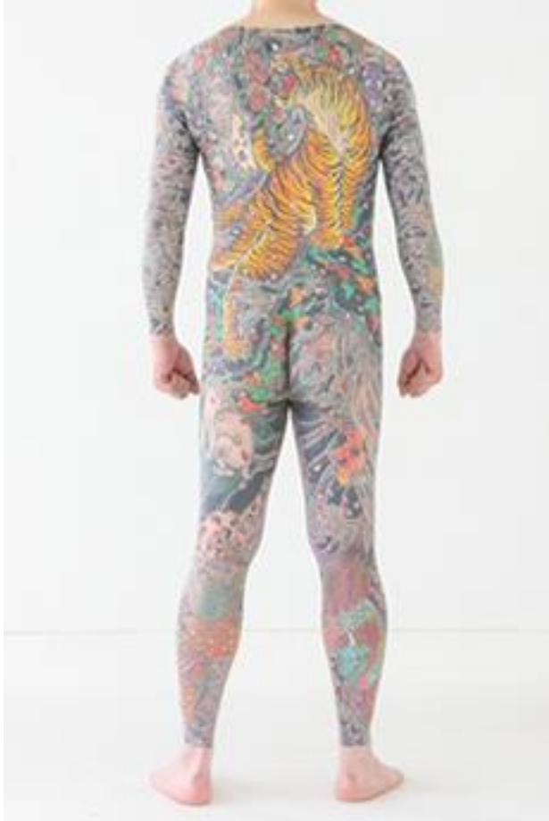
Slika 8. Munewari