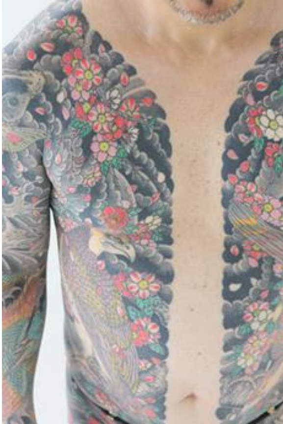
Slika 9. Sanja Matsuri, pojedinci u „odijelima“ stoje na mikoshiju