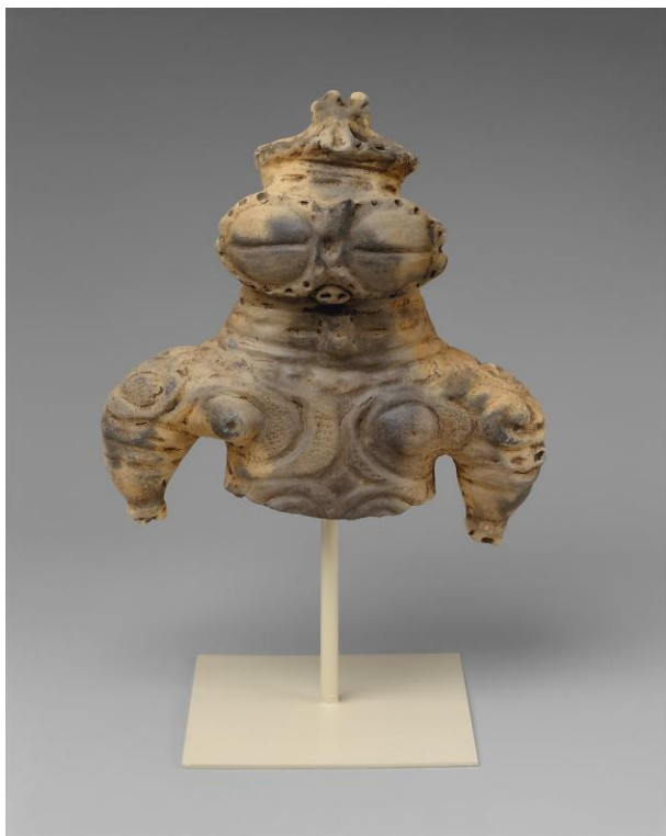
Slika 1. Dogū , glinena figurica