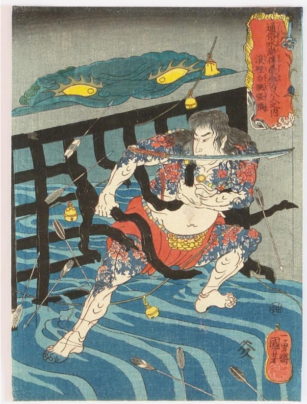
Slika 6. Rori Hakucho Chojun, jedan od 108 heroja popularnog iz ilustrirane verzije Suikodena, Utagawa Kuniyoshi