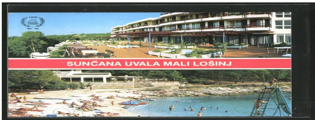
Slika 8. Sunčana uvala