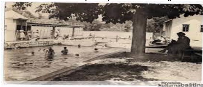
Slika 1. Tuheljske toplice sa starih razglednica