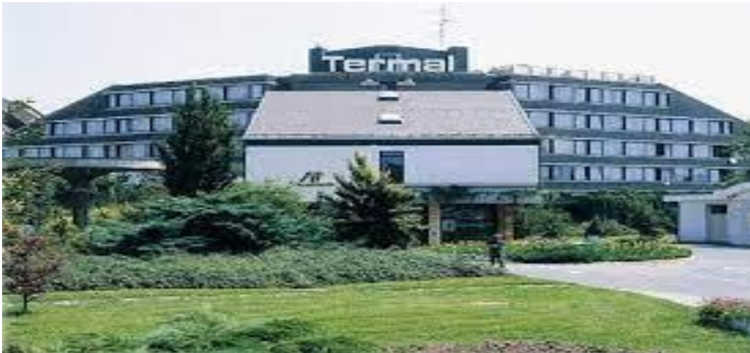
Slika 4. Hotel Termal