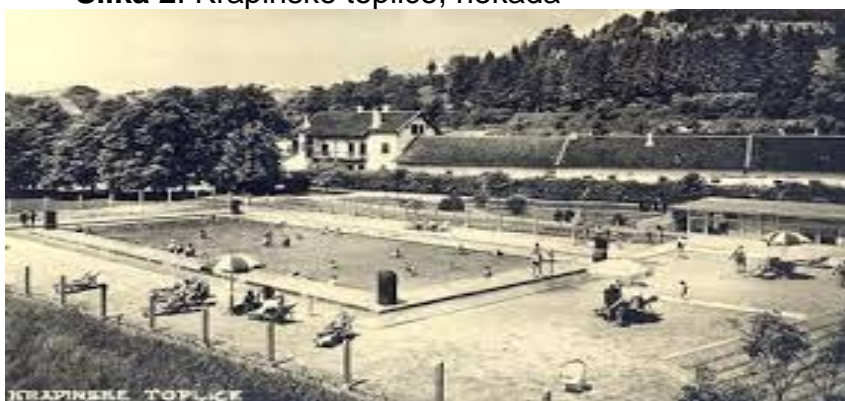
Slika 2. Krapinske toplice, nekada