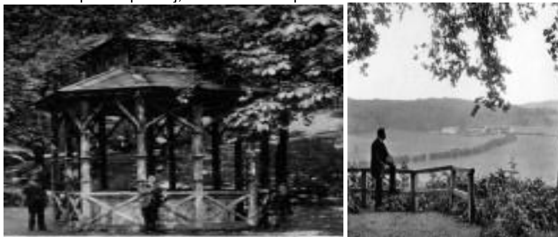
Slika 3. Kupališni perivoj, Varaždinske toplice