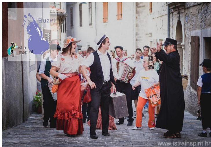
Slika 6. Predstava na 'Subotini po starinski'

Manifestacija započinje u 12 sati kampelanjem , podizanjem zastave i ulaskom stoljetne Sokolske glazbe u grad te navođenjem programa koji će se zbivati na pojedinim punktovima. Svakim punim satom se na nekom od trgova izvodi neki 'jači' program, primjerice: ples na trgu, prezentacija i revija, koncert i drugo. 87 Cilj organiziranja događaja jest da se kroz program upozna nasljeđe grada i njegovih mještana. Tim povodom upotpunjuje se već bogati program s predstavom u kojoj se nastoji što više približiti autohtonom identitetu, da se čuje stari buzetski govor, zapleše po starinski i iznese koja anegdota ili zanimljivost.