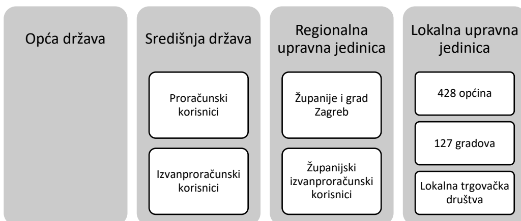
Slika 2. Struktura sektora opće države u Republici Hrvatskoj