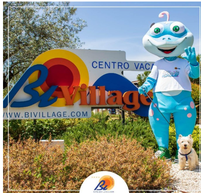
Slika 3.: Maskota turističkog naselja Bi Village „Bizu“