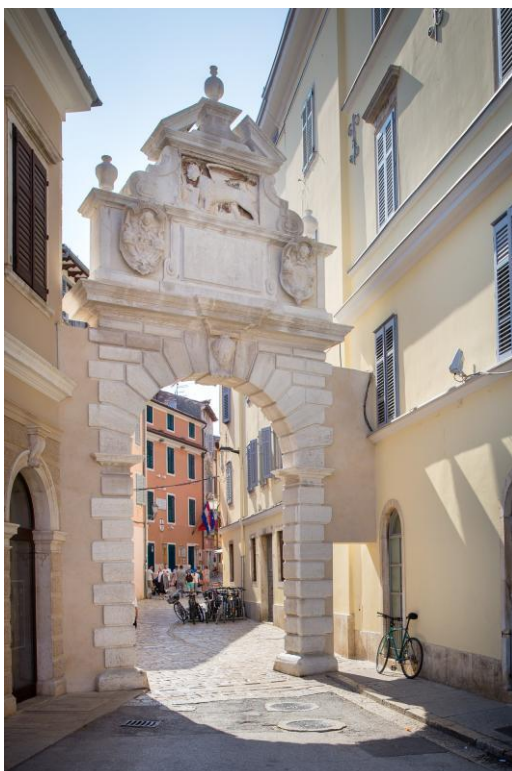
Slika 8. Balbijevo luk