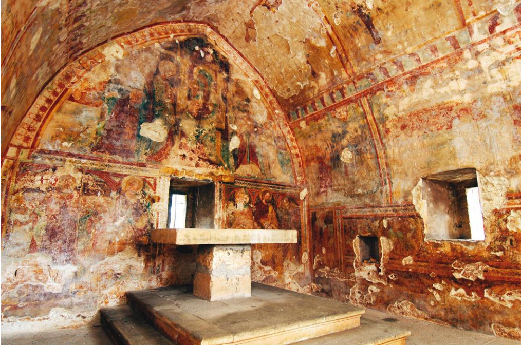
Slika 4. Freske u crkvi sv. Antuna Pustinjaka

se na gornjem dijelu istočnog zida, a prikazuje Bogorodicu s Djetetom, na trećentističkom prijestolju, okruženu svecima i donatorom, barbanskim kanonikom, koji kleči s desne strane.“ 10