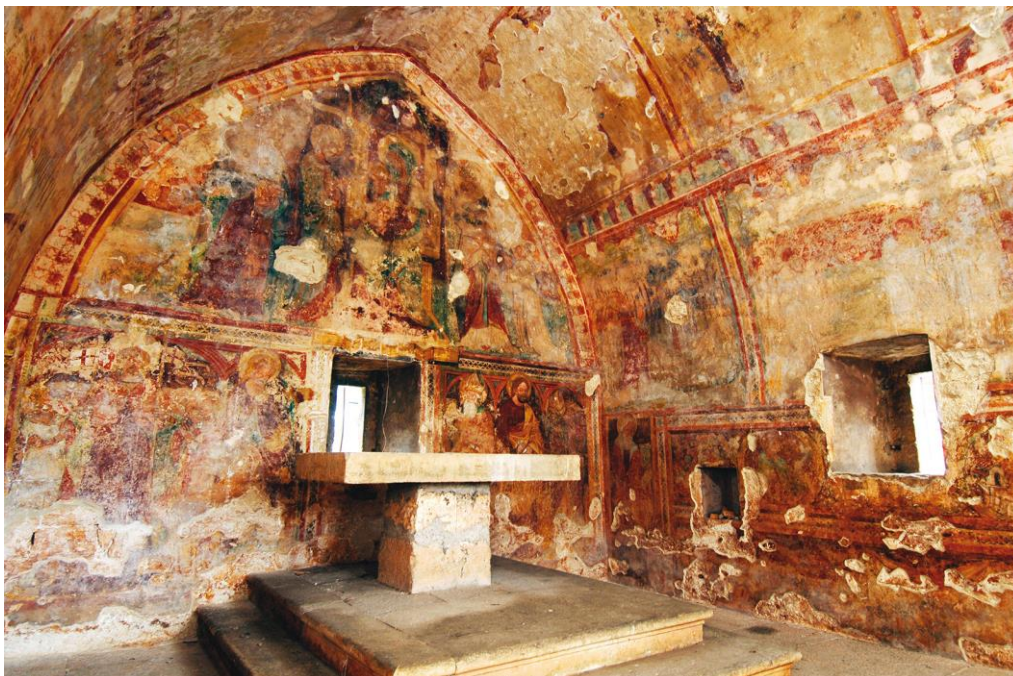
Slika 4. Freske u crkvi sv. Antuna Pustinjaka

se na gornjem dijelu istočnog zida, a prikazuje Bogorodicu s Djetetom, na trećentističkom prijestolju, okruženu svecima i donatorom, barbanskim kanonikom, koji kleči s desne strane.“ 10