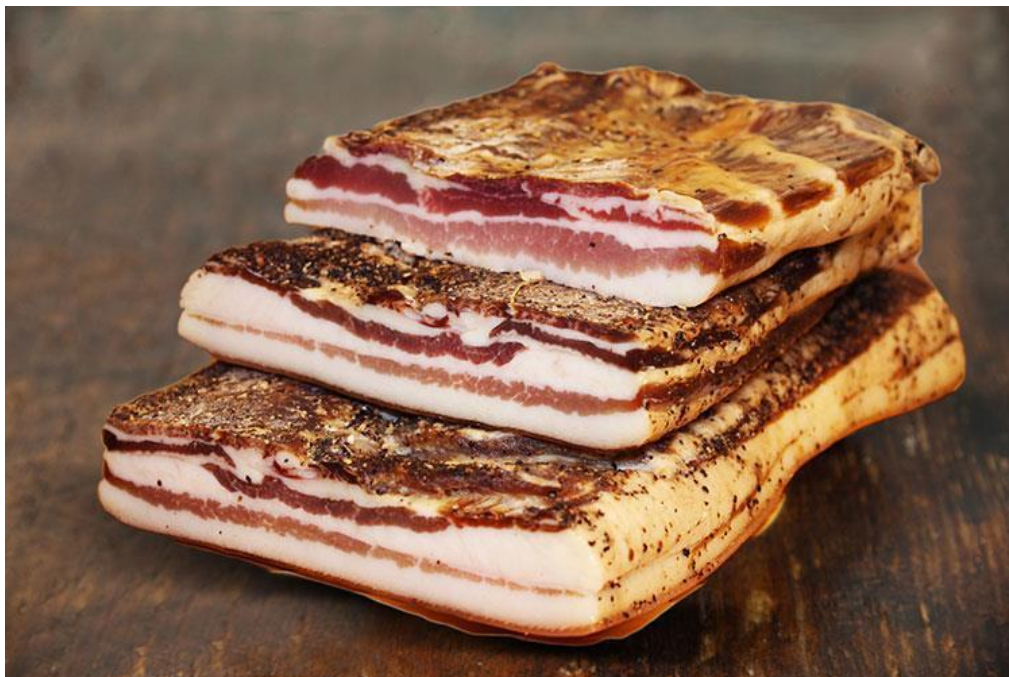
Slika 9. Prikaz Istarske pancete

Jedina razlika između pancete i guanciale je u dijelovima mesa od kojih se proizvode. Panceta se proizvodi od carskog mesa koje se nalazi na svinjskim rebrima, a guanciale se proizvodi od obrazine koja se nalazi na glavi svinje, međutim u kuharskom svijetu guanciale je puno cjenjenija i kvalitetnija namirnica zbog svoje strukture i slatkoće. Priprema ovih namirnica je potpuno ista, a sastoji se od toga da meso prvo odstoji u soli i lovoru te nakon tri dana ide pod prešu dok se ne izvuče sav višak vode iz njih. Nakon toga se uvaljaju u papar te se suše nekoliko mjeseci, imajući na umu da se panceta suši nešto duže od guanciale. Panceta se, također, može smotati u rolu kad je na pola suha kako bi zadobila drugačiji oblik. 54