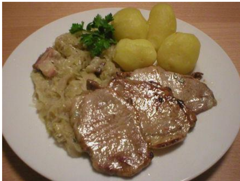
Slika 10. Ombolo sa kiselim kupusom

Prije nego što postane potpuno suh, ombolo se termički obrađuje na više načina. Jedan od tih načina je giravolta na roštilju, ombolo u umaku od bijelog vina i češnjaka i ombolo sa kiselim kupusom (sl. 9). Kod zadnjeg jela ombolo se kuha u kiselom kupusu, dok se u drugom jelu najprije ombolo zapeče sa jedne i sa druge strane, zatim se doda jedan režanj češnjaka u komadu dok ne dobije zlatno-žutu koru te se zalije sa bijelim vinom. Nakon što se vino malo ukuha, ombolo je gotov za posluživanje. Za vrijeme prašćine, dok se tradicijski peku ombolo i kobasice, domaćin i njegovi gosti uživaju u okusima istarske supe. 58