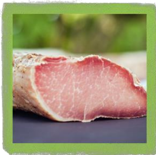
Slika 4. Ombolo ili zarebnjak