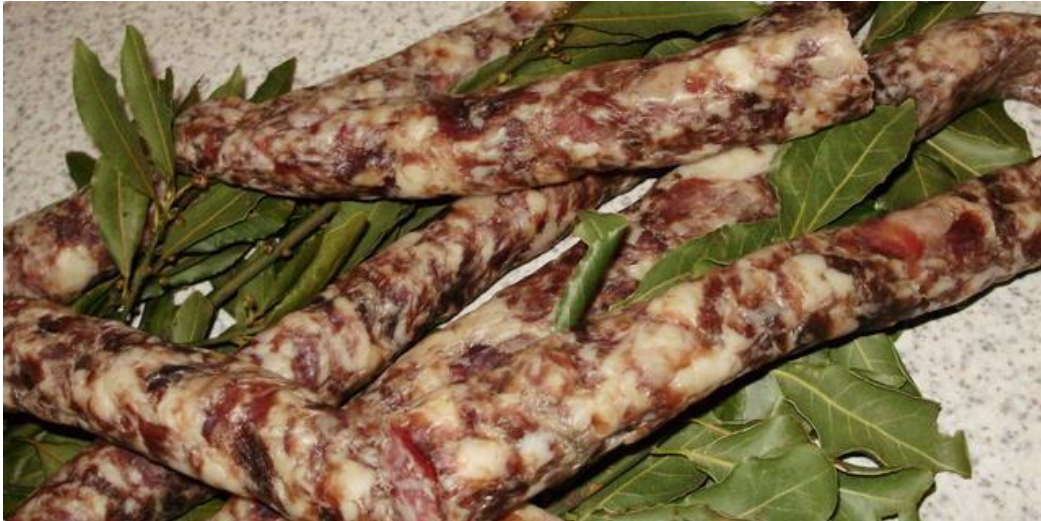
Slika 6. Prikaz Istarske kobasice začinjene lovorovim listom