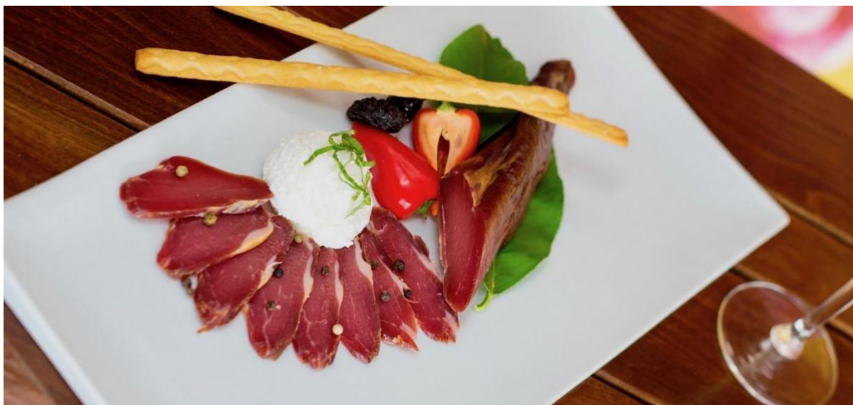
Slika 3. Suha i narezana ledvica