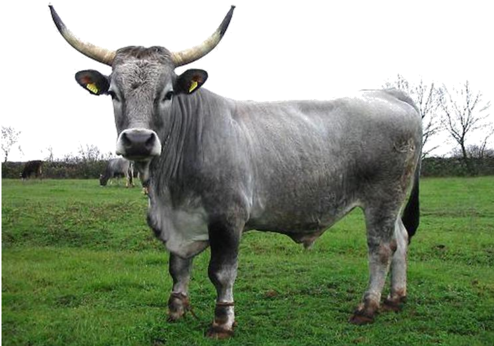
Slika 11. Boškarin