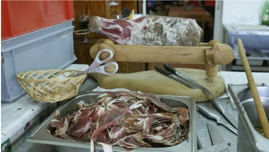
Slika 5. Prikaz rezanja špalete