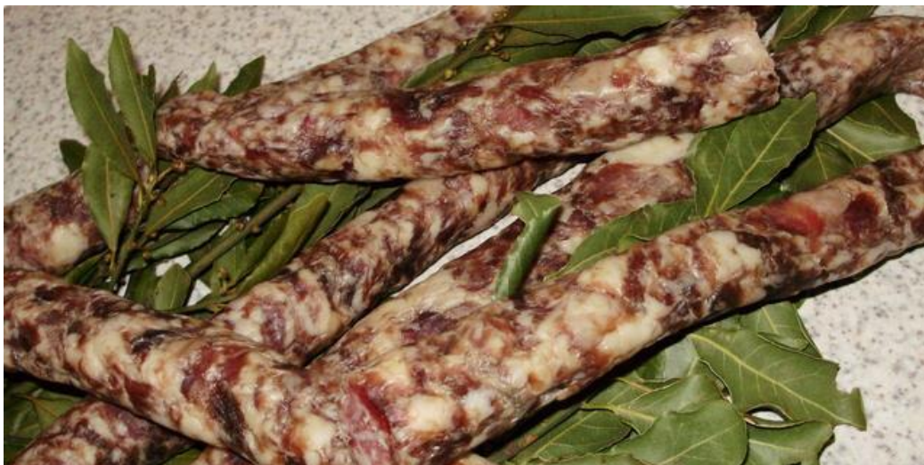
Slika 6. Prikaz Istarske kobasice začinjene lovorovim listom