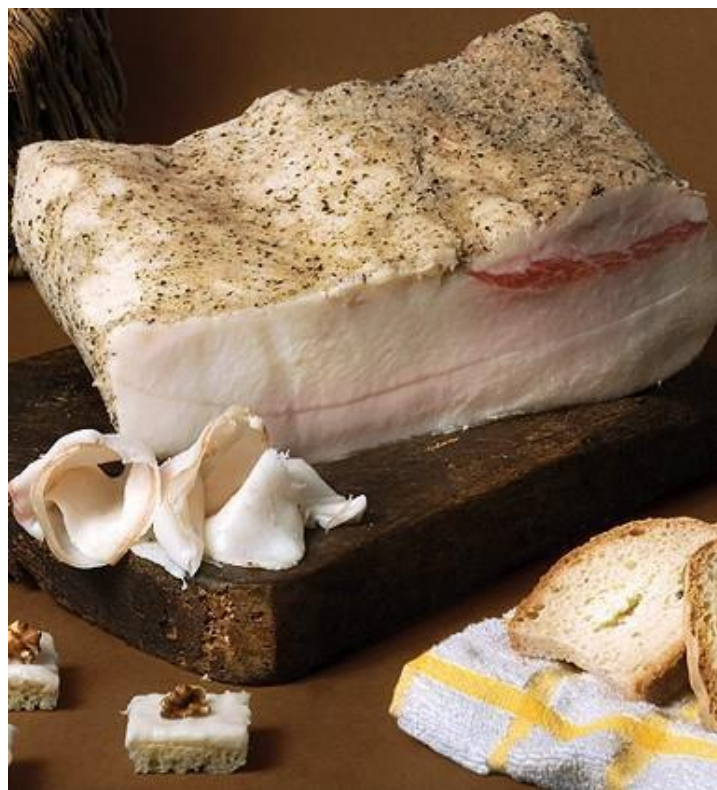
Slika 8. Lardo

Kao što je slučaj sa čvarcima, lardo se dobiva od svinjskog masnog tkiva. Međutim, razlika je u tome što lardo ne prolazi kroz nikakvu termičku obradu, već se masnoća posoli te se ostavlja u sanduk kako bi pustilo svu svoju vodu. Nakon tri do četiri dana, očisti se od soli, uvalja se u papar (kao ombolo i ledvica) te se suši nekoliko mjeseci. Također, važno je napomenuti još jednu bitnu razliku larda i svinjske masti, a ta je da se lardo isključivo radi od masnog tkiva koje se nalazi uzduž kralježnice svinje. Kuhari ga najčešće koriste kao zamjenu za sol i ulje. 53