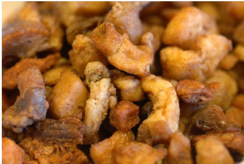
Slika 7. Istarski čvarci – hrskaviji i manje masni od slavonskih

Čvarci su jelo od prženog masnog svinjskog tkiva te se proizvode i pripremaju tako što se masno tkivo reže na kockice duge, široke i debele otprilike 3 cm te se nareže veća količina masnog tkiva. Zatim se stave u hladan lonac te se na laganoj vatri uz konstantno miješanje čeka da se masnoća počne topiti te da se salo kao takvo počne pržiti u vlastitoj masnoći. Gotovi su kada dobiju zlatno smeđu boju. Kada se postigne takva boja, vade se iz masnoće te se protisnu kroz prešu. Odlože se na papirnate ručnike kako bi upili ostatak masnoće. Ona masnoća u kojoj su se čvarci pržili pažljivo se procijedi kako bi sav talog ostao u loncu, te kasnije kada se ohladi služi kao svinjska mast. Ono što je specifično za istarski način proizvodnje čvaraka jest mala količina masnoće u gotovom proizvodu kako bi bili što hrskaviji, dok se, za usporedbu, u kontinentalnim dijelovima Hrvatske, dio masnoće ostavlja u proizvodu što ih čini mekšima i sočnijima. 52