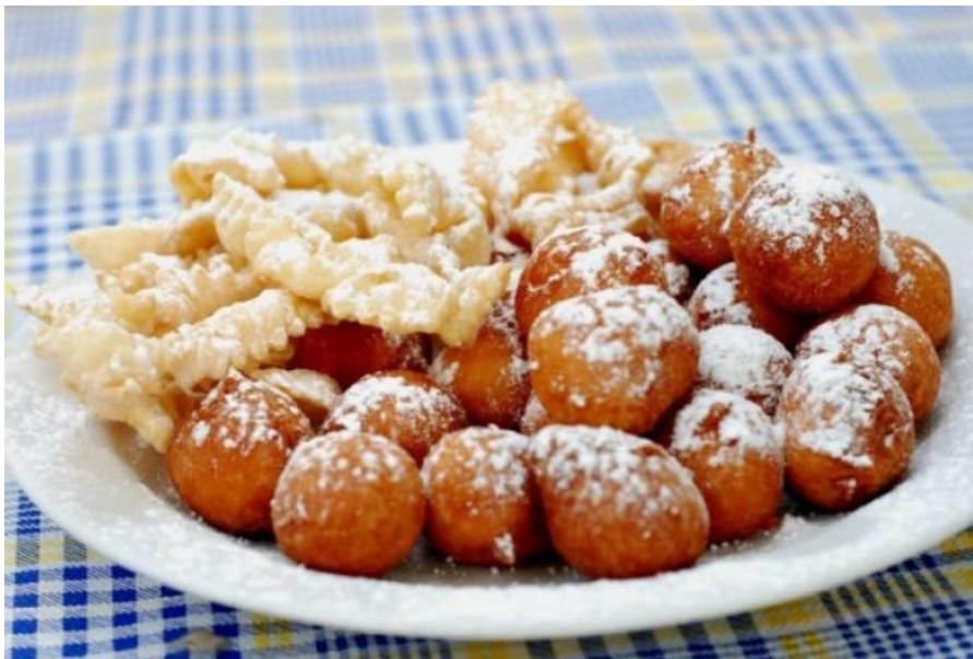
Slika 1. Fritule (okrugle) i kroštule (tanke i drugačke)

Naspram slanih jela, u Istri je ograničen broj slastica koji se pripremao. Najveći razlog tome jest što slastice nisu mogle dati ono što su mogle maneštre i palenta – sitost i energiju za rad u polju. Od slastica su se najviše pripremale fritule, kroštule ili hroštule, povetica (savijača od dizanog tijesta s nadjevom od oraha i jabuka), pandišpanj (biskvit od jaja, šećera i brašna), jajarice (Uskršnje pecivo s jajetom), pinca (slatki uskršni kruh), cukerančići (prhko tijesto uvaljano u šećer = cuker), štrudel (štrudla ili savijača) od jabuka, oraha i lješnjaka, breskve, ravioli te prženi krafii(tjestenina punjena sirom) u umaku od oraha. Novije vrijeme je donijelo i puno veći izbor slatkih jela, posebice uz miješanje tradicionalne sa modernom kuhinjom. 24