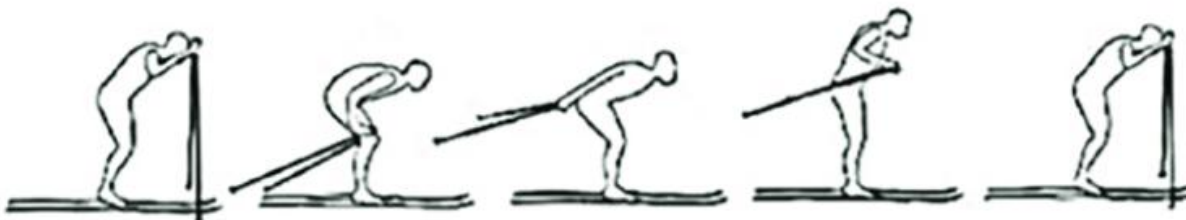
Slika 9. Suručno odguravanje

Skijaš se suručno odguruje objema rukama i neprestano klizi na obje skije. Ovaj se element upotrebljava na vodoravnom terenu kod odlične kliznosti te na blažim spustovima kod slabije kliznosti podloge. Ciklus kretanja je dug od četiri do osam metara te traje od sedam stotinki do dvije sekunde.