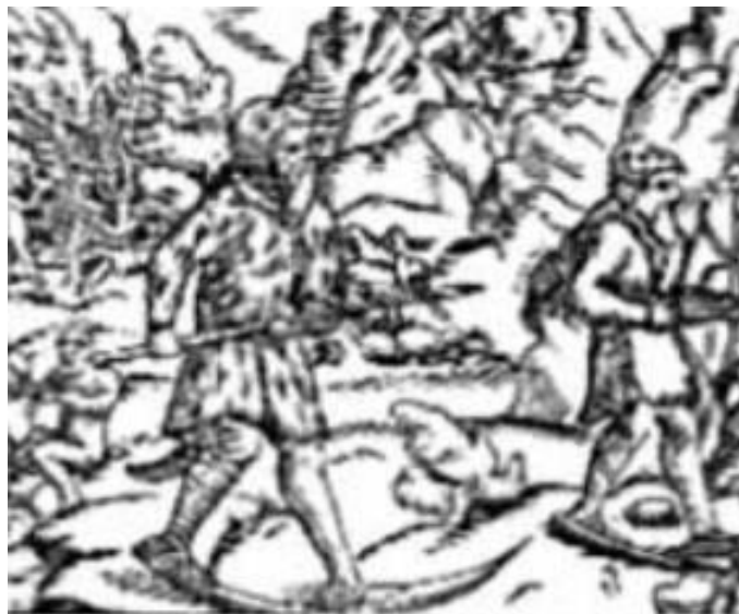
Slika 3. Lovci na skijama