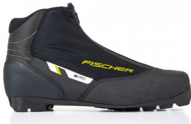
Slika 15. Cipele za klasičnu tehniku