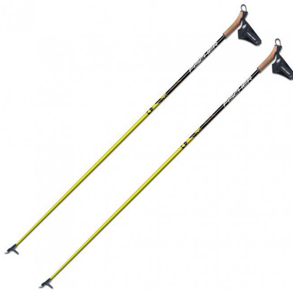
Slika 17. Skijaški štapovi

Štapovi za skijaško trčanje omogućuju odguravanje u smjeru kretanja. Sastoje se od ručke, tijela i korpice. Moraju biti lagani, primjerene tvrdoće i elastičnosti. Ručke moraju omogućiti dobar prijem ruke za štap te moraju biti prilagodljive veličini šake. Tijelo samog štapa izrađeno je od različitih materijala; aluminij, staklena vlakna, karbon i sl. Zatim, korpice štapova mogu biti različitih veličina, ovisno o vrsti snijega i kvaliteti uređenosti skijaških staza. Veće korpice se koriste na mekanim stazama, a manje na tvrdim uvjetima. Vrh same korpice mora biti oštar i čvrst i sastoji se od različitih metala. Dužina štapa se odabire ovisno o tehnici. Tako je za klasičnu tehniku dužina štapa oko 25 centimetara kraća od visine skijaša ili do visine ramena. S druge strane, za kliznu tehniku, dužina štapa je oko 15 centimetara kraća od visine skijaša ili je do visine brade. “U natjecateljskom dijelu skijaškog trčanja skijaši upotrebljavaju štapove koji su duži od navedenog, što ovisi o tehnici natjecatelja i biomehaničkim polugama skijaša” (Skender, 2012:89).