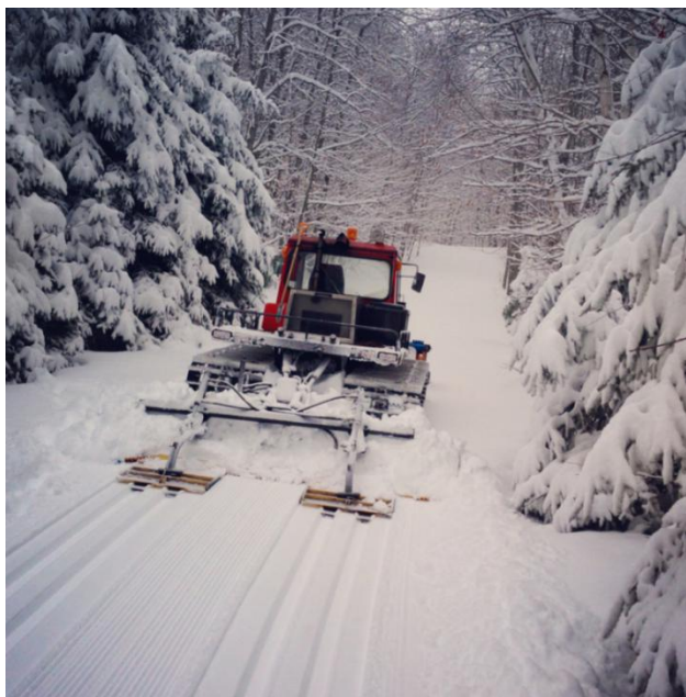
Slika 4. Staze za klasičnu tehniku - "špure"

Skijaško se trčanje dijeli na dvije tehnike, na klasičnu i kliznu tehniku. Klasičnu tehniku smatra se tradicionalnom tehnikom u kojoj se koriste paralelno izrađene staze (špure) za obje skije.