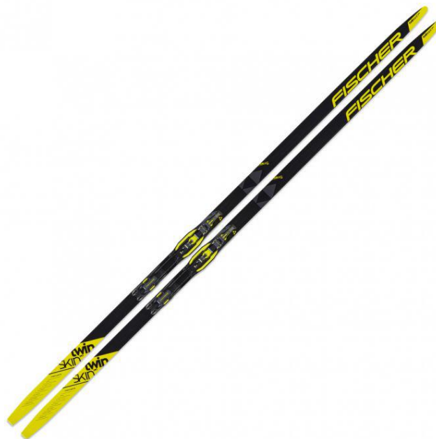
Slika 14. Skije

za hladne i toplije uvjete. Biraju se na temelju kvalitete snijega i vrsti maziva koje se stavlja na skije zbog sprječavanja proklizavanja unatrag. Skije za kliznu tehniku su kraće nego one za klasičnu tehniku. Odabire se skija koja je 10 do 20 centimetara viša od visine skijaša. Skije su tvrđe, a ostali parametri izbora za određenu vrstu i kvalitetu snijega, kao i težinu skijaša isti izboru skija za klasičnu tehniku.