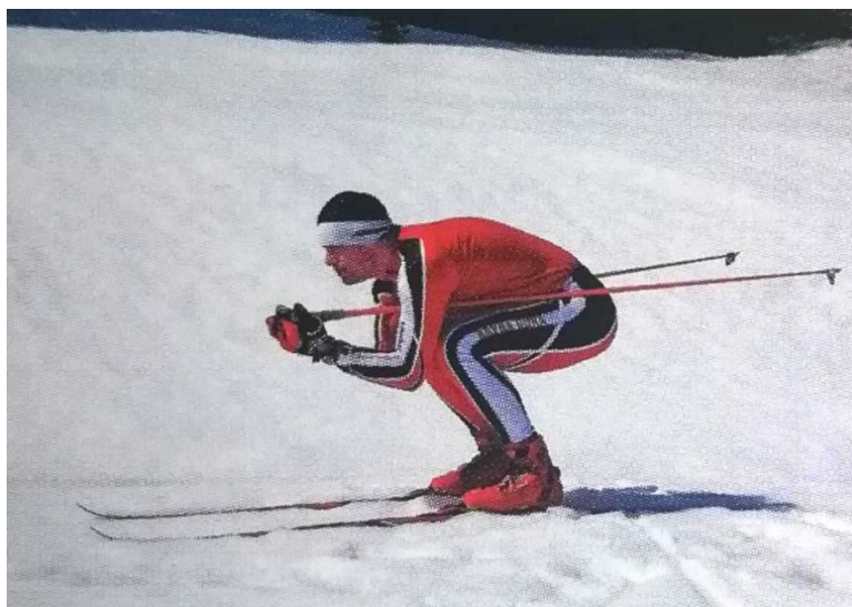
Slika 13. Niski natjecateljski položaj spusta

Niski natjecateljski položaj spusta - ovaj se položaj koristi pri kraćim, manje zahtjevnim spustovima te je jedan od osnovnih elemenata natjecateljskog skijaškog trčanja. Skije su u širini bokova i podjednako opterećene. Noge su pogrčene u koljenima, a tijelo je u izrazitom pretklonu. Laktovi su ispred koljena te su štapovi postavljeni pod pazuhima s korpicom prema natrag. Težište tijela je na srednjem dijelu stopala.