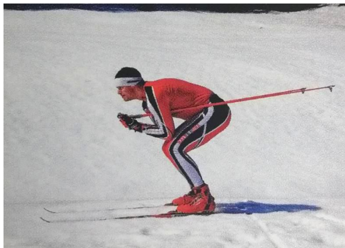
Slika 12. Srednji položaj spusta