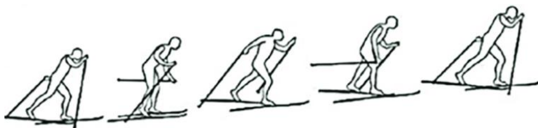
Slika 6. Dvotaktni dijagonalni korak

Osnovni korak i korak koji se najčešće koristi u različitim okolnostima na stazi jest upravo dvotaktni dijagonalni korak. Vrlo je učinkovit na ravnom terenu ili laganom usponu, na slaboj ili srednjoj brzini klizne podloge. Ciklus kretanja čine dva odraza sa suprotnim ekstremitetima - ruka i noga. U jednom ciklusu, dužina kretanja, odnosno klizanja skiji je od tri do osam metara, a vrijeme trajanja ciklusa je od jedne do dvije sekunde.