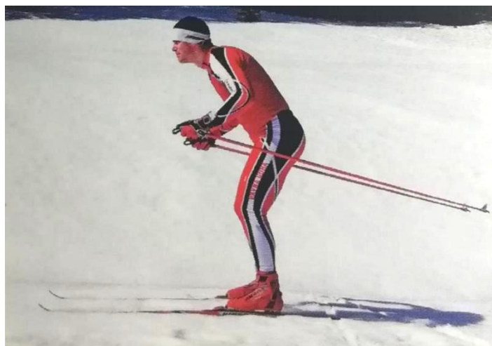
Slika 11. Visoki položaj spusta

Visoki položaj spusta - ovaj položaj spusta skijaš koristi pri izrazito strmim nagibima staze gdje je veća opasnost od pada i neposredno prije promjene smjera kretanja u zahtjevnijim spustovima. Skije su u širini bokova i podjednako opterećene. Skijaš je lagano pogrčen u skočnom, koljenom i zglobu koka, a tijelo je u laganom pretklonu. Štapovi su podignuti od podloge tako da su korpice na štapovima iza tijela.