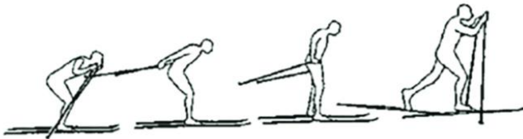
Slika 8. Korak sa suručnim odguravanjem

(Izvor: https://www.researchgate.net/figure/Overview-of-the-techniques , 9.8.2021.)