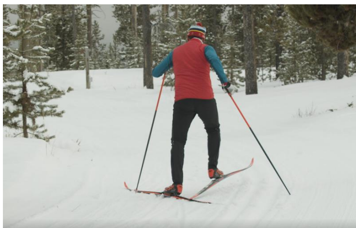
Slika 7. Dvotaktni dijagonalni korak - škarice

Težište tijela je na prstima stajne noge te su odrazi kratki i intenzivni tako da skijaš poskakuje s jedne na drugu skiju. Odraz ruke kreće iz pogrčenog lakatnog zgloba koji je odmaknut od gornjeg dijela tijela. Odraz je kratak i snažan. Skijaš aktivno prenosi težinu tijela s jedne skije na drugu pri čemu se zamašna noga također aktivno potiskuje prema naprijed u natkoljениčnom dijelu.