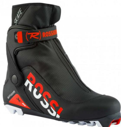
Slika 16. Cipele za kliznu tehniku