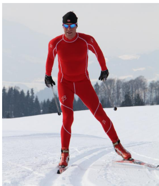
Slika 10. Poluklizni korak

Ovaj se korak koristi na vodoravnom terenu kod slabo klizne podloge, a danas se rijetko koristi u natjecanju skijaškog trčanja. Poznatiji je pod nazivom "Sitonen korak". Skijaš klizi na jednoj skiji koja se nalazi u stazi, dok se druga skija nalazi u V položaju te je malo podignuta od podloge. Zatim se odguruje istovremeno objema rukama te nogom koja je bila u V položaju.