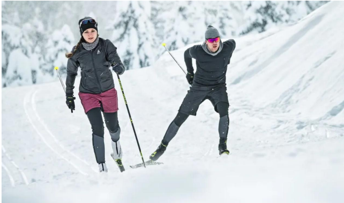
Slika 5. Klasična (lijevo) i klizna (desno) tehnika