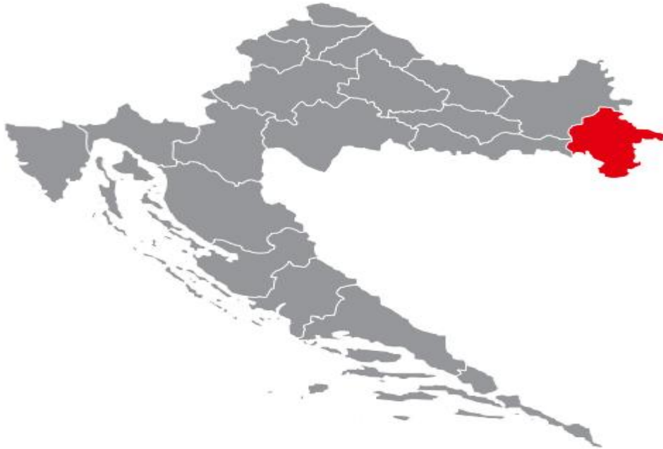
Slika 2: Položaj Vukovarsko - srijemske županije u Republici Hrvatskoj