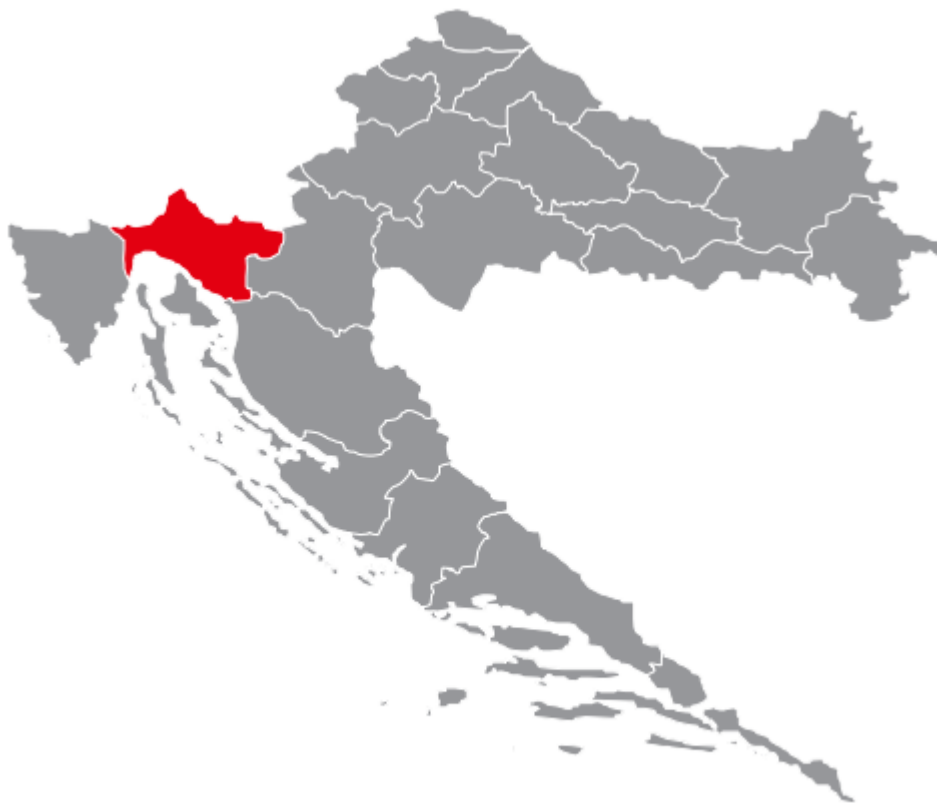
Slika 3: Položaj Primorsko - goranske županije u Republici Hrvatskoj