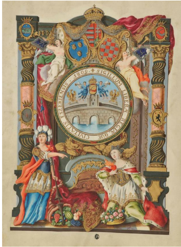
Slika 2. Grb slobodnog i kraljevskog grada Osijeka