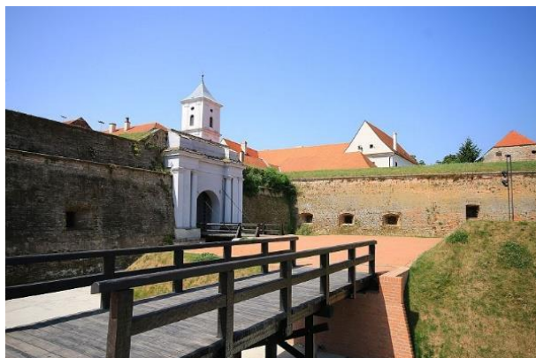
Slika 10. Vodena vrata