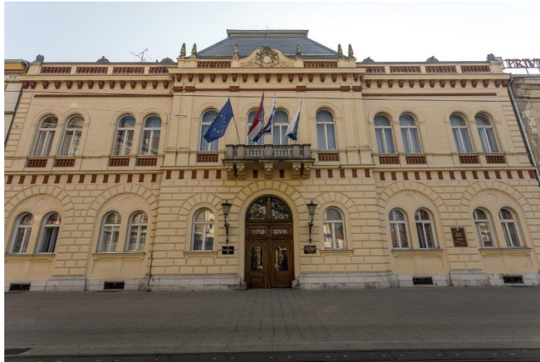
Slika 6. Palača Normann