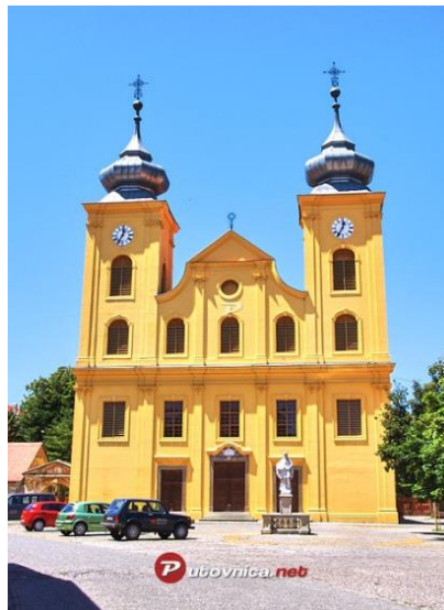
Slika 12. Župna crkva svetog Mihaela Arkandela