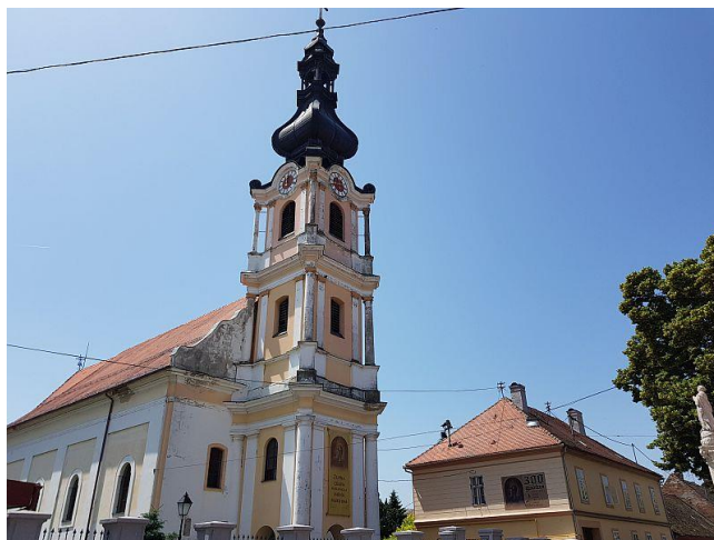
Slika 18. Crkva Preslavnog Imena Marijina