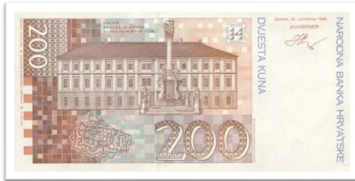
Slika 15. Zgrada Glavne komande na novčanici od 200 kuna