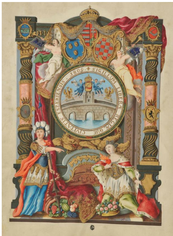
Slika 2. Grb slobodnog i kraljevskog grada Osijeka