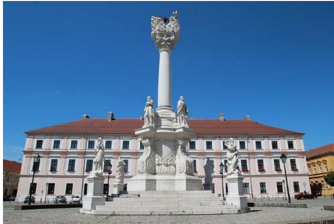
Slika 11. Zavjetni stup svetog Trojstva