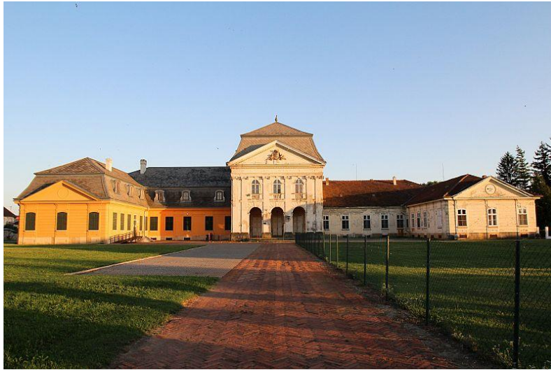
Slika 21. Dvorac Pejačević u Retfal