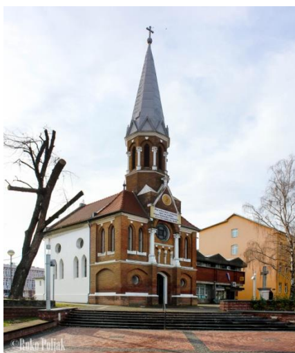
Slika 17. Kapela Gospe Snježne

Izvor: https://medium.com/notan-media/seciranje-grada-kapelice-gospe-snje%C5%BEn-81b2595f8fd6 Pristupljeno: 20. kolovoza 2021.