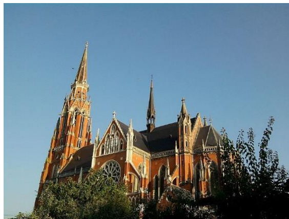
Slika 4. Konkatedrala sv. Petra i Pavla