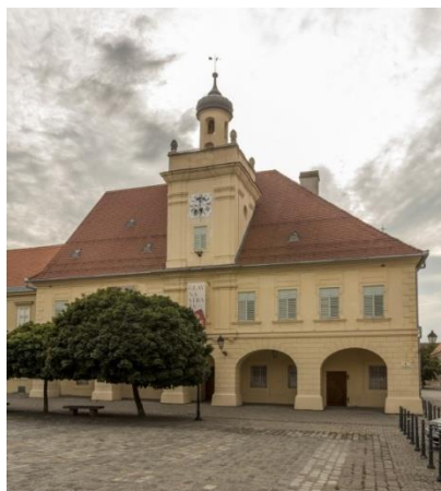
Slika 16. Zgrada Glavne straže