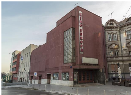
Slika 8. Kino Europa