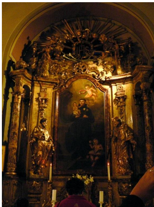
Slika 13. Oltar sv. Antuna u crkvi Uzvišenja sv. Križa