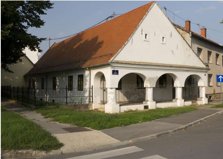
Slika 20. Kuća Kragujević – Mitrović