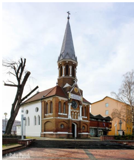
Slika 17. Kapela Gospe Snježne