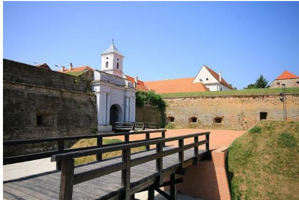
Slika 10. Vodena vrata