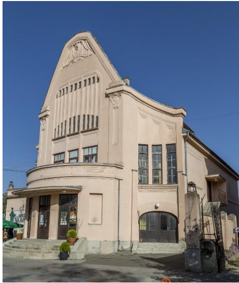
Slika 7. Kino Urania