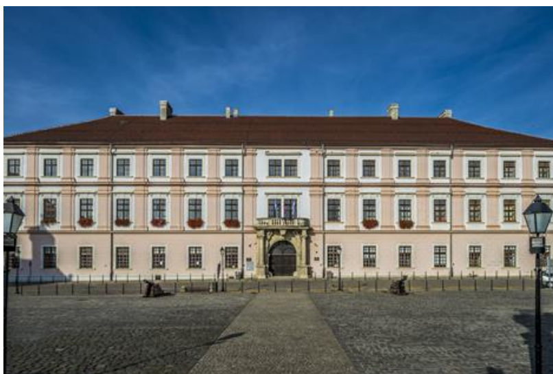
Slika 3. Sveučilište J. J. Strossmayera u Osijeku