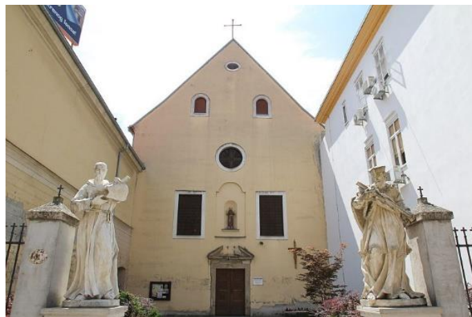
Slika 5. Kapucinska crkva sv. Jakova