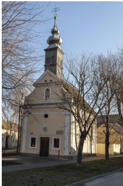
Slika 9. Kapela sv. Roka