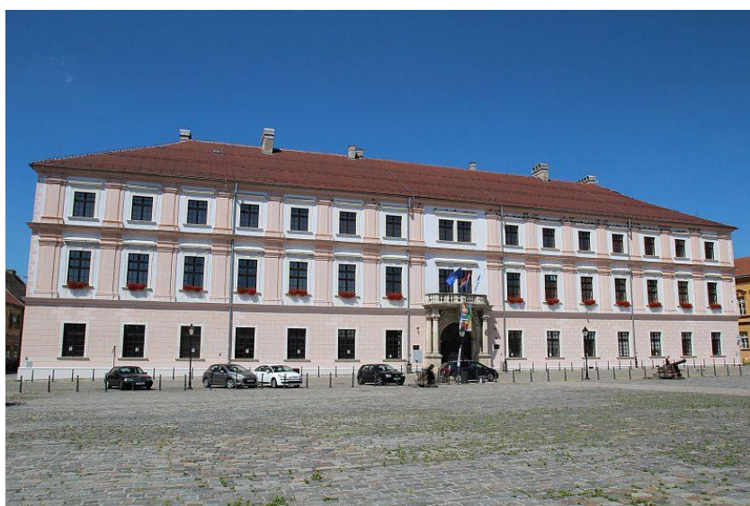
Slika 14. Zgrada Glavne komande