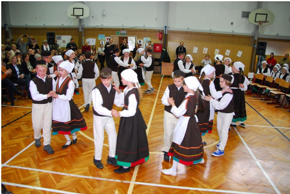
Slika 4: Plesanje baluna u osnovnoj školi Šijana, Pula