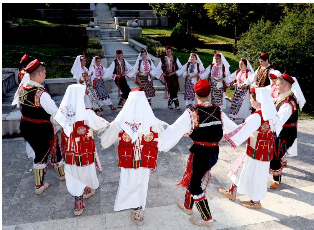
Slika 2: Vrličko kolo, Dalmatinska zagora