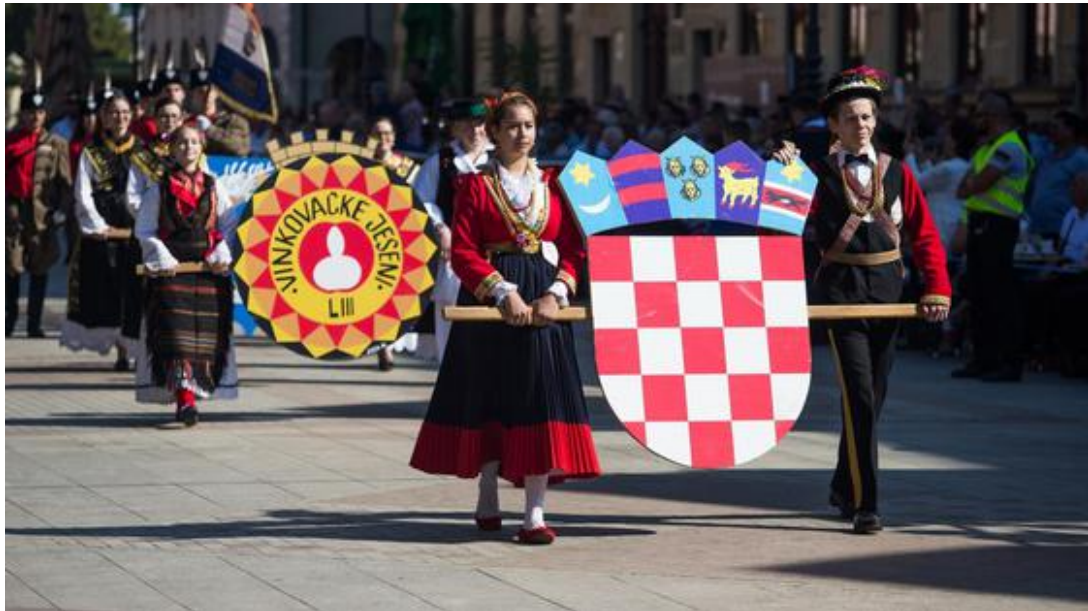
Slika 21: Vinkovačke jeseni – mimohod