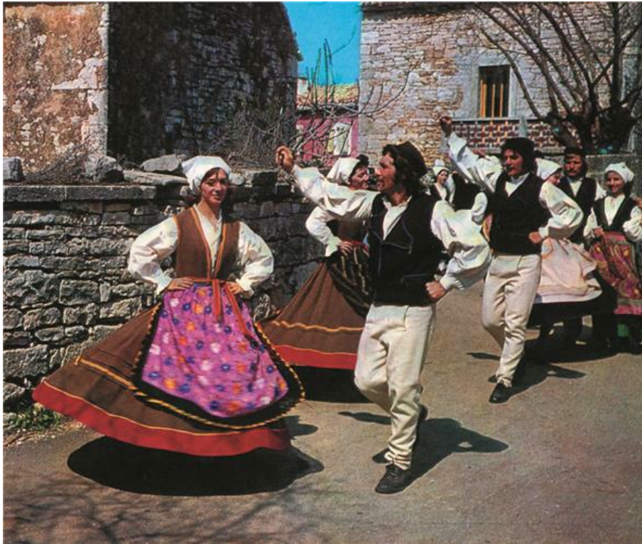
Slika 3: Balun