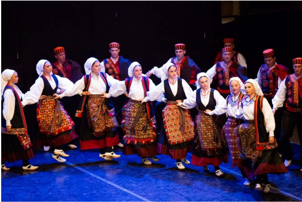
Slika 20: Ansambl Lado na dubrovačkoj tvrđavi Revelin