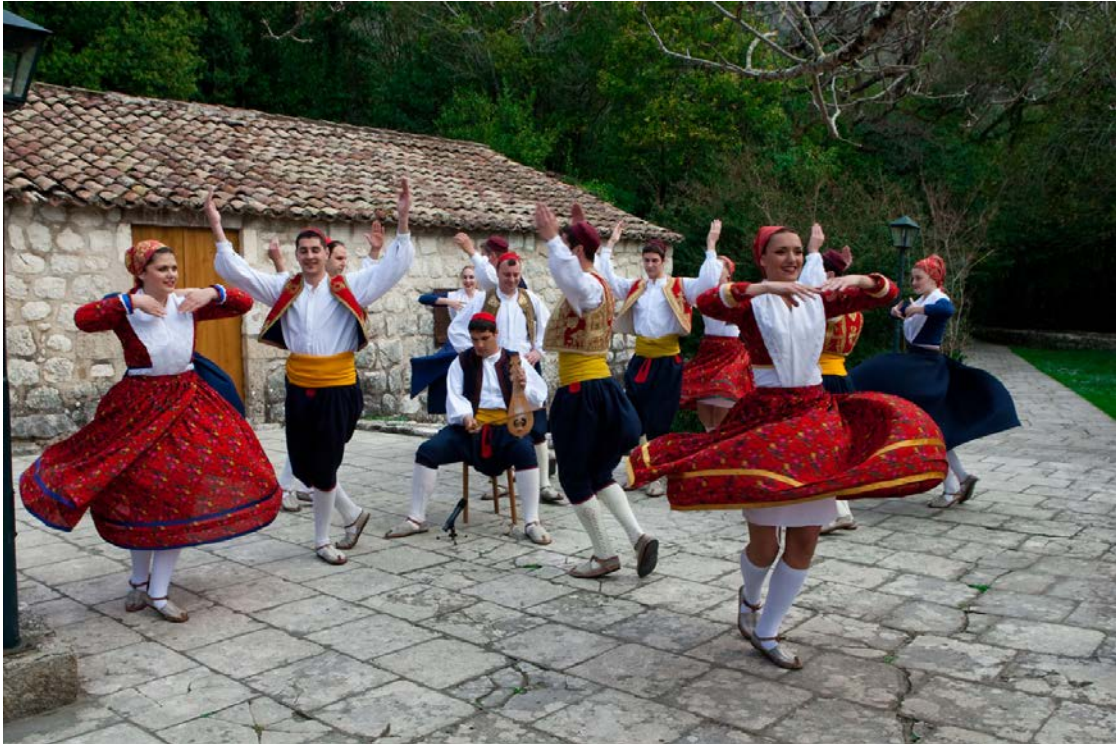
Slika 11: Lindo