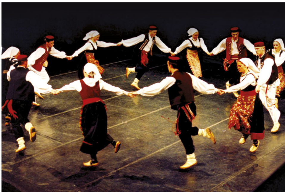
Slika 6: Ličko kolo