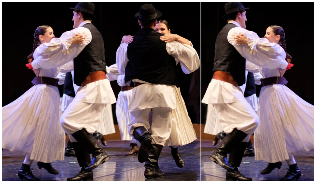
Slika 18: Polka

Polka je češki narodni ples koji karakterizira brzi ritam u dvočetvrtinskoj mjeri. Naziv polka se prvi put javlja u 19. stoljeću, točnije oko 1830 – ih, a nastao je od češke riječi půlka , što u prijevodu znači polovina. Razlog tome jest taj što polku karakteriziraju polukoraci. Od 19. stoljeća se polka naglo širila Europom i postala jedan od najomiljenijih plesova među ljudima. Polka je najraširenija na području Sjeverozapadne i Središnje Hrvatske, budući da je taj dio Hrvatske najbliži ostatku Europe i dijeli iste kulturne elemente. 44 Važno je napomenuti da se ovaj dio Hrvatske naseljavao velikim brojem Čeha i Slovaka u 19. i 20. stoljeću, koji su sa sobom donijeli svoju kulturu, stoga ne čudi da se upravo polka pleše u tim krajevima. Polka se u Sjeverozapadnoj i Središnjoj Hrvatskoj pleše na svadbama, proslavama, sajmovima, festivalima i folklornim manifestacijama kao narodni ples te je službeni dio kulture. 45