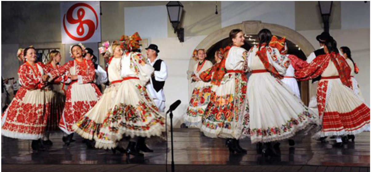
Slika 19: 47. Međunarodna smotra folklora u Zagrebu

narodnih nošnji. Intenzivnije se obnavljaju i plesna i glazbena folklorna tradicija, obnavljaju se ili osnivaju kulturna društva i udruge u selima ili zavičajna društva u gradovima u koje su se doselili ili su prognani stanovnici pojedinih područja, uz želju za očuvanjem i izražavanjem lokalnih posebnosti folklornih plesova, pjesama i običaja. 47