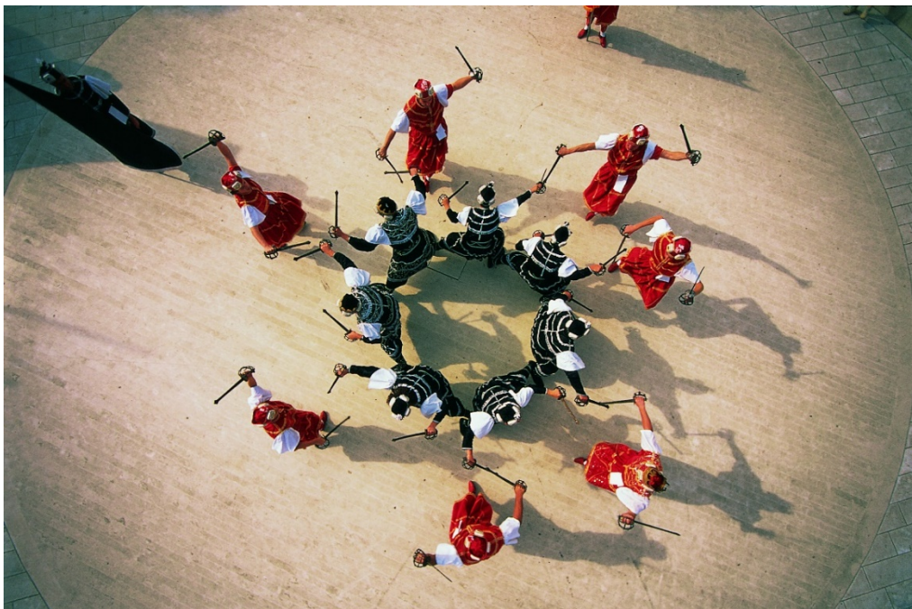
Slika 14: Moreška na Korčuli iz zraka