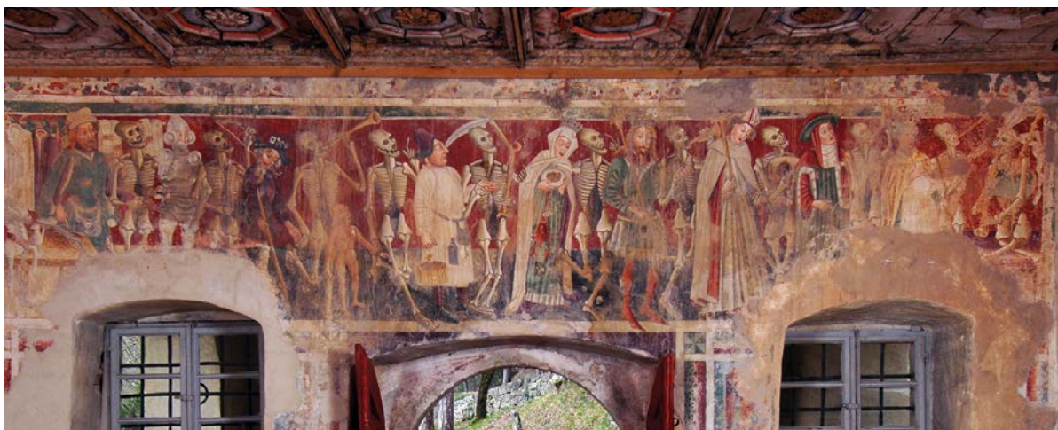
Slika 1: Prikaz fresaka u Bermu