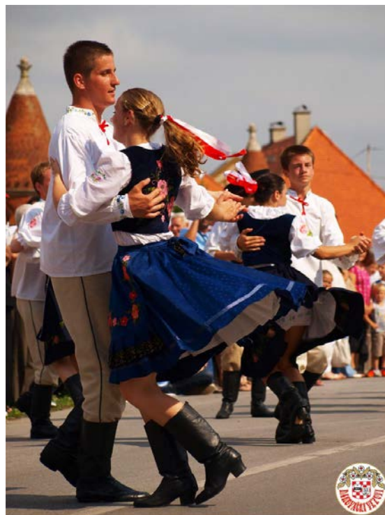
Slika 22: Đakovački vezovi