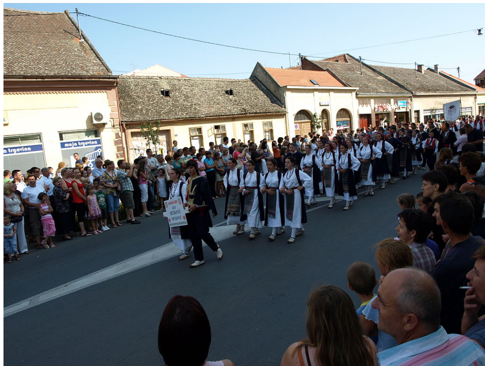
Slika 23: Đakovački vezovi, povorka folklornih skupina