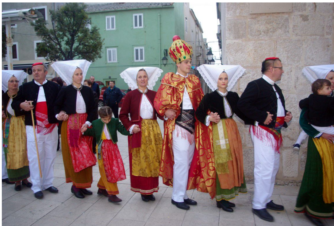
Slika 3: Paško kolo, Pag