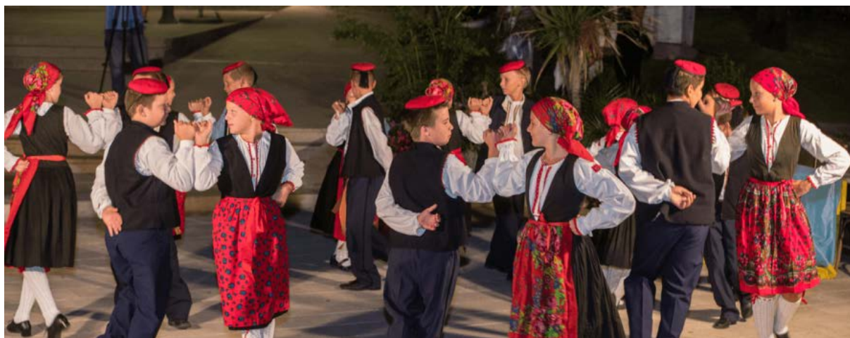
Slika 7: Rapski tanac