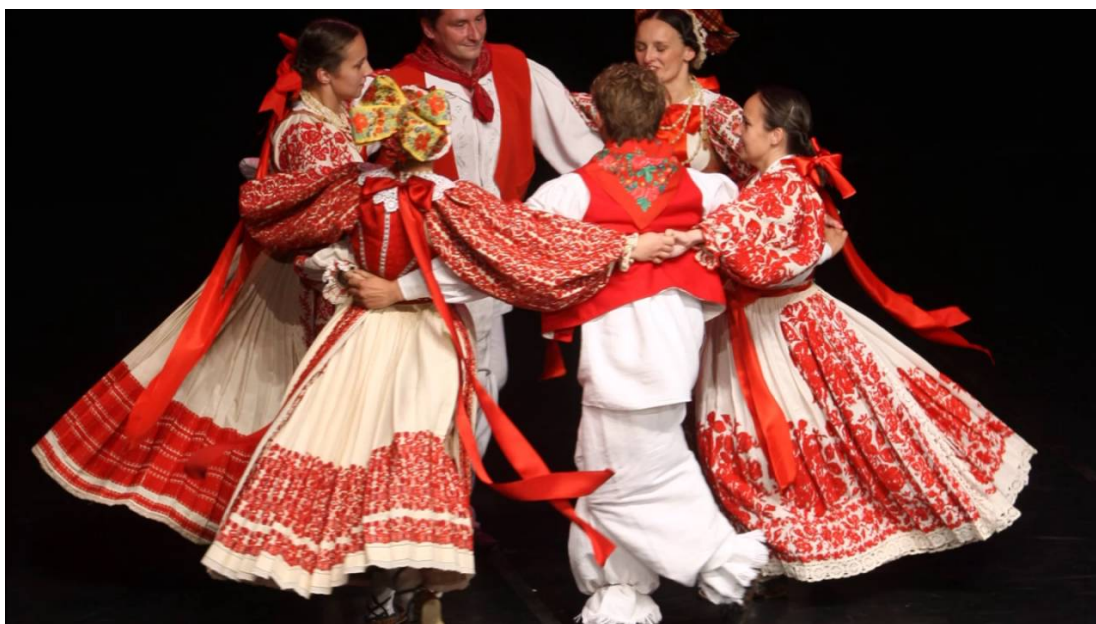
Slika 17: Drmeš