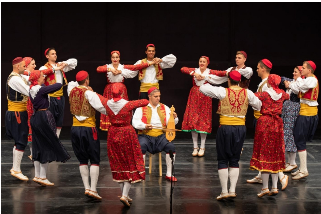
Slika 12: Lindo