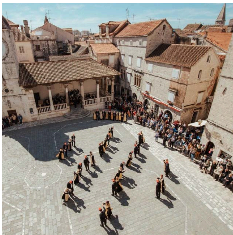
Slika 8: Kvadrilja u Trogiru