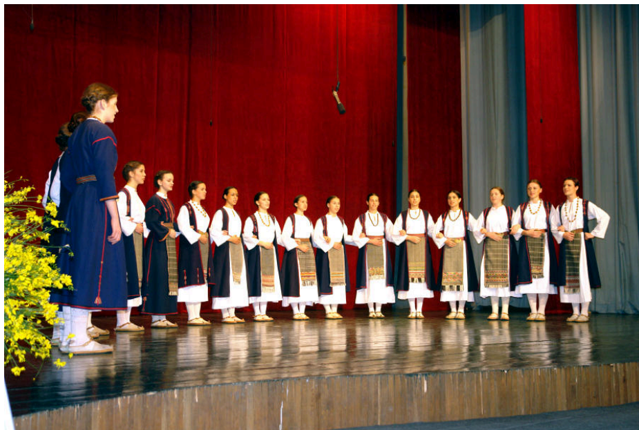
Slika 25: Smotra folklor „Na Neretvu misečina pala“