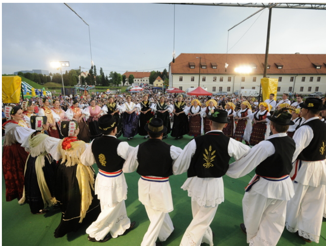
Slika 15: Šokačko kolo