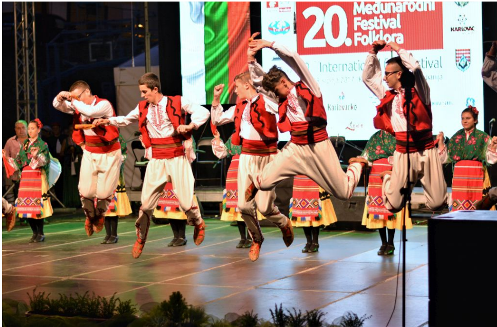
Slika 26: 20. Međunarodni festival folklora u Karlovcu