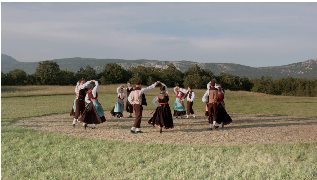
Slika 5: Istarska polka