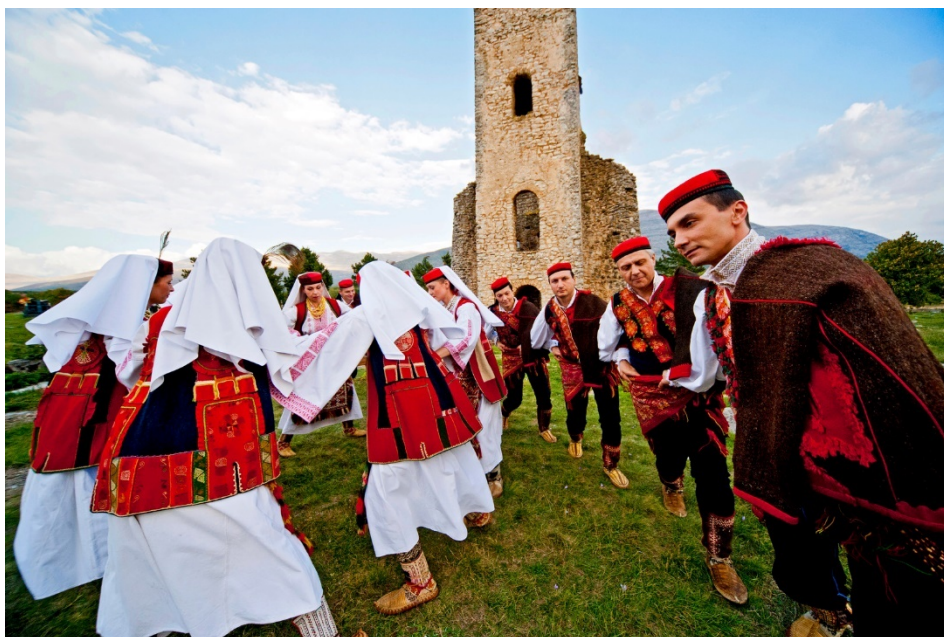
Slika 10: Nijemo kolo