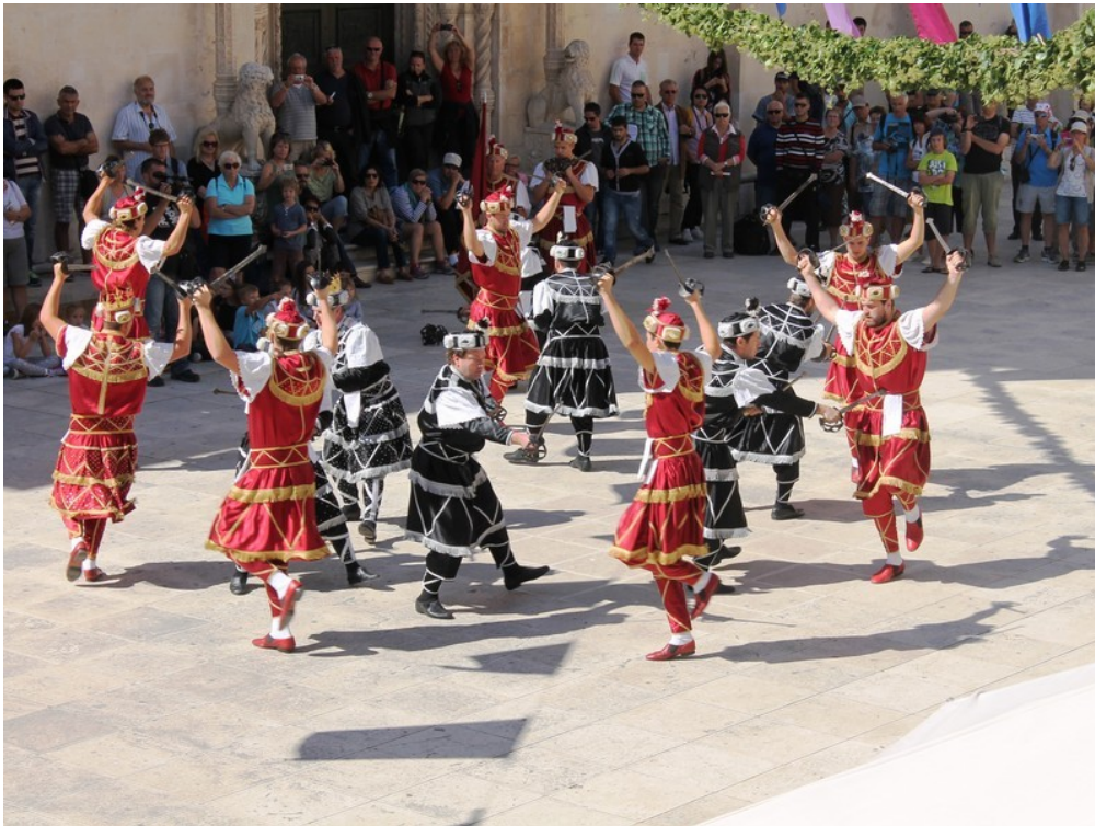
Slika 13: Moreška na Korčuli