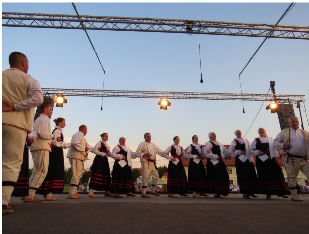
Slika 24: Brodsko kolo – folklorna večer