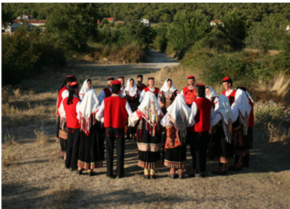
Slika 9: Nijemo kolo