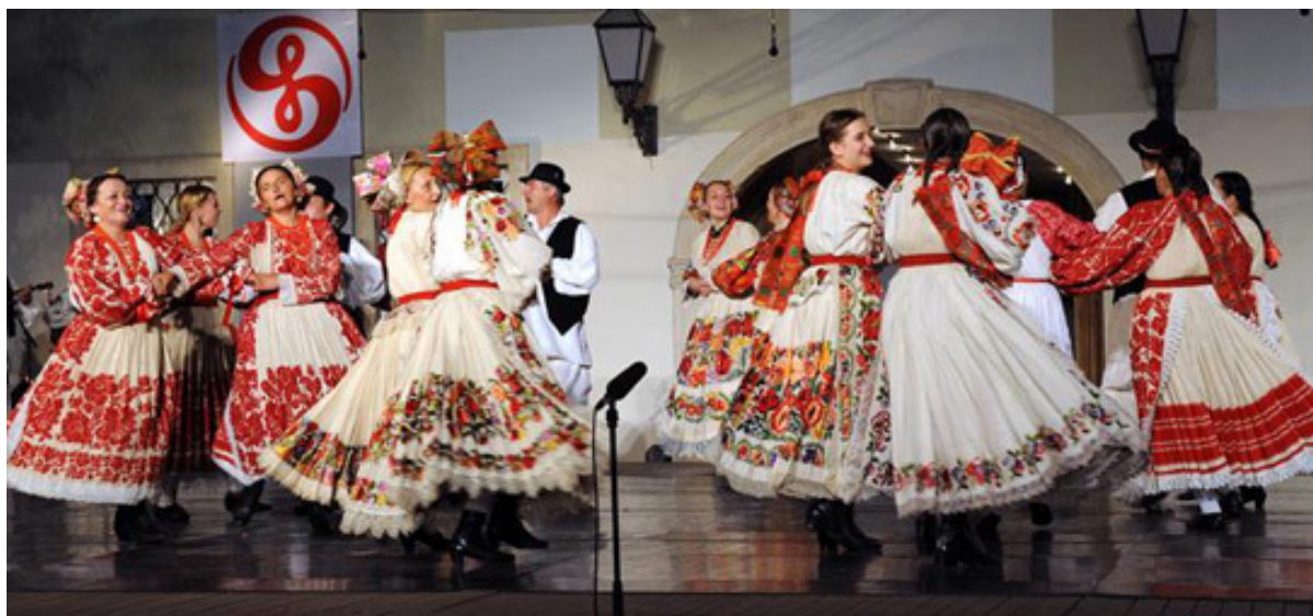
Slika 19: 47. Međunarodna smotra folklora u Zagrebu

narodnih nošnji. Intenzivnije se obnavljaju i plesna i glazbena folklorna tradicija, obnavljaju se ili osnivaju kulturna društva i udruge u selima ili zavičajna društva u gradovima u koje su se doselili ili su prognani stanovnici pojedinih područja, uz želju za očuvanjem i izražavanjem lokalnih posebnosti folklornih plesova, pjesama i običaja. 47